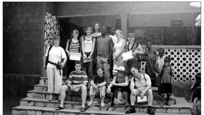
Das Togoteam vor der Krankenstation im Dorf Animadé