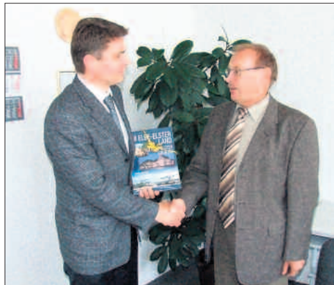
Polizeipräsident Klaus Kandt (l.) und Landrat Klaus Richter werden auch in Zukunft eng zusammenarbeiten.

Es zählt zu den häufigsten Unfallursachen im Landkreis. Unverantwortlich für Landrat Richter ist auch das Fahren bei Rot, besonders bei Baustellenampeln. Polizeipräsident Kandt wird dieses Fahrverhalten dem Schutzbereich nahebringen, der darauf im gesamten Landkreis reagieren wird. Klaus Kandt wünscht sich weiterhin eine gute Zusammenarbeit mit den Kommunen und dem Landkreis. Kandt: "Besonders beim Thema Rechts müssen wir zusammenarbeiten. Das kann die Polizei allein nicht leisten". Er sah dies mit Blick auf die anstehenden Wahlen ab 2008 für alle Parlamente. (hf)