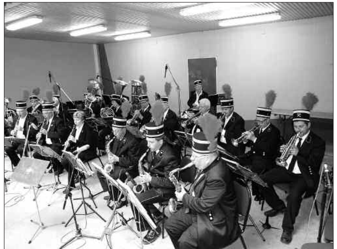
Das Orchester der Bergarbeiter Plessa e. V.

Doch die Zahl 13 für das 13. Kreisblasmusikfest sollte sich als Glückzahl erweisen und so strömten im Laufe des Nachmittags immer mehr Blasmusikfreunde nach Schönborn. Dieses Mal hatte das Kulturamt mit der Auswahl der Kapellen den Begriff Blasmusik sehr weitläufig ausgelegt. Nicht nur die klassische Blasmusik für die ältere Generation wurde ausgesucht, die Musiker spielten Blasmusik auch im Big-Band-Sound, gaben Hits der größten Rockbands und Sänger wieder, interpretierten musikalisch die Volksmusik, spielten Dixielandrhythmen oder gaben bekannte Filmtitel bravurös zu Gehör.