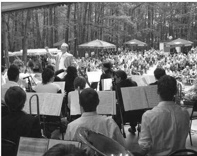
Das Jugendblasorchester der Kreismusikschule „Gebrüder Graun“, Regionalstellen Herzberg & Bad Liebenwerda bei „Sailing“

Das Festival zeigte auch 2007 die Leistungsdichte und das hohe Niveau, auf dem im Landkreis Elbe-Elster Blasmusik gemacht wird. Langjährige Besucher des Festes konnten bei fast allen Kapellen eine gesteigerte musikalische Qualität nachvollziehen. (hf)