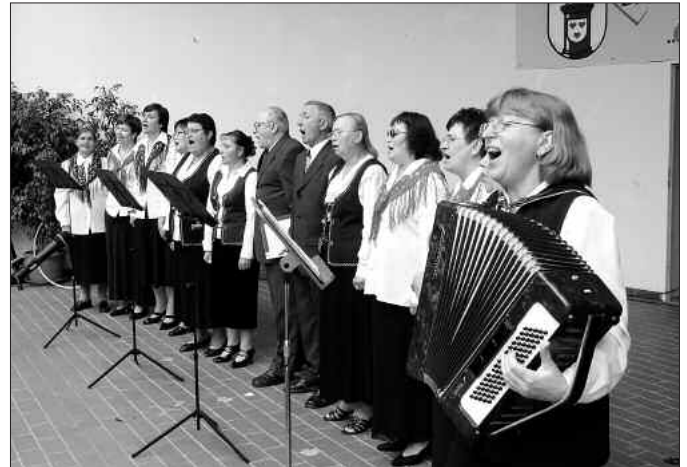
Der Aussiedlerchor „Edelweiß“ aus Finsterwalde regt zum Mitsingen an.