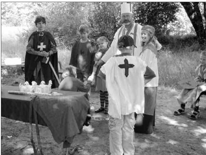
An dieser Station wurden aus jeder Klasse Königin und König gekrönt.