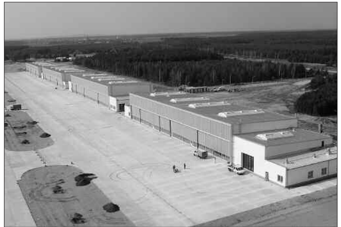
Zukünftig werden in diesen Wartungs-, Abstell- und Instandsetzungshallen auf dem Fliegerhorst in Holzdorf Transporthubschrauber des Typs NH-90 untergebracht.