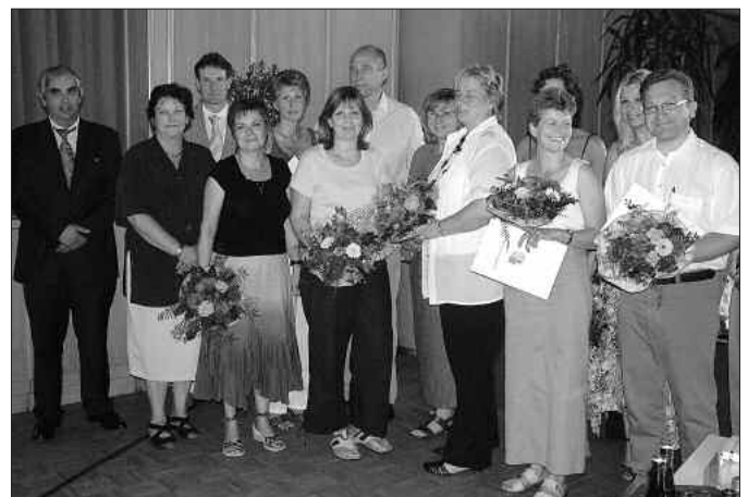
Aufstellung zum Gruppenbild für die Lehrer nach der Übergabe der Zertifikate

Er wünschte ihnen viel Erfolg bei ihrer Arbeit, die ab dem Schuljahr 2007/2008 in Absprache mit dem Staatlichen Schulamt Cottbus über die Grenzen des Elbe-Elster-Kreises hinaus für den gesamten Schulamtsbereich Cottbus nutzbar gemacht wird.