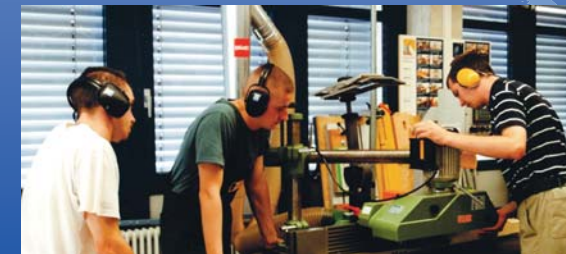
Eine gute Ausbildung in den Unternehmen erhöht die Beschäftigungschancen.