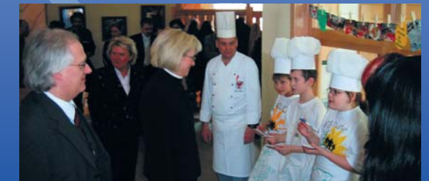
Ministerin Ziegler in der Bildungseinrichtung Buckow e.V.