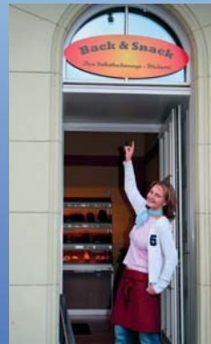
Stolz und Freude über das eigene Geschäft