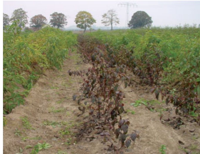
Samenplantage für Hartriegel aus gebietsheimischen Vorkommen bei Nauen