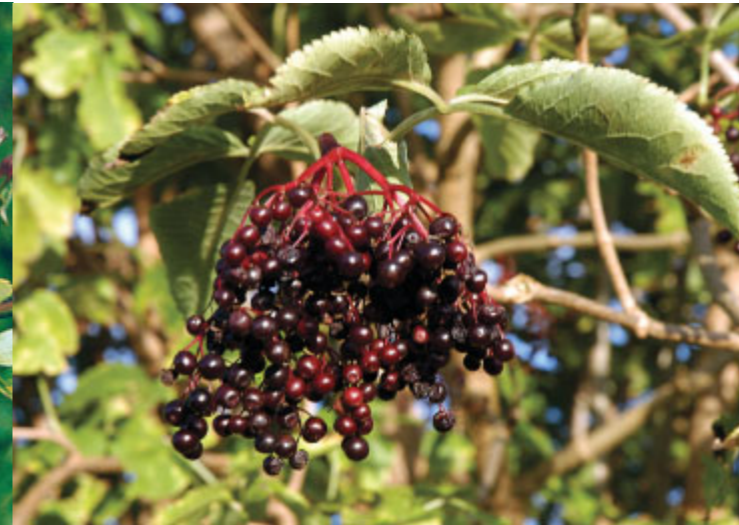
Fruchtstand des Schwarzen Holunders

sammengeschlossen und informieren Sie gern über Gehölzsortimente und Angebote.