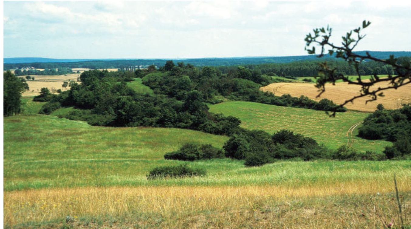
Hecken in der Uckermark

nach § 23 Abs. 1 des Jagdgesetzes für das Land Brandenburg (BbgJagdG) vom 9. Oktober 2003 (GVBl. I, S. 250).