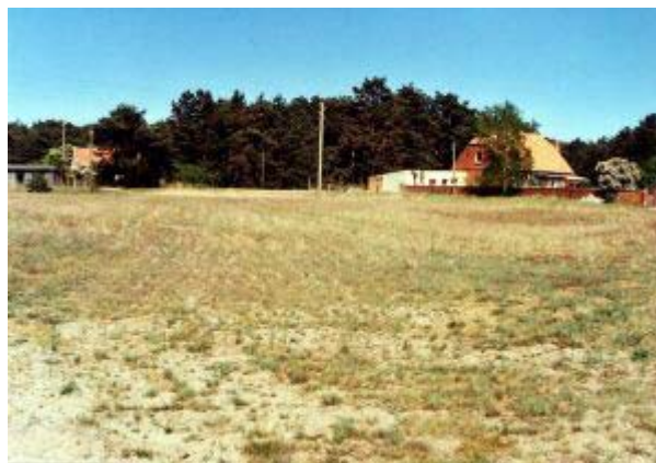
Abb. 5: Silbergrasflur der Vegetationsaufnahme 31

Als in Brandenburg gefährdete (3) Art ist in der Aufnahme 6 Leucanthemum vulgare zu nennen, die mit einem Individuum auftritt. Die Aufnahme 31 weist mit Armeria maritima ssp. elongata eine in Deutschland gefährdete (3) Art auf.