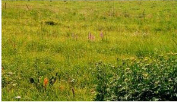
Abb. 12: Vegetationsaufnahme 64