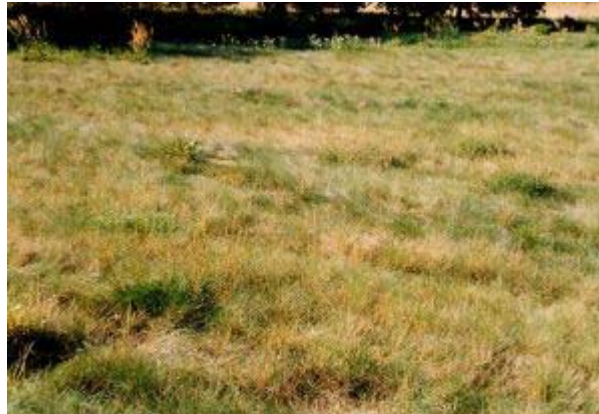
Abb. 4: Vegetationsaufnahme 6: Armerio-Festucetum trachyphyllae

sich auf die Ordnung der typischen Silbergrasgesellschaften – Corynephoralia und die Ordnung des Festuco-Sedetalia , die für die Sandsteppen-Gesellschaften steht.