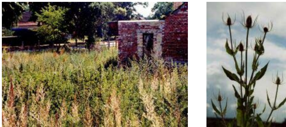
Abb. 10: Cirsietum vulgaris–arvensis und Wilde Karde auf dem ehemaligen Bauschuttwall in der Werbener Straße

Staudenfluren sind im SB kaum vorhanden. Oft handelt es sich nur um kleinflächige Stellen, z.B. an Straßenecken oder sie beschränken sich auf Saumbereiche, die in einem gesonderten Kapitel betrachtet werden (s. Kap. 2.1.3.2). Der Ordnungssinn innerhalb von Siedlungen lässt großflächige Verstaudungen kaum zu. Dies führte am aktuellen Beispiel dazu, dass eine im Sommer 2000 kartierte Fläche (Aufnahme 43) mittlerweile beraumt wurde. Diese Aufnahme wird dennoch kurz beschrieben, um die Vegetation, die sich an derartigen Stellen des SB herausbilden kann, darzustellen.