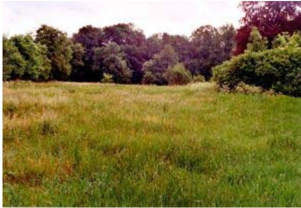
Abb. 7: Vegetationsaufnahme 47.1: ruderalisiertes Arrhenatherion

bezeichnenderweise der Verbreitungsschwerpunkt in ruderalen Glatthaferbeständen zugesprochen (POTT 1995). Einen Hinweis auf die vorherrschenden etwas feuchteren Bodenverhältnisse gibt u.a. Poa trivialis . Eine Besonderheit dieser Fläche ist das Vorkommen mehrerer Rote-Liste-Arten. Drei der Arten gelten in Brandenburg als gefährdet (3). Es handelt sich dabei um Campanula patula , Leucanthemum vulgare agg. und Trisetum flavescens . Eine weitere Art, die am Rande der Aufnahmefläche gefunden wurde, ist Iris variegata , die in Deutschland als vom Aussterben bedroht (1) gilt. Es handelt sich bei ihr um eine ursprüngliche Zierpflanze, die gelegentlich verwildert. Ihren Verbreitungsschwerpunkt besitzt sie jedoch im Süden Deutschlands, auf den sich auch die Einstufung in die Rote Liste Deutschlands bezieht.