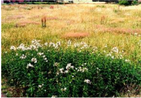
Abb. 11: Vegetationsaufnahme 7: ruderalisiertes Arrhenatherion mit Saponaria officinalis im Vordergrund

Die Aufnahmen 7.1 und 7.2. sind beispielhaft für das ruderalisierte Arrhenatherion . Der Grund ihrer getrennten Kartierung lag in der unterschiedlichen Höhe des Bestandes. Die Auswertung ergab jedoch eine ähnliche pflanzensoziologische Einordnung. Die Aufnahme 7.1 ist der etwas hochwüchsigeren Bestand und wird von Alopecurus pratensis dominiert. So ist hier eine Tendenz zum Alopecuretum pratensis festzustellen. Im häufiger gemähten und dadurch niedrigeren Teil (Aufnahme 7.2) dominiert hingegen Poa pratensis agg.. In Straßennähe gesellt sich Saponaria officinalis in Form eines kleinen zu 100 % von ihr dominierten Bestandes hinzu. Sie kommt lt. OBERDORFER (1994) häufig in Unkrautfluren, vor allem innerhalb von Auellandschaften an Wegen vor.