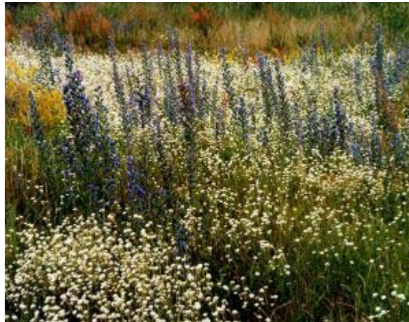
Abb. 6: Vegetationsaufnahme 27: Berteroetum incanae ,

Die Standorteigenschaften der kartierten Flächen erstrecken sich hinsichtlich der Feuchtigkeit ausgehend von trockenen Sandstandorten, über trockenes bis frisches Gelände, hin zu frischen bis zeitweise feuchten Bereichen.