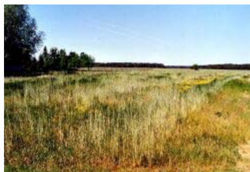
Abb. 3: Vegetationsaufnahme 15 mit einem von Senecio vernalis und Crepis capillaris bestimmten Blühaspekt

Abgesehen von der Gefährdung der Pflanzengesellschaft, befinden sich innerhalb des Bestandes zwei Arten der Roten Liste. Es handelt sich hierbei um Odontites vernus , einer in Brandenburg als gefährdet (3) eingestuften Art – sowohl auf der Roten Liste der Farn- und Blütenpflanzen als auch auf der Roten Liste der Segetalarten. Weiterhin handelt es sich um Filago arvensis , welches auf der brandenburgischen Roten Liste als sehr gefährdet (2) und in Deutschland als gefährdet (3) gilt. Diese Art tritt auf fast allen untersuchten Ackerbrachen auf.