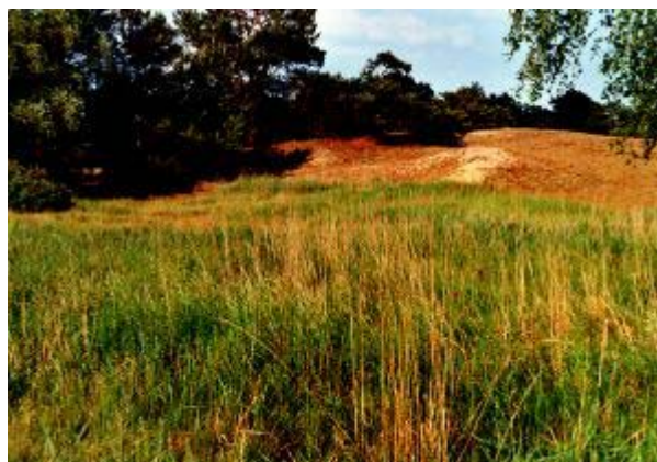
Abb. 9: dünennaher Standort der Vegetationsaufnahme 54

Einen Standort mit wechselnder pflanzensoziologischer Ausprägung stellt die Aufnahme 54 dar. Hierbei handelt es sich um einen Standort, der großflächig zwischen den Wohnhäusern und der Binnendüne, und somit am Rand des SB liegt. Er unterliegt keiner direkten Nutzung, wird jedoch stellenweise durch Müllablagerungen beeinträchtigt. Arten wie Arctium lappa , Chelidonium majus , Chenopodium album , Cirsium arvense , Galium aparine und Urtica dioica häufen sich oder treten überhaupt erst dort auf, wo Müll wild abgeladen wurde.