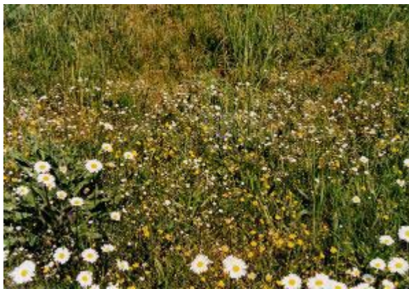
Abb. 13: Detail der Friedhofswiese, Aufnahme 4.1

Hierbei handelt es sich um eine pflegebedingte Gesellschaft, die nach der Aussaat einer beliebigen Rasensaatgutmischung, unter häufiger Schur und evtl. Düngung zur Entwicklung gelangt. Das Cynosurion beherbergt ursprünglich die Gesellschaften der Weiden. Aufgrund ähnlicher Auswirkungen auf die pflanzensoziologische Zusammensetzung der Bestände infolge häufiger Mahd, wurden auch Scher- und Parkrasen zu diesem Verband gestellt. Hier dominieren niedrigwüchsige Pflanzen, die der häufigen Mahd und der Trittbelastung durch ihren Kleinwuchs ausweichen.