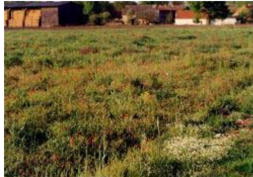
Abb. 2: Vegetationsaufnahme 9 - westlicher Randbereich: Papaveretum argemones

Aus der Tabelle 4 geht bereits hervor, dass es sich bei keiner Fläche um eine reine Ausbildung einer Pflanzengesellschaft handelt. In den meisten Fällen liegt der Schwerpunkt in einer Gesellschaft, wobei Übergänge zu weiteren Gesellschaften durch Dominanzen bestimmter Charakterarten deutlich werden.