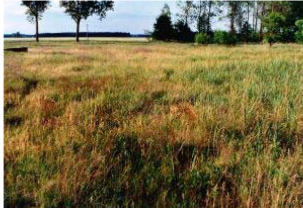
Abb. 8: Vegetationsaufnahme 56

Weiter östlich und nördlich im Übergang zum Röhrichtgürtel des nahen Stemmwehls bildet Calamagrostis epigejos einen dichten Bestand.