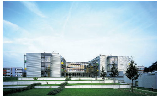
Max-Planck-Institut für Molekulare Pflanzenphysiologie

www.garching-innovation.mpg.de www.metanomics.de www.plantec.de