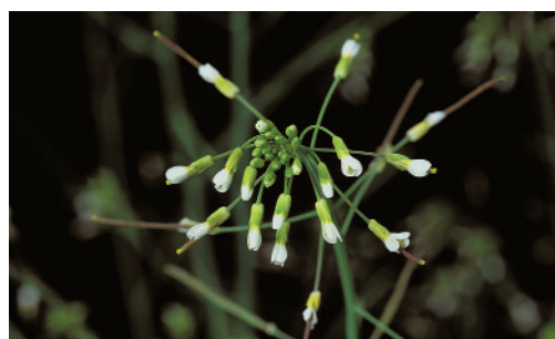
Arabidopsis thaliana , Blüte

Bearbeitet werden diese komplexen Fragestellungen durch ein internationales und interdisziplinäres Wissenschaftlerteam aus den unterschiedlichsten naturwissenschaftlichen Bereichen wie der Bioinformatik, der Biophysik, der Biochemie, der Genetik, der Gentechnologie und den Agrarwissenschaften. Zum Einsatz kommen modernste Analytikverfahren und Forschungsansätze. Es werden neue Technologien entwickelt oder an die jeweiligen Fragestellungen angepasst, um Erkenntnisse an der lebenden Pflanze, also am intakten System, zu gewinnen. Zentraler Ansatz ist die Analyse solcher