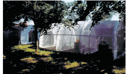
Haltung von ausgesuchten Arbeitsbienen in Flugkäfigen

Ein weiterer erfolgversprechender Resistenzmechanismus der Honigbiene gegenüber der Varroamilbe ergibt sich aus einem bei den hiesigen Bienen vereinzelt gefundenen Abwehrverhalten. Dieses äußert sich im Putzen von befallenen Stockgenossinnen, Erfassen und Verletzen von in und auf den Zellen befindlichen Milben und dem Öffnen sowie Ausräumen befallener Brutzellen. Mit einer von den Bienen nicht wahrnehmbaren Infrarot-Aufnahmetechnik werden Langzeitbeobachtungen an mit Varroa infizierten Waben und individuell markierten Bienen gemacht. Die Auswertung dieser Aufnahmen zum Ausräumverhalten einzel-