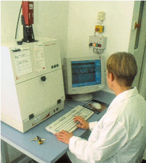
Imagingsystem zur Gelanalyse (MolBioDiagnostik-Labor)

Allerdings fehlen in diesem Stadium meist die klinischen Symptome, wodurch eine frühzeitige Diagnose erschwert ist. Im weiteren Verlauf der Krankheit treten charakteristische klinische Symptome auf, die dem Imker die Verdachtsdiagnose AFB ermöglichen. In der Regel ist zu diesem Zeitpunkt das Volk nicht mehr zu retten. Um eine weitere Ausbreitung der Seuche zu verhindern, muss eine Abtötung des Volkes durch den Tierarzt angeordnet werden.