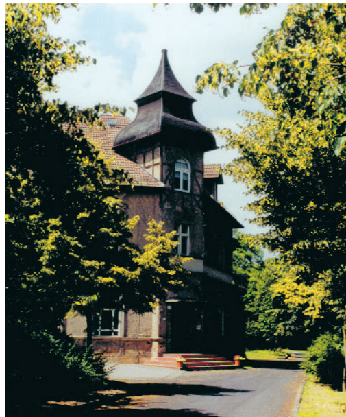
Verwaltungs- und Forschungsgebäude