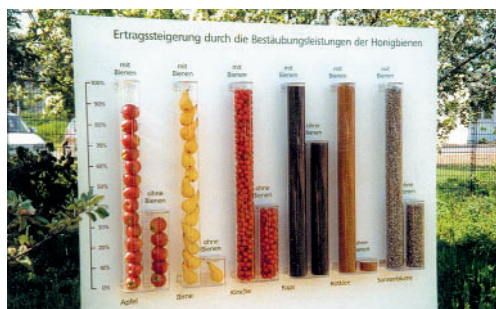
Ertragsleistung mit und ohne Honigbienen

produktion liegt in Deutschland bei etwa 25.000 Tonnen jährlich. Der Nutzen der Bestäubung für die deutsche Landwirtschaft, den Obst- und Gartenbau wird mit mehreren Milliarden Euro beziffert. Durch die Bestäubung von Wildpflanzen tragen Honigbienen auch zum Erhalt des Artenreichtums in der Pflanzenwelt bei und leisten somit einen unschätzbaren kulturökologischen Beitrag.