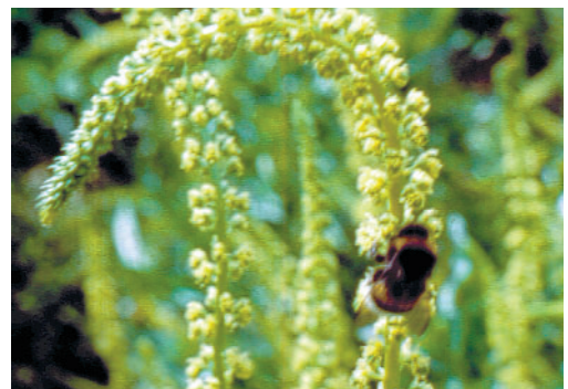
Erdhummel auf Färberresede

Im Bereich der Bestäubung/Ökologie wird die Bestäubung landwirtschaftlicher Nutzpflanzen (Sonnenblume, Raps, Färberresede) durch Honigbienen und andere blütenbesuchende Insekten untersucht. Als Untersuchungsparameter dienen die Bestäuberdichte, deren Aktivität auf den Blüten, die von den Pflanzen produzierte Nektar- und Pollenmenge, der Pollentransfer durch Insekten beziehungsweise Wind sowie die Messung des Ertrags und der Produktqualität. Über diesen ökonomisch orientierten Wert der Bestäubung durch Bienen hinaus wird die ökologische Bestäubungsleistung in naturnahen Gebieten erfasst. Mittels Pollenanalysen und Nektar- sowie Honiganalysen, gekoppelt mit Freilandbeobachtungen an verschiedenen Blütenpflanzen, wird das Trachtspektrum der Bienen ermittelt, um die Bedeutung der blütenbesuchenden Insekten an der Bestäubung der Wildpflanzen und damit an der Erhaltung und Verbreitung der natürlichen Flora zu erfassen. Der Rückgang von naturnahen Flächen mit einer Vielfalt an Blütenpflanzen bedeutet erhebliche Nahrungseingänge für blütenbesuchende Insekten, darunter für viele Nützlinge. Deshalb wurden Saatgutmischungen mit Blütenpflanzen – besonders für stillgelegte Ackerflächen – entwickelt und unter landwirtschaftlichen Bedingungen getestet, um die Entwicklung von Bienen, Schwebfliegen und anderen Nützlingen zu fördern. Ein wichtiges Ziel ist, mittelfristig wieder eine stationäre Bienenhaltung auf Agrarflächen zu ermöglichen.