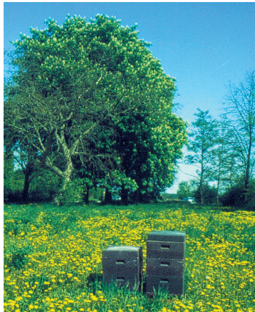
Magazinbeuten im Löwenzahnfeld

Das Länderinstitut für Bienenkunde Hohen Neuendorf e.V. (LIB) ist eine gemeinsam von den fünf Ländern Brandenburg, Sachsen-Anhalt, Sachsen, Thüringen und Berlin getragene Forschungseinrichtung. Es hat den Auftrag, praxisorientierte Forschung zu verschiedenen Aspekten der Bienenbiologie durchzuführen. Als Hauptaufgaben wurden vom Wissenschaftsrat bei der Neugründung des Instituts die Bereiche Zucht und Genetik, Bienenkrankheiten, Honiganalyse und Bestäubung/Ökologie formuliert.