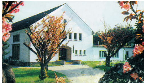
Das Institutsgebäude auf dem Gelände in Schlieben

Das Institut für Umweltforschung wurde im März 1992 als eingetragener Verein gegründet. Sitz des Vereins ist Schlieben. Von 1992 bis 1997 bestand noch eine Außenstelle in Essen und von 1994 bis 1996 in Großbeeren.