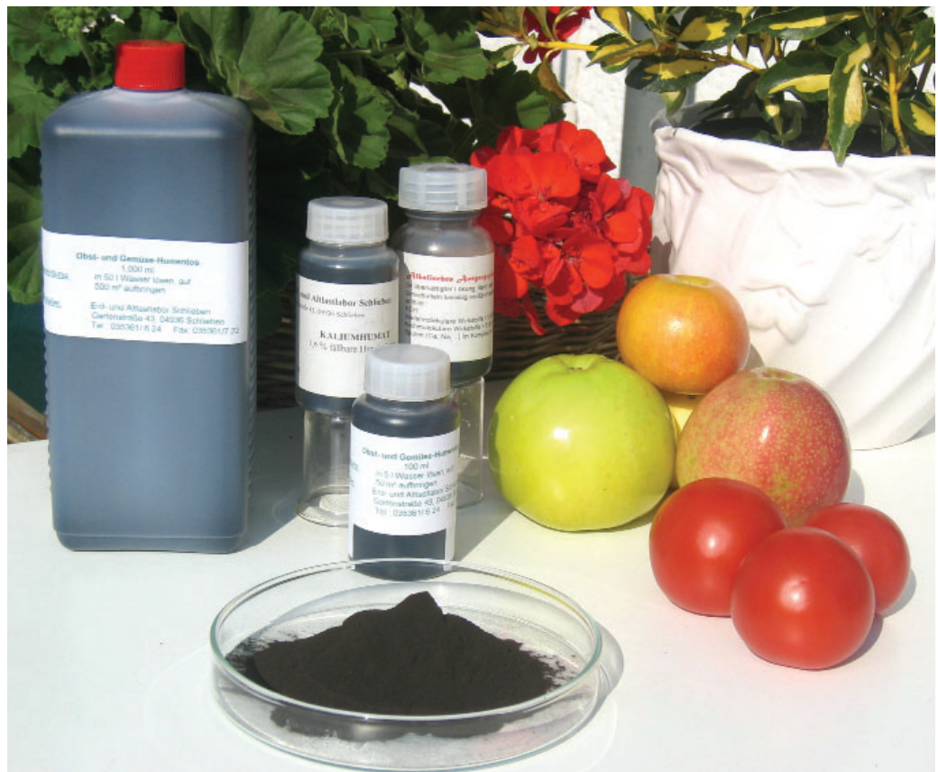
Bodenverbesserer HUMENTOS® aus Lausitzer Braunkohle

Weitere Projekte sind ausgerichtet auf die Nutzung von Abfällen aus der Altpapier- verwertung (Spuckstoffe). Hier wurde die Trennung des Papier-Kunststoff-Gem- isches bearbeitet sowie Anwendungsge- biete der Spuckstoffe als Baustoff für was- serdurchlässige Flächenbefestigungssy- steme untersucht.