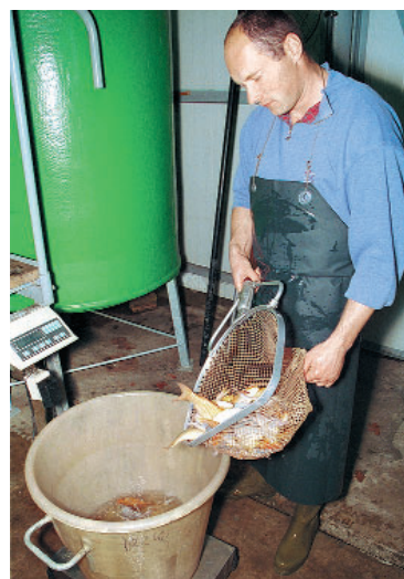
Wiegen von Fischen in der Versuchskreislaufanlage