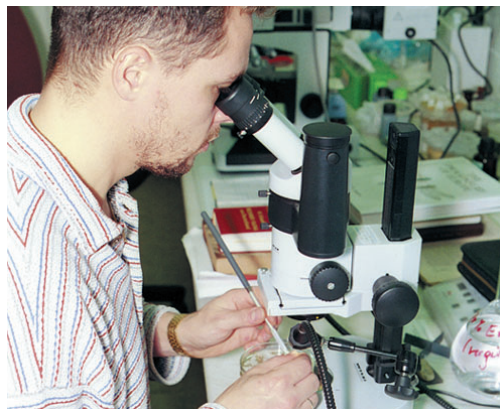
Bestimmung von Fischnährtieren

Geschlossener Kreislauf Anlage zur Fischproduktion mit Wasserreinigung, Sauerstoffanreicherung, Wasseraufheizung und sehr geringem Frischwasserbedarf