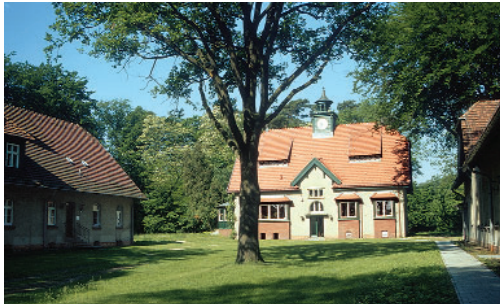
Institutsgebäude in Groß Glienicke

Das Institut für Binnenfischerei e.V. Potsdam-Sacrow (IfB) ist eine Einrichtung der angewandten Forschung auf dem Gebiet der Binnenfischerei. Hauptzuwendungsgeber des Mehrländerinstituts sind die für Fischerei zuständigen Ministerien der Bundesländer Brandenburg und Sachsen-Anhalt.