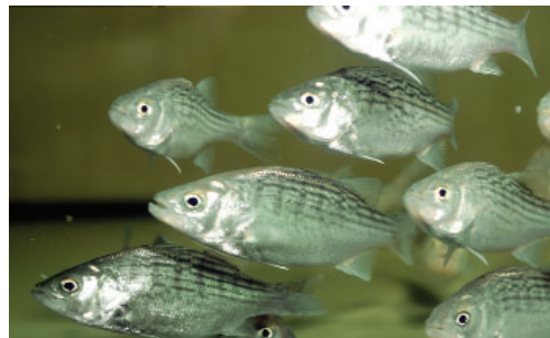
Streifenbarsche - eine neue Fischart für die Produktion

Das Institut steht im engen Kontakt mit Brandenburgs Agrarmarketingvereinigung pro agro. Gemeinsam ist das Bestreben, eine hohe Produktqualität für Fische und Fischprodukte zu sichern. Hierzu haben die Forscher Vorschläge für ein modernes Lebensmittelmarketing vorgelegt. Speziell für Unternehmen der Binnenfischerei wurden einzelne Produktionszweige betriebswirtschaftlich analysiert und bewertet.