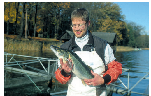
Zander aus eigener Versuchsaufzucht

Für die Warmwasserfischproduktion wurden geschlossene Kreisläufe optimiert. Bearbeitet wurden auch Vermehrungs- und Zuchttechnologien neuer Fischarten für die Satz- und Speisefischproduktion.