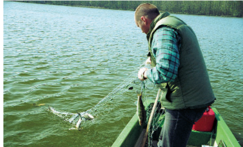
Probefischung eines Sees

Zu den Fragestellungen am Institut gehört unter anderem ein Projekt zur Regulierung der drastisch zurückgehenden Aalbestände. Ziel ist, die gewässertypischen Fischbestände für Berufsfischer und Angler zu erhalten.