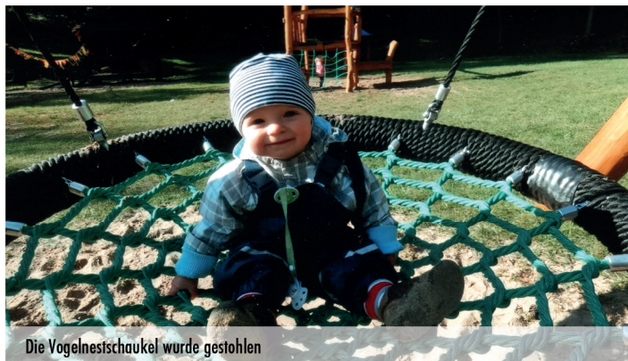
Die Vogelneestschaukel wurde gestohlen

Für unsere Kinder! Die Mitarbeiter der Kneipp-Kita