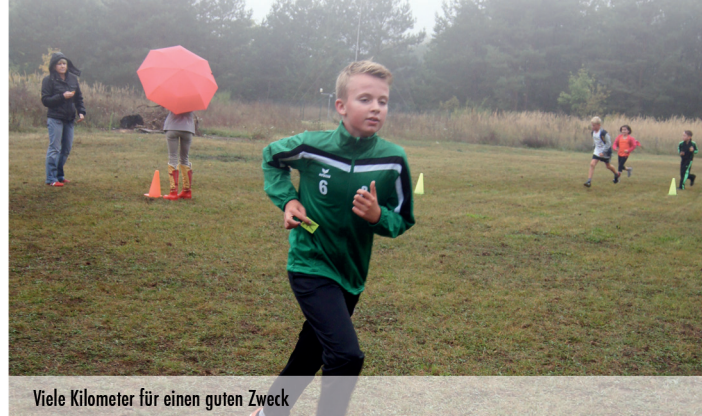
Viele Kilometer für einen guten Zweck

Von dem diesjährigen Erlös des Sponsorenlaufes in Höhe von 1570,19 Euro sollen ein Fahrradunterstand errichtet werden sowie neue kleine Spielgeräte für den Hof und für die Turnhalle angeschafft werden.