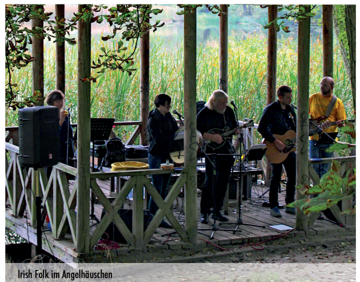
Irish Folk im Angelhäuschen