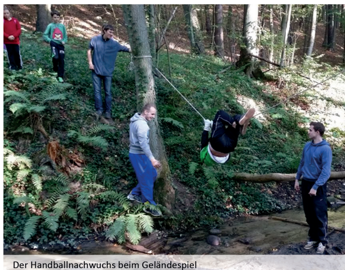
Der Handballnachwuchs beim Geländespiel

Die Handballer der HSV Müncheberg/Buckow