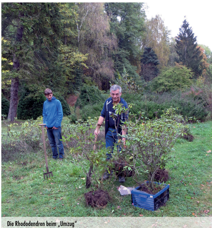
Die Rhododendren beim „Umzug“

Die Lesung zur Geschichte von Park und Schloss mit Lichtbildern von Herrn und Frau Schröck und Heinz Reinke war äußerst facettenreich und brachte allen Anwesenden die früheren Verhältnisse lebhaft näher. Leider reichte auch hier die geplante Stunde keineswegs aus. Spannende Fotos aus den letzten 70 Jahren Parkgeschichte prasselten am Ende im Schnelldurchgang auf die Betrachter ein. So entstand der Wunsch, diese Veranstaltung noch einmal mit ausreichender Muße zu wiederholen.