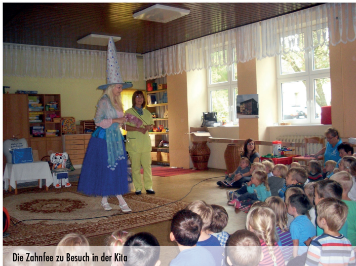
Die Zahnfee zu Besuch in der Kita