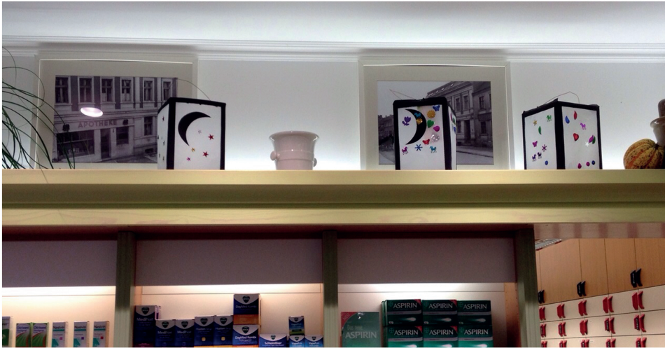
- Anzeige -

Ihnen alles Gute und Grüße aus der Apotheke Ihre Dagmar Katzorke