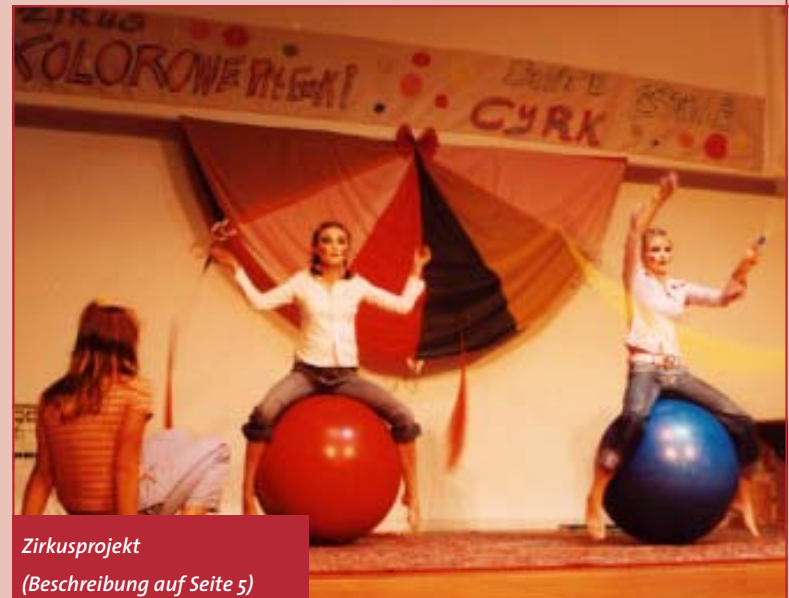
Zirkusprojekt (Beschreibung auf Seite 5)