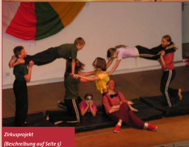
Zirkusprojekt (Beschreibung auf Seite 5)