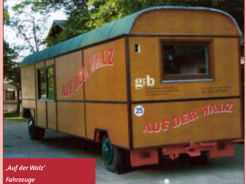
„Auf der Walz“ Fahrzeuge