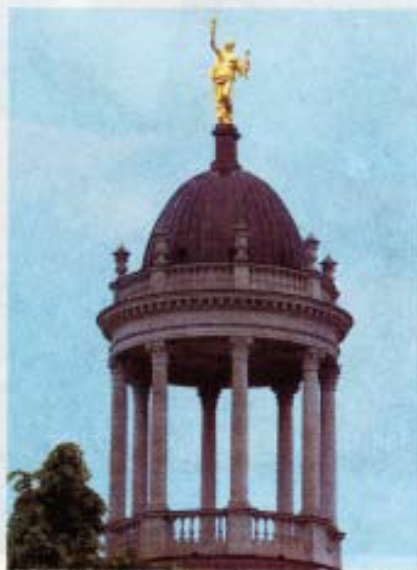
Preiswürdig. Der Monopteros auf dem Militärwaisenhaus.

In luftiger Höhe, der höchste Arbeitsplatz lag 42 Meter über dem Straßenni-