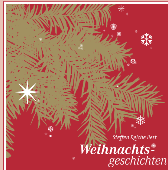
Cover der Weihnachts-CD 2005

Damit die Objektinstallation in der Gedenkstätte fachgerecht und professionell umgesetzt werden kann, sind weitere Mittel erforderlich, die mit Hilfe der CD aufgebracht werden konnten.