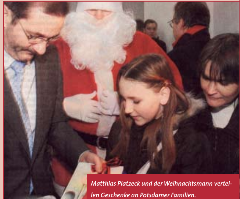
Matthias Platzeck und der Weihnachtsmann verteilen Geschenke an Potsdamer Familien.

MAZ, Potsdamer Stadtkurier, 24. 12. 2005