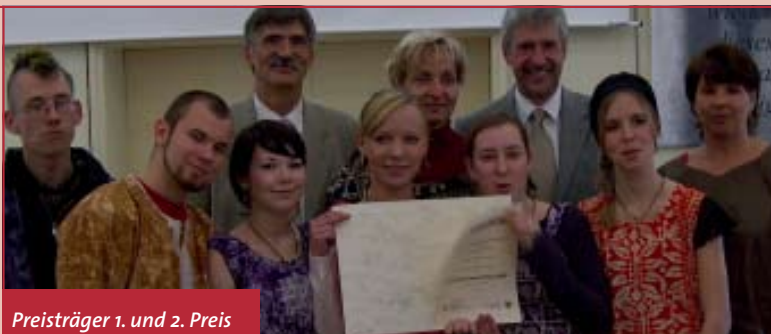
Preisträger 1. und 2. Preis