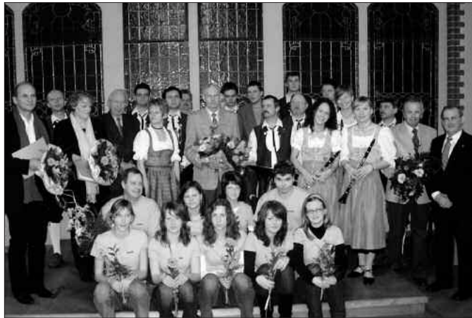
Gruppenbild nach der Verleihung Kulturpreisvergabe 2006