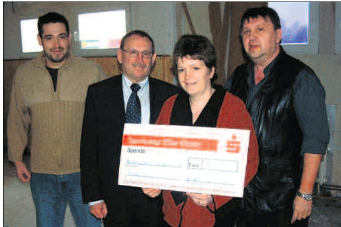
Gern nahm das Elsterdom-Team den symbolischen Scheck des Landrates entgegen.