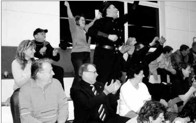
Jubel, vor allem bei den Schornsteinfegern. Sie hatten das Turnier für sich entschieden.

Wer war schon nicht einmal auf die Hilfe eines Handwerkers angewiesen?