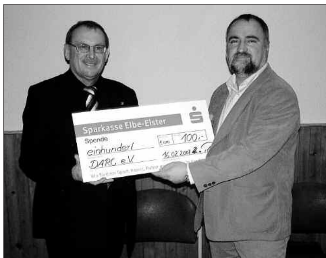
Als Dankeschön und Anerkennung für die Leistungen überbrachte Landrat Klaus Richter eine Spende von 100 Euro für die Vereinsarbeit der Amateurfunker.

Landrat Klaus Richter ließ es sich nicht nehmen der Einladung zur Jahreshauptversammlung zu folgen. Er hörte begeistert dem Jahresrückblick zu. Landrat Richter: „Ich wusste zwar, dass es Ama-