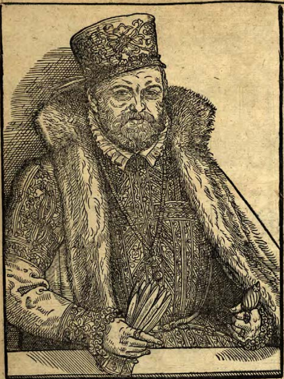
Wiss. Mus. Bibliothek des Bezirkes Potsdam