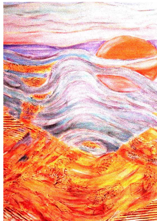
Rote Sonne Collage/Acryl