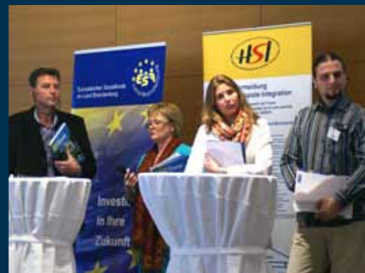
Die transnationalen Partner aus Spanien, Nordirland, Niederlande und Bulgarien verfolgen die Projektergebnisse