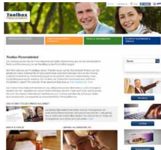
Die Homepage des Projekts Toolbox Personalarbeit

Die Toolbox Personalarbeit für soziale Einrichtungen zur Fachkräftesicherung ist ein Projekt der zukunft im zentrum GmbH. Sie unterstützt Unternehmen bei der Bewältigung des Fachkräftebedarfs.