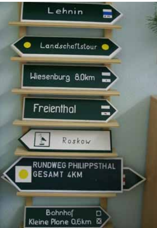
Produkte des Regionalbudgetprojekts „Wanderwegemanagement“ im Landkreis Potsdam-Mittelmark

„Arbeit für Brandenburg“ wurde häufig mit Arbeitsgelegenheiten in der Entgeltvariante kombiniert. Das Regionalbudget ergänzte Arbeitsgelegenheiten mit Mehraufwandsentschädigung um Qualifizierungsanteile. Die meisten Gründer der Lotsendienste erhielten den Gründungszuschuss. Jetzt sind neue Kombinationen und Maßnahmen gefragt. Das Land und die Träger stellen sich darauf ein.