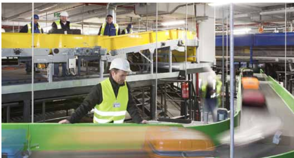
Dienstleistungsunternehmen auf dem Airportgelände profitieren direkt und indirekt

Die südlich an die Bundeshauptstadt angrenzenden Brandenburger Kreise werden voraussichtlich am stärksten vom neuen Großflughafen profitieren. Verantwortlich hierfür sind zum einen die unmittelbare Nähe zum Airport und zum anderen das bereits vorhandene Know-how in Produktion und Forschung beispielsweise bei Rolls-Royce, der MTU Maintenance Berlin-Brandenburg oder der Technischen Hochschule Wildau. Außerdem unterstützt das große ausgewiesene (Gewerbe-) Flächenangebot für weitere Ansiedlungen von Luftfahrtindustrie diese Entwicklung. Dienstleistungstätigkeiten sowie Berufe im Produzierenden Gewerbe (insbesondere Ingenieure und Mechaniker) dürften eben-