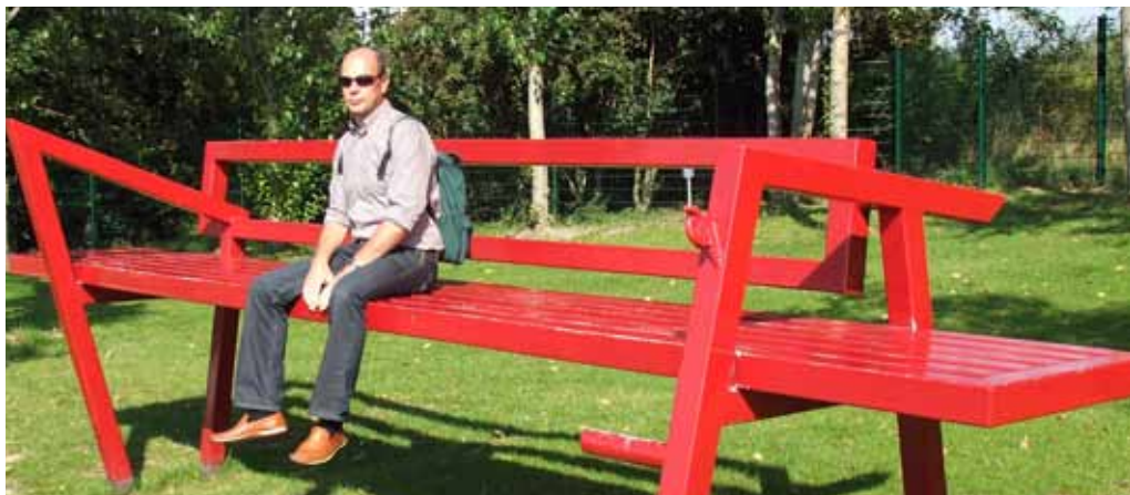
Angesichts der demografischen Entwicklung – kein Thema für die lange Bank: Potenziale Älterer für den Arbeitsmarkt

Das Projekt wird aus Mitteln des ESF und des Landes gefördert.