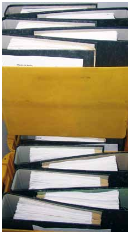
Papierakten sind bei der LASA passé. Das macht die Bearbeitung nicht unbedingt leichter, aber auf jeden Fall umweltfreundlicher und sicherer

Die Erfahrungen insbesondere aus dem vorangegangenen Jahr 2011 haben gezeigt, dass sich die Bearbeitungszeiten gerade im Dezember, infolge der Vielzahl der zu diesem Zeitpunkt eingehenden Mittelanforderungen, deutlich verlängert haben. Die Ursache dafür liegt darin begründet, dass auch die Mittelanforderungen größtenteils belegseitig geprüft werden müs-