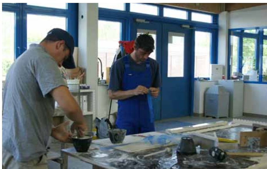
Träger sollten zukünftig verstärkt Angebote zur Aktivierung von Langzeitarbeitslosen entwickeln, empfiehlt der BLV ABS – in Projekten, die über das Regionalbudget gefördert werden, wie hier in der Stadt Frankfurt (O), werden vorgeschaltete Aktivierungsphasen schon erprobt

Brandenburger Landesverband der Arbeits-, Bildungs- und Strukturfördergesellschaften e. V., Roman Zinter, Tel.: (0 33 02) 49 98 04 02, E-Mail: blv-ev@t-online.de