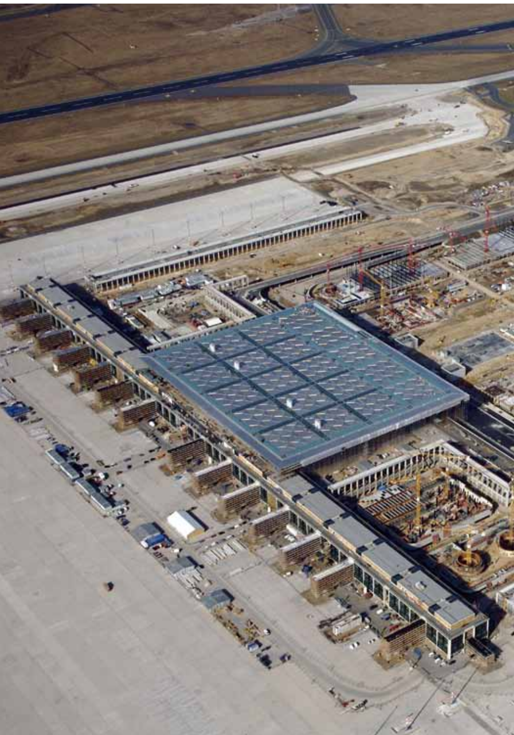
Die Baubranche und ihre Mitarbeiter waren die Ersten, die die positiven Beschäftigungseffekte des Flughafens Berlin-Brandenburg BER festgestellt haben

Am 3. Juni 2012 wird der Flughafen Berlin-Brandenburg BER eröffnet. In der öffentlichen Diskussion waren zuletzt die Flugrouten dominant. Für die Bewohner der Region ist aber die Frage nach den beschäftigungspolitischen Effekten mindestens genauso wichtig. Die vom Institut für Arbeitsmarkt- und Berufsforschung (IAB) durchgeführte Regionalanalyse versucht, auf diese Frage eine Antwort zu geben.