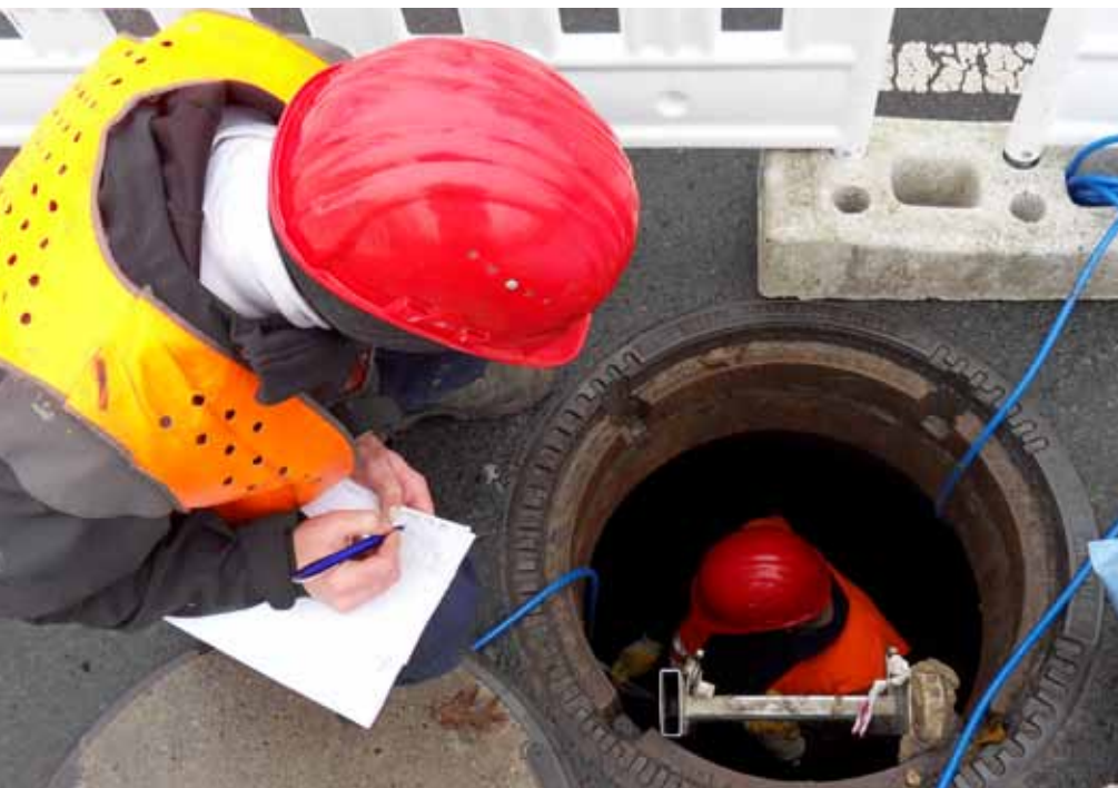
Mitarbeiter der Firma GEOTANK führen eine Dichtheitsprüfung durch, indem ein Mitarbeiter im Schacht Messungen vornimmt, die vom anderen Mitarbeiter dokumentiert werden

Die Orientierungsberatung zielt ausschließlich auf die Fachkräftesicherung, betriebswirtschaftliche Fragestellungen u. a. sind nicht Gegenstand der Gespräche. Sollte sich im konkreten Fall ein spezieller Bedarf abzeichnen, wird auf relevante Beratungsmöglichkeiten hingewiesen.