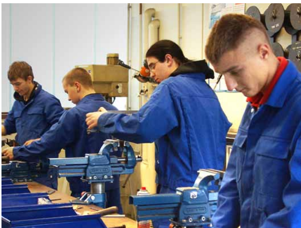
Die Ausbildung ist in Bezug auf das lebenslange Lernen nur ein kleiner Abschnitt im Berufsleben – diese Erkenntnis sollte bereits in der Schulzeit reifen

Kommission der Europäischen Gemeinschaft (2000), ‚Memorandum über Lebenslanges Lernen‘, SEK (2000) 1832, Brüssel, S. 9 f.