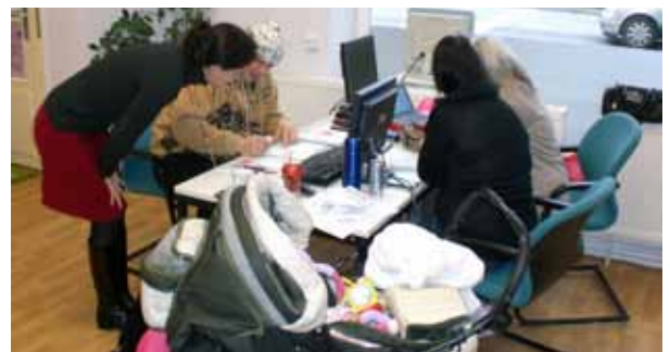
Bild 1 und 2 wurden bei der Eröffnung aufgenommen und Bild 3 zeigt eine Workshop-Situation