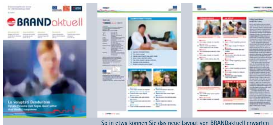
So in etwa können Sie das neue Layout von BRANDaktuell erwarten

Das Arbeitspolitische Programm wird aus Mitteln des ESF und des Landes gefördert.