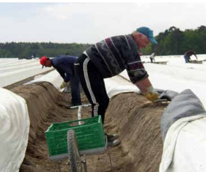
Bereits vor der Arbeitnehmerfreizügigkeit waren polnische Arbeitnehmer als Saisonkräfte in Deutschland tätig

Staatssekretär Dr. Ralf Braukusiepe, Bundesministerium für Arbeit und Soziales