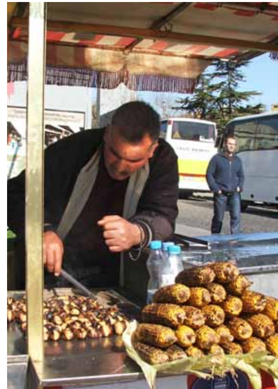
Ausländische Speisegewohnheiten sorgen auch für kulinarische Vielfalt in Deutschland

Kostenloser Download der Studie auf den Internetseiten des BAMF unter http://tinyurl.com/5vxcqlx