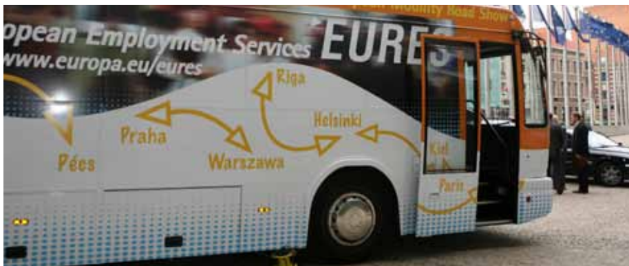
Der EURES-Bus auf Werbetour durch die EU-Mitgliedstaaten macht hier Station in Potsdam

Mit der vom Netzwerk halbjährlich herausgegebenen Online-Zeitschrift FMW-Online (auf Englisch) sollen die Forschungsarbeiten und Debatten über dieses wichtige europäische Recht angeregt werden.