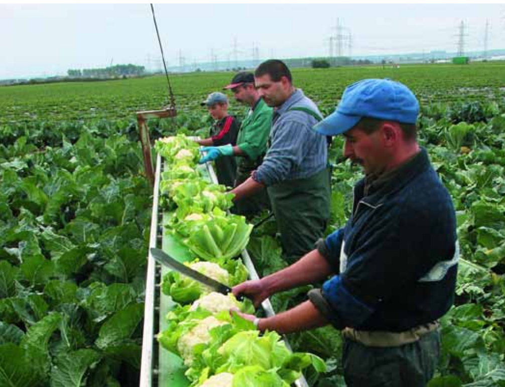
40 Prozent der osteuropäischen Arbeitsmigranten sind im Agrarsektor tätig

Es waren gegensätzliche Szenarien, die im Vorfeld des 1. Mai 2011 entwickelt wurden: So warnte die Gewerkschaftsseite vor einem hohen Ansturm von Arbeitsmigranten, die in Deutschland Lohndumping auslösen würden. Die Wirtschaft versprach sich dagegen von der Grenzöffnung eine Linderung des Fachkräftemangels. Die nüchterne Bilanz nach gut einem halben Jahr zeigt: Nichts von dem ist eingetreten. Nach Angaben der Bundesagentur für Arbeit hatten bis zum Juni dieses Jahres 24.000 osteuropäische Arbeitnehmerinnen und Arbeitnehmer eine sozialversicherungspflichtige oder geringfügige Beschäftigung aufgenommen. Im Land Brandenburg waren es 2.500 Personen.