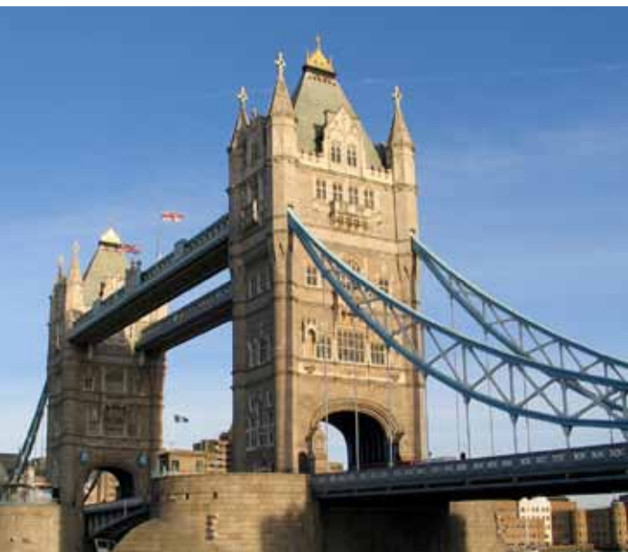
Von den osteuropäischen Arbeitsmigranten, die nach Großbritannien kamen, leben 26 Prozent (2008) in London

Beide Studien können auf den Internetseiten der Friedrich-Ebert-Stiftung heruntergeladen werden: Großbritannien unter http://tinyurl.com/6f53npz ; Irland unter http://tinyurl.com/5v39vvd