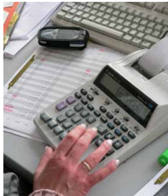
Bei Geld hört nicht nur die Freundschaft auf ...

Intern wurde mit einer personellen Aufstockung des Bereiches der MAF auch eine neue Teamleiterstruktur geschaffen. Sie optimieren die Verfahren zwischen Bewilligung, Mittelanforderung und Verwendungsnachweisprüfung. Das verkürzt die Informationswege zwischen allen Beteiligten. Pro Förderinstrument ist das gesamte Verfahren durch die engere interne Zusammenarbeit zwischen den Bereichen Bewilligung, MAF und Verwendungsnachweisprüfung strukturierter geworden. Koordiniert durch die Teamleiterinnen und Teamleiter, ermöglicht das ein schnelles und ergebnisorientiertes Arbeiten. Außerdem hat der Zuwendungsempfänger damit in der Regel immer den gleichen Ansprechpartner.