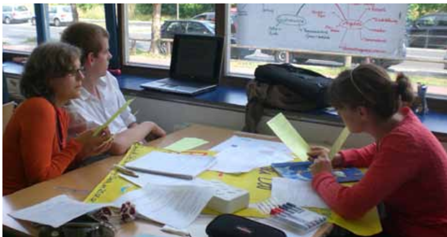
Schülerinnen und Schüler lernen das Unternehmertum in allen Facetten kennen

Es zeigt sich immer wieder, dass es viele Teilnehmende bewegt, dass sie es in nur einer Woche geschafft haben, eine ernst zu nehmende Geschäftsidee zu entwickeln. Sie haben es auch schätzen gelernt, später in gewissem Sinn frei und ihr ‚eigener Herr‘ zu sein. UniClass+ eröffnet neue Perspektiven und stärkt die Jugendlichen während ihrer Phase der Berufsorientierung. Und bei vielen Lehrkräften im Land wäre das Thema Wirtschaft nicht so präsent.