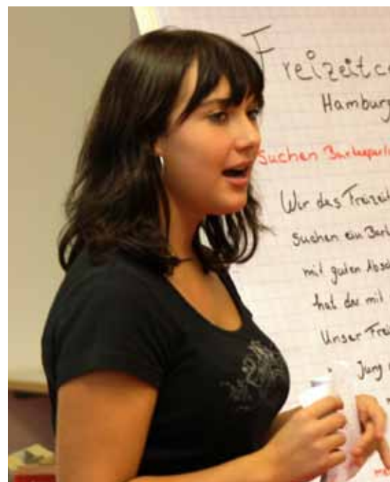
Auch Präsentationen werden geübt

Das Projekt wird aus Mitteln des ESF und des Landes gefördert.