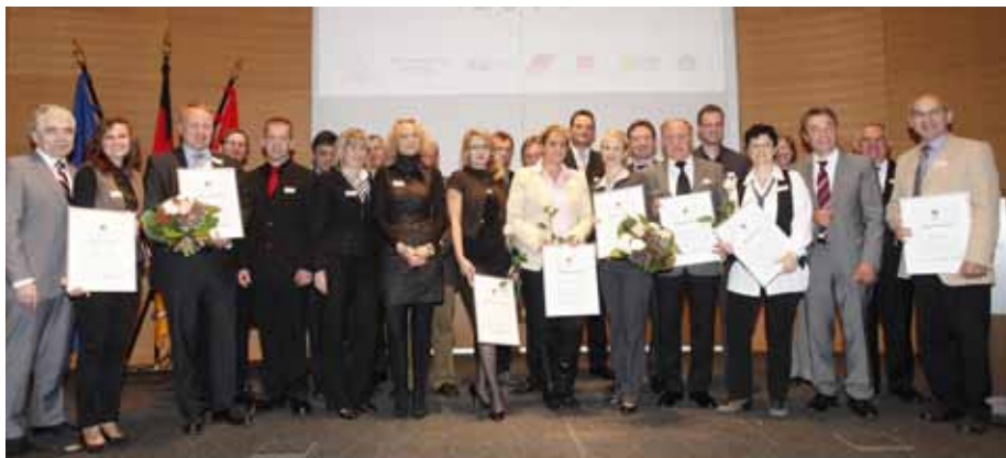
Vertreter und Vertreterinnen der Unternehmen, die den Ausbildungspreis erhalten haben oder mit der Ehrenurkunde ausgezeichnet wurden

Ministerpräsident Matthias Platzeck und Arbeitsminister Günter Baaske würdigten am 20. Oktober 2011 im Brandenburg-Saal der Staatskanzlei Potsdam das hervorragende Engagement und die Qualität der Ausbildung von insgesamt 13 Betrieben. „Die ausgezeichneten Unternehmen setzen in beispielgebender Weise auf die Nachwuchskräfte von heute, die die Fachkräfte von morgen sind“, so der Ministerpräsident in seiner Rede.