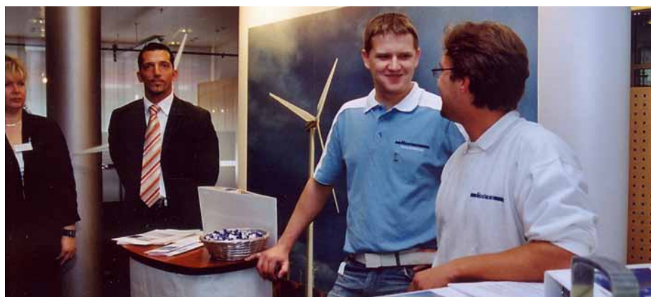
Jugendliche für das Unternehmertum zu begeistern, ist eine Investition in die Zukunft

Ministerpräsident Matthias Platzeck begrüßt das Umdenken in der CDU in puncto Mindestlohn. Er unterstrich die Forderung, dass Menschen von ihrer Arbeit leben können müssen. Das wäre mit der Vorstellung der CDU von einer Lohnuntergrenze von 7,79 Euro im Westen und 6,89 Euro im Osten aber nur