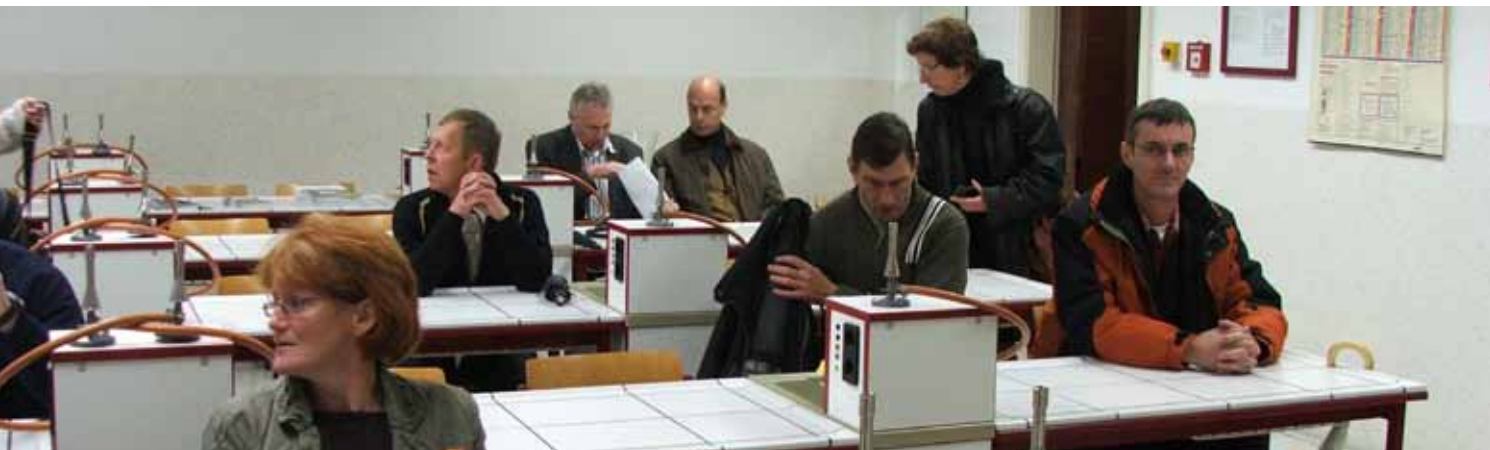
Zur Weiterbildung motiviert sind die Menschen, wenn es im Land auch eine Kultur des lebenslangen Lernens gibt

Neben den bildungsbiografischen Hürden wird die Beteiligung an beruflicher Weiterbildung durch andere Zugangsbarrieren behindert. So ist die Beteiligung an bestimmten Maßnahmen nicht selten nur auf der Grundlage von zertifizierten Abschlüssen möglich. Deshalb sollte, nach Auffassung des Rates der EU,