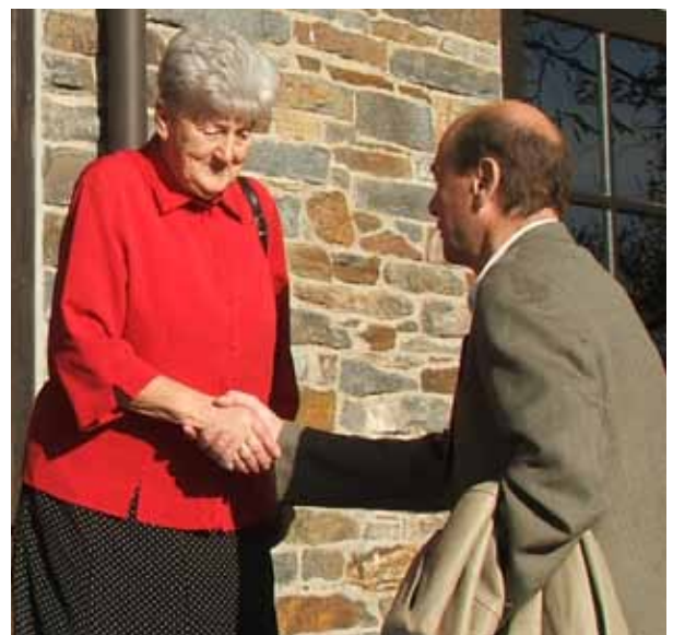
Mit Bürgerengagement kann viel für Menschen und Regionen bewegt werden

In Anbetracht bestehender Hemmnisse werden die Mitgliedstaaten und die EU-Kommission aufgefordert, spezielle Maßnahmen zu ergreifen, um das Potenzial der Freiwilligentätigkeiten besser ausschöpfen zu können. Dazu gehören beispielsweise Austauschprogramme, die Entwicklung zivilgesellschaftlicher Organisationen auf lokaler, regionaler, nationaler und europäischer Ebene oder kurzfristige Freiwilligeninitiativen, die sich leichter mit Erwerbstätigkeit und Familienleben vereinbaren lassen. Mit diesen Maßnahmen erhofft man sich, die gewünschten Effekte zu erreichen. Aus Sicht