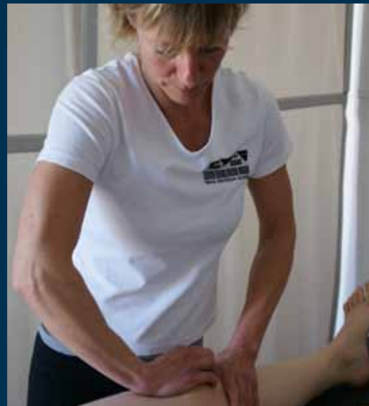
Auch diese Förderprogramme wurden evaluiert: Kompetenzentwicklung in KMU,

Die Evaluierung wurde aus Mitteln des ESF und des Landes gefördert.