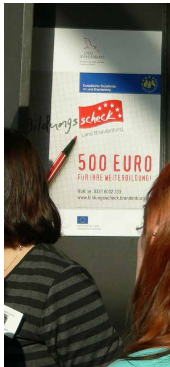
Der Brandenburger Bildungsscheck ist ein Beitrag der Landesregierung, den Anteil Erwachsener an der beruflichen Qualifizierung zu steigern

Auch mit dem für 2012 geplanten komplexen Förderprogramm zur beruflichen Weiterbildung soll zur Erhöhung der Weiterbildungsbeilegung der Beschäftigten im Land Brandenburg beigetragen werden. Weiterhin wird hier die Weiterbildung in Unternehmen entsprechend der betrieblichen Bedarfe gefördert. Es werden besondere Anreize zur Einbindung