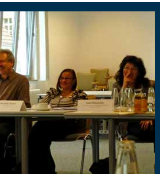
Auf dem Workshop ‚Europäische Transparenz-instrumente‘ gab es gut gelaunte Teilnehmerinnen und Teilnehmer, ...