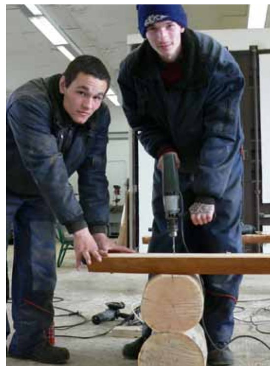
Talente, die in der Schulzeit verborgen blieben, gilt es in der ‚Produktionsschule‘ zu entdecken und zu fördern

Der Bundesverband der Produktionsschulen im Internet: www.bv-produktionsschulen.de