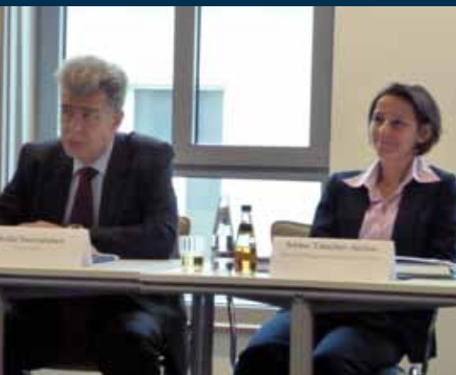
... Vorträge von einem finnischen Referenten und einer österreichischen Referentin ...