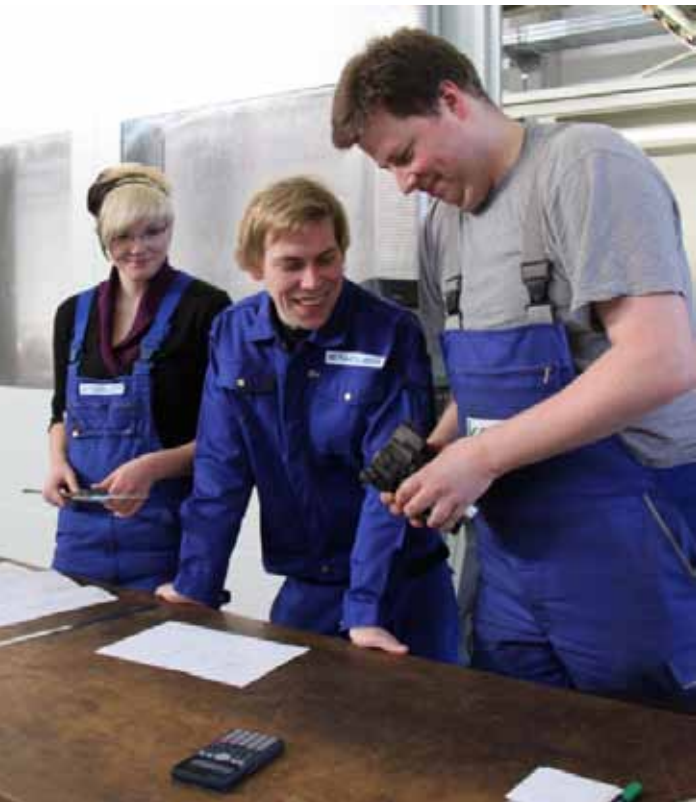
Berufsausbildung bei der KST Kraftwerks- und Spezialteile GmbH