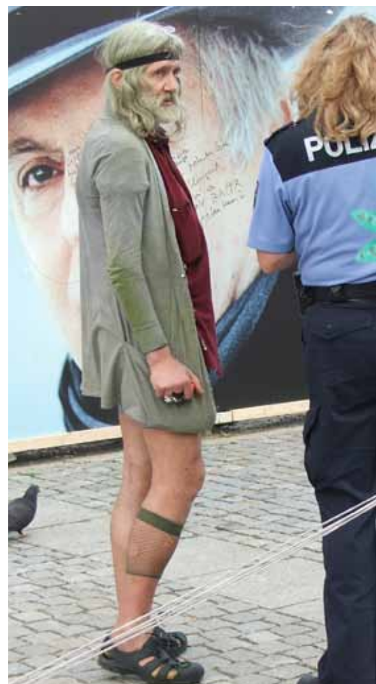
Armut verstößt gegen die Würde des Menschen

Zwischen Bekämpfung von Armut und sozialer Ausgrenzung und der Würde des Menschen