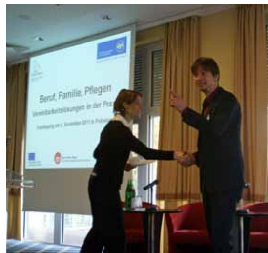
Szenen zur Vereinbarkeit führte das Unternehmenstheaters ‚SpielPlan‘ auf