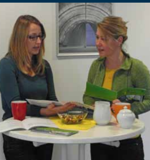
... und angeregte Pausengespräche