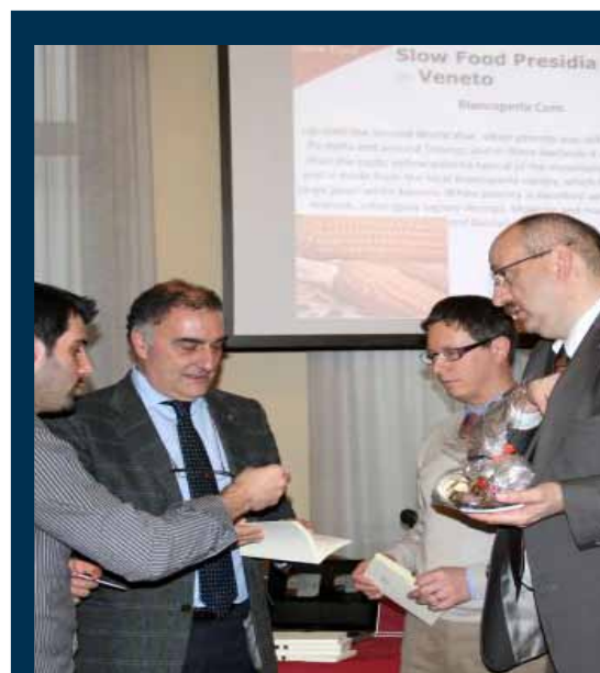
Impressionen von einem Treffen mit Slow Food in Vicenza, ...

Das Projekt wird aus Mitteln des ESF und des Landes gefördert.