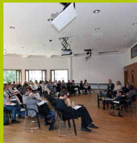
Podium mit Teilnehmerkreis in der Dialogrunde 4