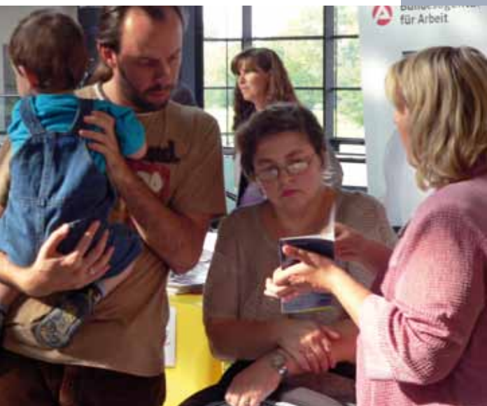
Den Auswirkungen der Wirtschaftskrise wirksam begegnen, erfordert Dialogbereitschaft im kleinen wie im großen Kreis

Für den sektoralen sozialen Dialog auf europäischer Ebene beschloss die Kommission in den späten 90er-Jahren die Einrichtung von Ausschüssen, die als zentrale Gremien zur Anhörung für gemeinsame Initiativen und Verhandlungen wirken. Die Vereinigungen der Sozialpartner können bei Erfüllung bestimmter Kriterien einen Antrag auf Teilnahme am Dialog auf europäischer Ebene stellen – unter Wahrung ihrer Autonomie. Bislang bestehen 40 Ausschüsse, deren Beschlüsse, Erklärungen und Vereinbarungen mehr als drei Viertel der europäischen Arbeitnehmer betreffen.