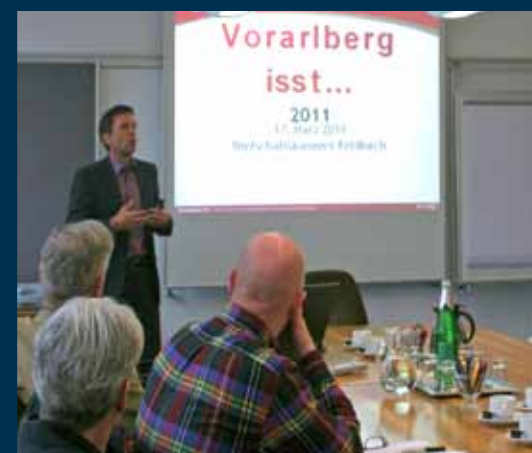
... bei der Wirtschaftskammer Vorarlberg und ...