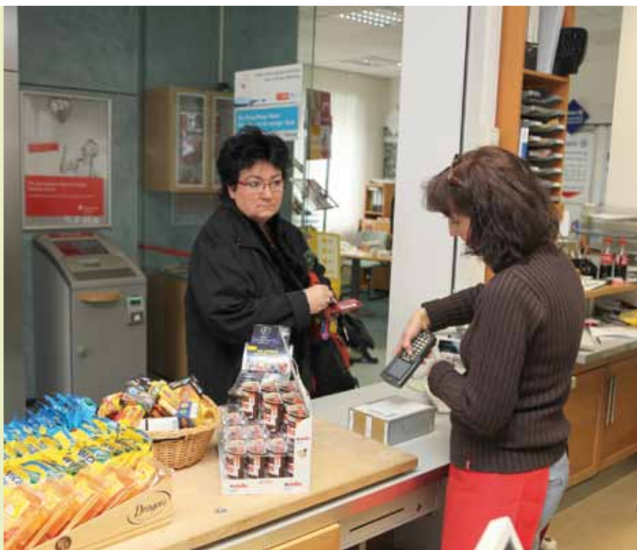
Ladentheke und Bankautomat – DORV-Läden finanzieren sich u. a. durch Kredite bzw. Anteilskäufe der Bewohnerinnen und Bewohner, durch bürgerschaftliches Engagement, Mieteinnahmen und Provisionen, etwa beim Medikamentenservice sowie durch Spenden