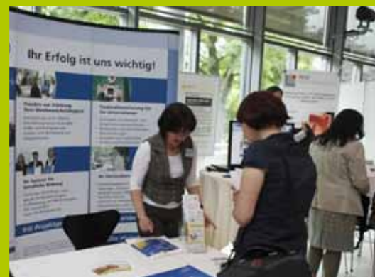
Der Marktplatz mit den Infoständen stieß auf reges Interesse unter den Teilnehmern