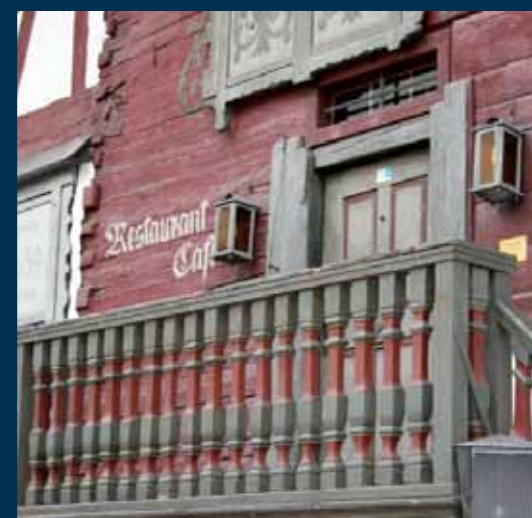
... von einem Besuch des Restaurants ‚Rotes Haus‘ in Dornbirn (Vorarlberg)