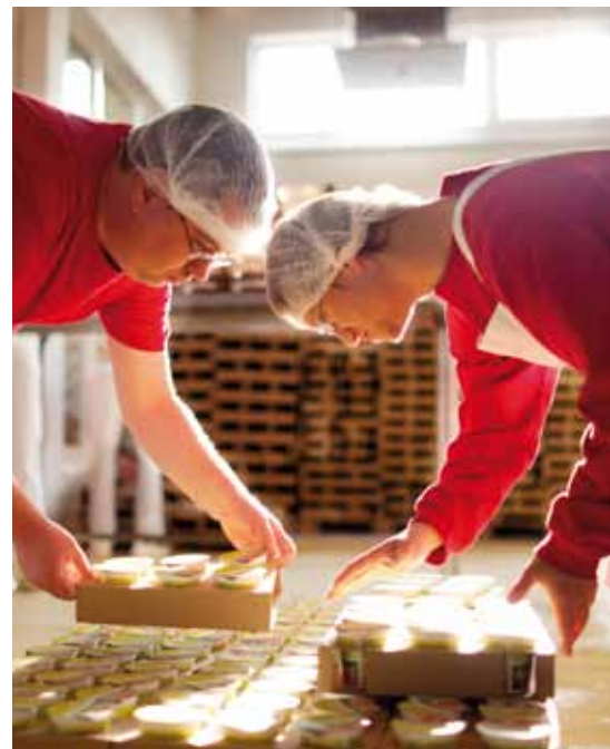
In der Biomolkerei in Biesenthal produzieren behinderte und nicht behinderte Menschen gemeinsam – unter anderem Joghurt, Sahne und Weichkäse – 2010 nahm die Molkerei den Betrieb auf