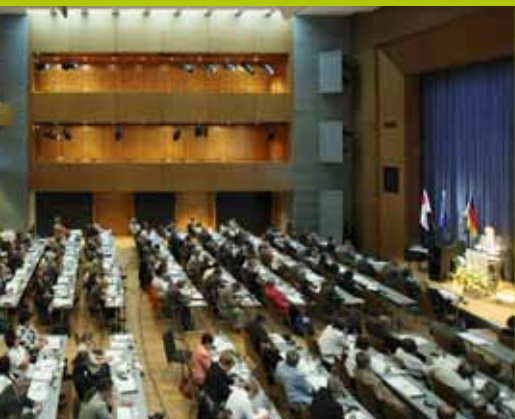
250 ESF-Akteure besuchten die Jahrestagung