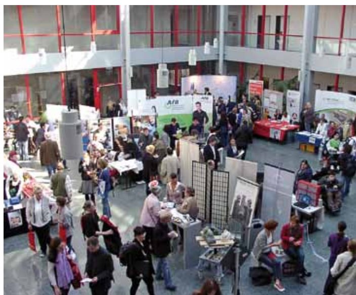
Der große Zuspruch der Veranstaltung ist deutlich – geschäftiges Treiben im historischen Rathaus in Köln

In NRW leben rund 2,3 Millionen Menschen mit Behinderung, davon sind mehr als 1,6 Millionen schwerbehindert. Die Bundesagentur für Arbeit meldete im Februar 2011 rund 46.600 schwerbehinderte Arbeitslose.