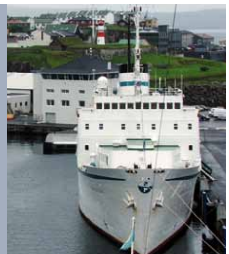
Der Mobilitätsmöglichkeiten gibt es viele: zu Land, zu Luft und zur See