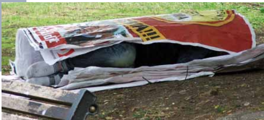
Die Spirale ins soziale Aus muss nicht erst bis ganz nach unten führen – Den Beweis lieferten viele Projekte im EU-Jahr 2010

Die soziale Innovation, die nach der EU-Leitinitiative ‚Innovationsunion‘ einen Schwerpunkt in der Strukturfondsförderung ab 2013 bilden sollte, hält der AdR für eine wichtige Möglichkeit zur Entwicklung neuer Lösungen. Er empfiehlt aber auch, ebenso den Austausch bewährter Vorgehensweisen sowie das