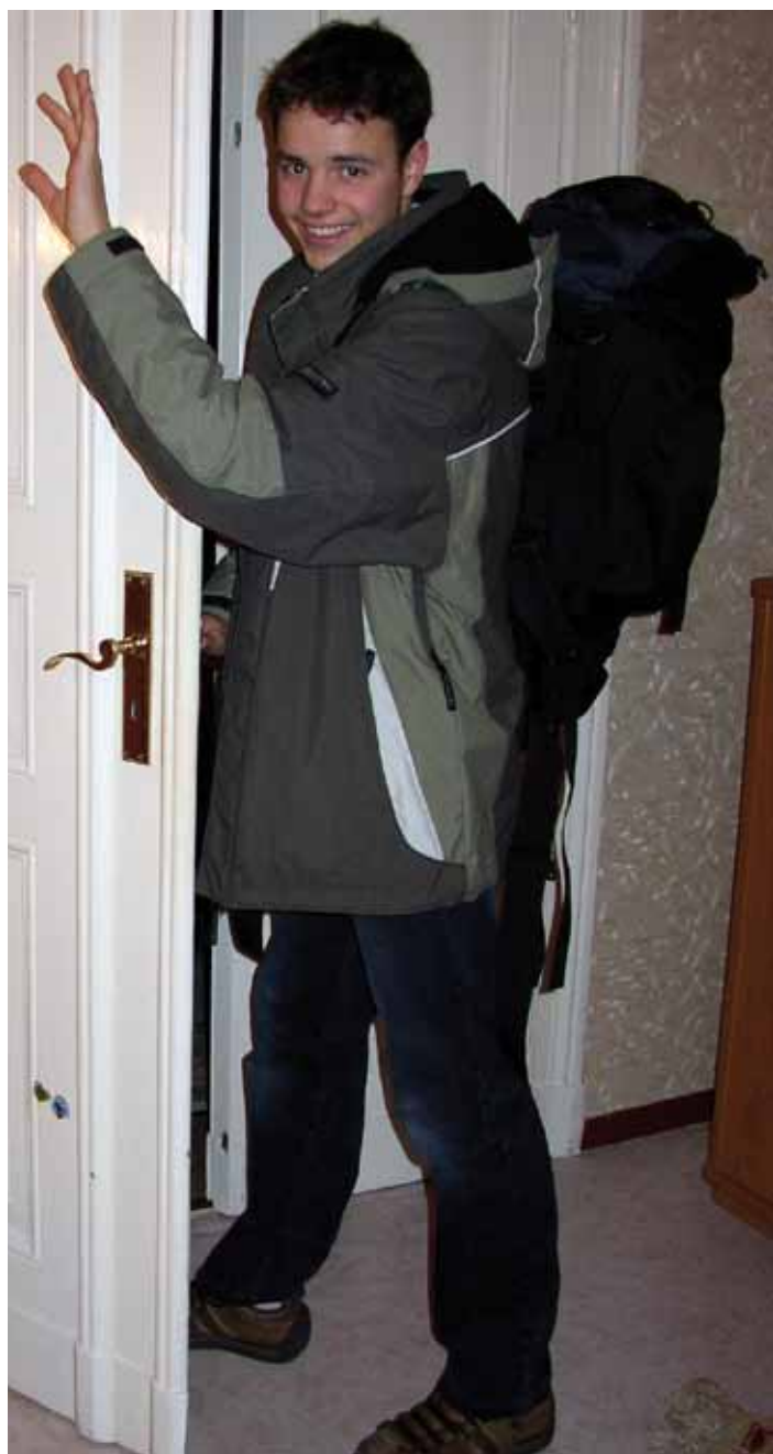
Und tschüss – auf zu neuen Horizonten

Ergänzend zu den Angeboten des EU-Programms LEONARDO DA VINCI, den Mobilitätsprogrammen und den Mobilitätsberatern des Bundes unterstützt das Arbeitspolitische Programm des Landes Brandenburg transnationale Ausbildungsbestandteile. Darüber hinaus bietet die Richtlinie zur Förderung des transnationalen Wissens- und Erfahrungsaustausches ebenfalls Möglichkeiten, sich dem