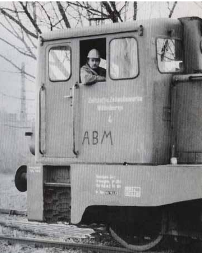
Arbeitsbeschaffungsmaßnahmen: eher bekannt unter ihrer Kurzform ABM – Vor 20 Jahren waren sie in Brandenburg das wichtigste Arbeitsförderungsinstrument – nun hat die Bundesregierung ihr Ende beschlossen

Brandenburger Landesverband der Arbeits-, Bildungs- und Strukturförderungsgesellschaften, Fabrikstr. 10, 16761 Hennigsdorf; Roman Zinter, Tel.: (0 33 02) 4 99 88 04 02, E-Mail: blv-ev@t-online.de