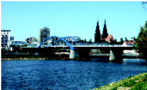
Brücke über die Oder in Richtung Frankfurt (Oder)

Die Brücke über die Oder verbindet die Bundesstraße 5 mit der polnischen Landesstraße 275 sowie die Städte Frankfurt (Oder) auf der deutschen und Slubice auf der polnischen Seite. Die gemeinsame Grenzabfertigungsanlage befindet sich direkt am westlichen Brückenkopf. Die Grenzbrücke erfüllt durch die exponierte Lage eine herausragende städte- und länderübergreifende Aufgabe zwischen der Bundesrepublik Deutschland und der Republik Polen.