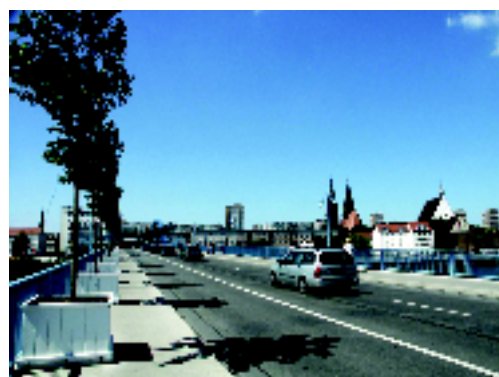
Junges Grün auf der Grenzbrücke weist den Weg zum Europagarten

Mit den Sommergärten werden gemeinsam mit dem „atelier le balto“ temporäre, künstlerische Erweiterungen und Ergänzungen zu den bleibenden, nachhaltigen Neugestaltungen der Kulissen des Europagartens im deutsch-polnischen Stadtraum geschaffen: Auseinandersetzungen mit nur vermeintlich außergewöhnlichen Orten und Stellen in Frankfurt (Oder) und Slubice, die die unterschiedlichen innerstädtischen Realitäten auf wiederum eigene Art und Weise widerspiegeln. Die Spaziergangskunst erforscht und verbindet mit den eigens durch das „atelier latent“ und der Europa-Universität Viadrina entwickelten Spazier- und Wander-Routen