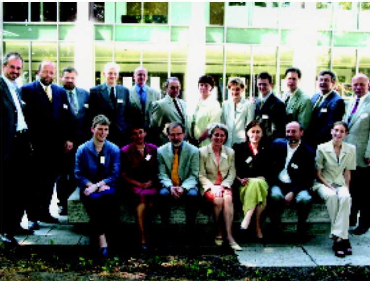
Die Gründungsbeauftragten des Deutsch-Polnischen Kooperationszentrums

Unterschiedlicher könnte die Situation kaum sein. Auf der einen Seite der Oder in Frankfurt (Oder) steht jede 6. Wohnung leer, auf der anderen Seite des Flusses in der polnischen Stadt Slubice fehlen zahlreiche Wohnungen. Dazwischen liegen nur wenige Kilometer und eine Brücke, auf der eine Grenze verläuft. Auf der einen Seite werden deshalb mehrere tausend Wohnungen abgerissen. Auf der anderen Seite werden dringend weitere Wohnungen benötigt, die zum einen durch Neubau, vor allem aber auch durch eine Sanierung des vorhandenen Wohnungsbestandes gewonnen werden müssten. Aber es fehlt an Geld.