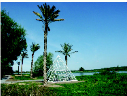
Sinnbild für NaturOderKultur: Der Oderstrand

Der grenzübergreifende Stadtraum bildet die Bühne, die Nutzung der unterschiedlichen Orte selbst ist eine Inszenierung, ein Ereignis. Das gemeinsame deutsch-polnische Stadtzentrum wird zu einem Kunstgarten auf der Grenze von zwei vermeintlich verschiedenen „Europas“. Insbesondere vor dem Hintergrund des bevorstehenden EU-Beitritts Polens in 2004 stellt somit Europagarten 2003,