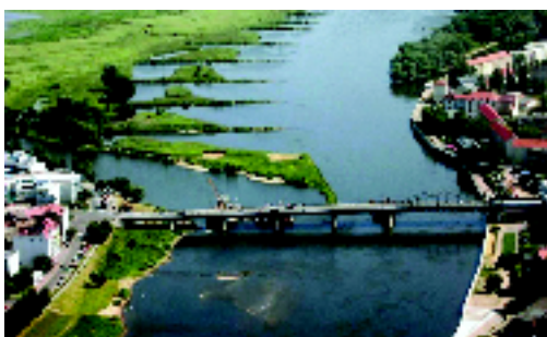
Die Grenzbrücke vor der Instandsetzung

Die Erneuerung erfolgte auf der Grundlage des Abkommens vom 20.03.1995 über die Erhaltung der Grenzbrücken im