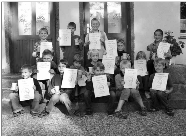
Stolz zeigen die Sieger und Platzierten ihre Urkunden und Geschenke – der zweite Schorfheide-Cup um den Wanderpokal der Bürgermeisters in der Schule in Groß Schönebeck wurde von 14 Kindern begehrt.