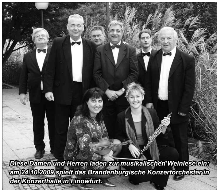
Diese Damen und Herren laden zur musikalischen Weinlese ein: am 24.10.2009 spielt das Brandenburgische Konzertorchester in der Konzerthalle in Finowfurt.