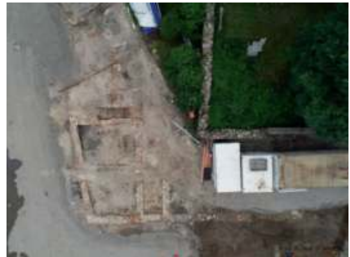
neuezeitlicher Hausgrundriß mit spätmittelalterlichen Grundriß

In der Schillerstr., an der Friedhofsmauer, wurden Gebäudereste gefunden. Es handelt sich um ein neuezeitliches Gebäude aus Ziegelsteinen.