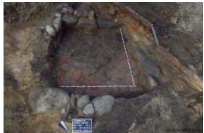
Fundamentreste eines mittelalterlichen Wirtschaftsgebäudes

Des Weiteren wurde in der Schillerstr., Höhe Nr. 66, Fundamentreste eines mittelalterlichen Wirtschaftsgebäudes gefunden. Bei diesem Gebäude konnte teilweise der Fußboden, bestehend aus Ziegeln im Klosterformat, freigelegt werden.