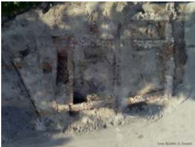
neuezeitlicher Hausgrundriß in der Schillerstr. / Ecke Friedhof