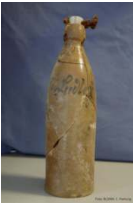
Wasserflasche aus dem 18. Jh. aus der Baugrube des neuzeitlichen Hausgrundrisses