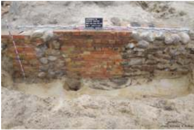
neuzeitlicher Hausgrundriß mit aus Feldsteinen zugemauerten Lichtschächten