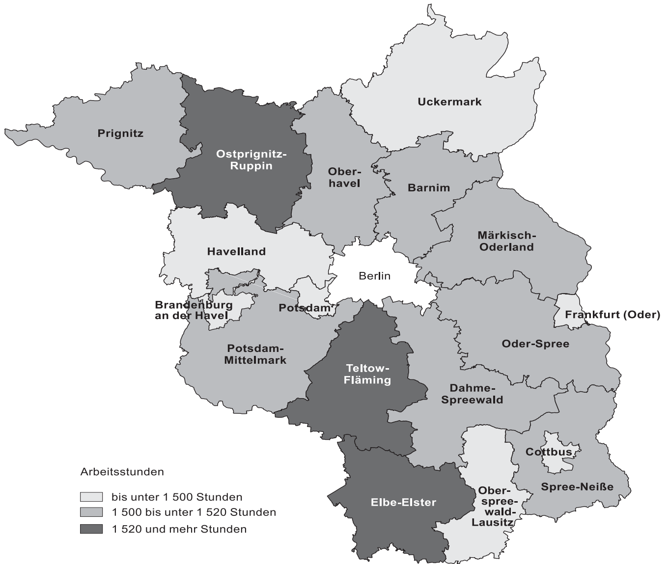
Geleistete Arbeitsstunden je Erwerbstätigen im Jahr 2007