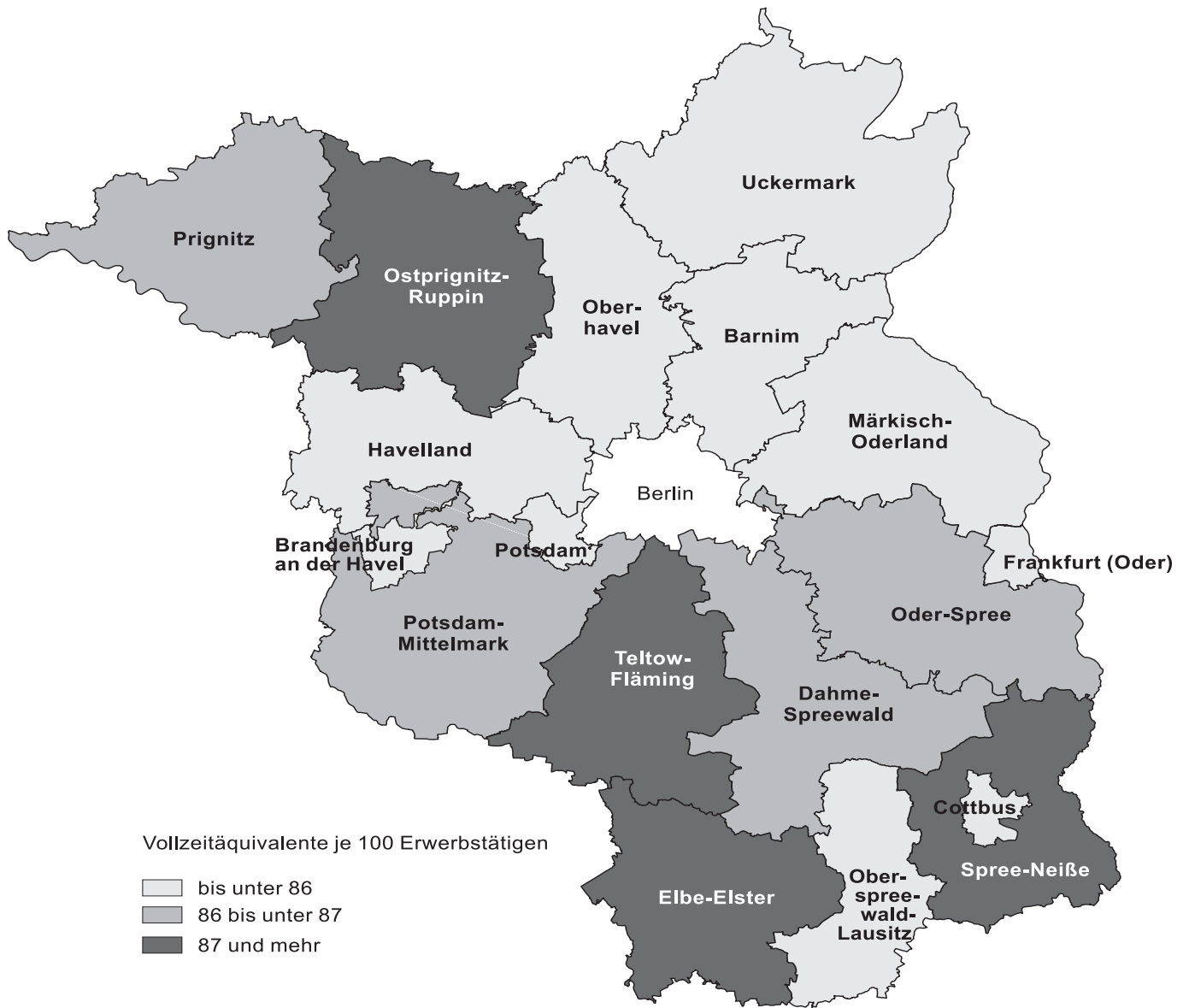
Vollzeitäquivalente je 100 Erwerbstätige im Jahr 2007