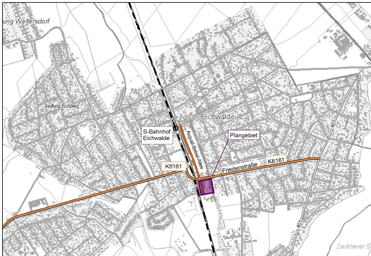
Abb.1: Übersichtsplan zur Lage des Plangebietes in der Gemeinde

Der Satzungsbeschluss wird hiermit gemäß § 10 Abs. 3 BauGB bekannt gemacht. Mit der Bekanntmachung tritt die Satzung in Kraft.