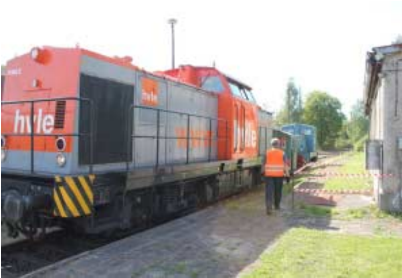
Rangierarbeiten im Bahnhof Ketzin