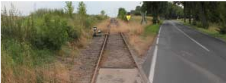
Unsere Gleissperre in Vorketzin am Bahnübergang