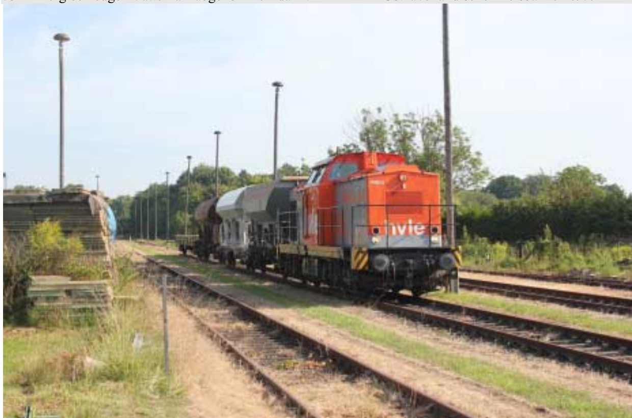
Ankunft des Sondergüterzuges im Bahnhof Ketzin zum Fischerfest

Der Vorstand ARBEITSGEMEINSCHAFT Osthavelländische Kreisbahnen e.V.