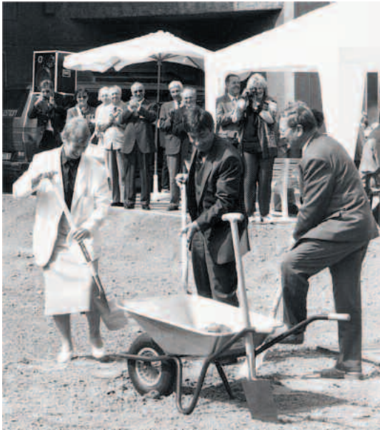
Spatenstich für den Neubau des Kreiskrankenhauses Belzig, von links Sozialministerin Regine Hildebrandt, Sozialdezernent Günter Baaske, Landrat Lothar Koch

Im April 1996 wurden dem Kreistag zwei Varianten für ein Kreiswappen zur Beschlussfassung vorgelegt. Großen Anteil an der Erarbeitung des Wappens hatte Dr. Rudolf Heckel. Die Genehmigung für das vom Kreistag vorgeschlagene Wappen erteilte das Ministerium des Innern des Landes Brandenburg dann im Oktober 1996. Vier Jahre später – genau im Dezember 2000 – folgte die Flagge des Landkreises, die der Kreistag im Oktober 2000 beschlossen hatte.