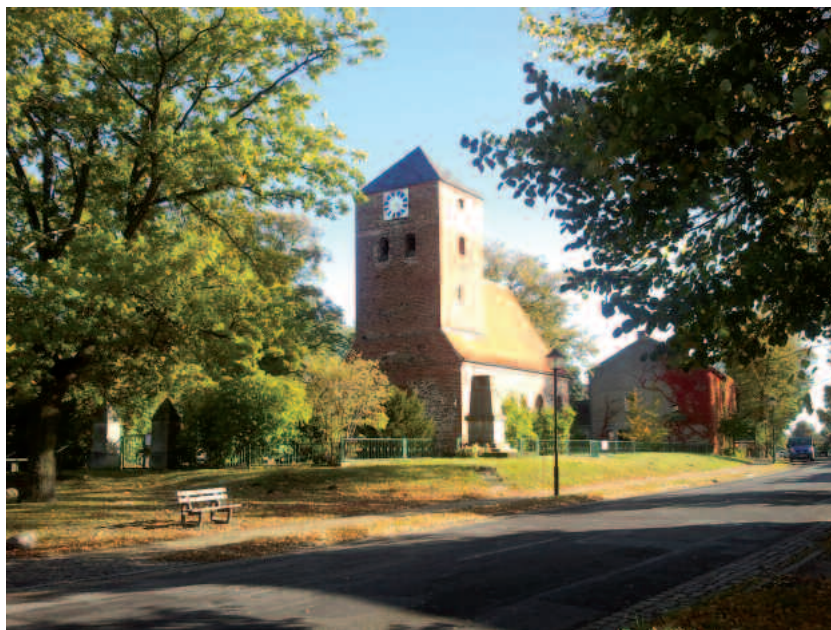
Kirche von Radewege 2012

Helfen Sie durch Ihre Spende mit, dem anspruchsvollen Ziel der Wiedererrichtung der Schweifhaube ein Stück näher zu kommen. Spendenkonto: Kirchdach e.V. Radewege, Mittelbrandenburgische Sparkasse: BIC: WELADED1PMB IBAN: DE58 1605 0000 3601 017520