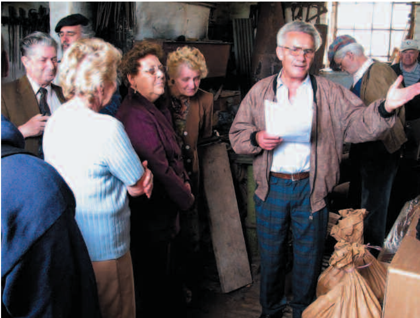
Rundtour der Chronisten zu alten Schmiedegebäuden, hier in Haseloff