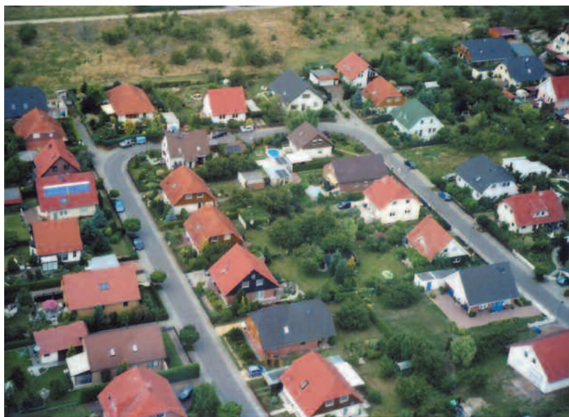
Schenkenberg heute, ein begehrtes Wohndorf mit Kirschbergsiedlung, nach der Wende auf gerodeten Obstbauflächen errichtet