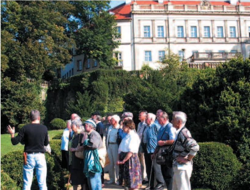
Chronisten im Park Wiesenburg