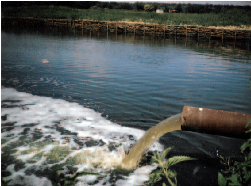
Langsam füllt sich das Absatzbecken des Ablasschiebers 28, im Hintergrund das Rieselwärterhäuschen am Schlossberg Anfang der 90er Jahre, Foto: Erhard Nickel, Schenkenhorst