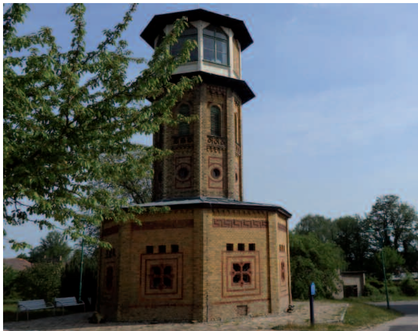
Turm des Glindower Ziegeleimuseums

Tip: Ziegeleimuseum Glindow im Aufseherturm von 1890 mit Führung durch die produzierende historische Manufaktur