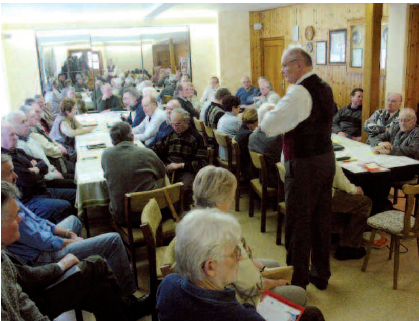
Chronistentreffen in Pritzerbe