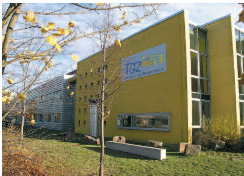
Kreiseigenes Technologie- und Gründerzentrum TGZ Fläming in Bad Belzig

kosten waren mit circa 11 Millionen Mark bei einer Förderung von 90 Prozent durch die EU, den Bund und das Land Brandenburg veranschlagt. Im August 1998 war die Technologie- und Gründerzentrum Fläming GmbH bezugsfertig. Im Jahr 2014 wurden bereits erste Weichen für eine Fusion des TGZ Fläming mit dem TZT in Teltow gestellt. Der Landkreis erwarb von den Mitgesellshaftern alle Anteile und übernahm somit das TGZ Fläming in Bad Belzig komplett. Mit dem Jahreswechsel 2017/2018 werden sich beide Einrichtungen zusammenschließen mit dem Ziel Synergien zu erzeugen und eine breitere Aufstellung der gemeinsamen Gesellschaft in beiden Teilräumen des Landkreises zu ermöglichen.