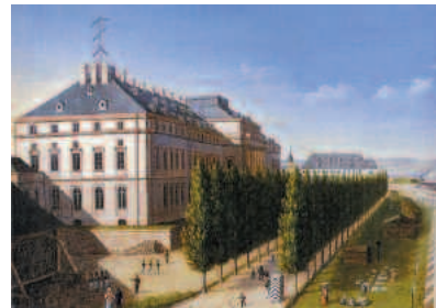
Station 60/61, die Endstation der Telegrafenlinie: Kurfürstliches Schloss in Koblenz