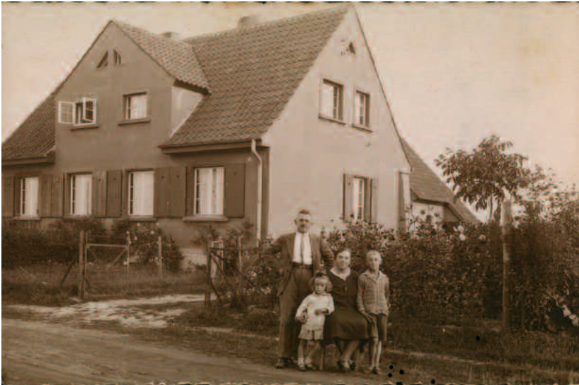
Siedlerhaus in der Kastanienallee mit Satteldach um 1930