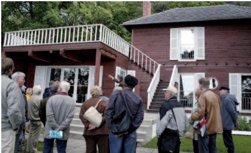
Chronisten am Einsteinhaus in Caputh

Die Dauerausstellung „Einsteins Sommer-Idyll in Caputh“ wird gezeigt im Bürgerhaus Caputh in der Straße der Einheit 3