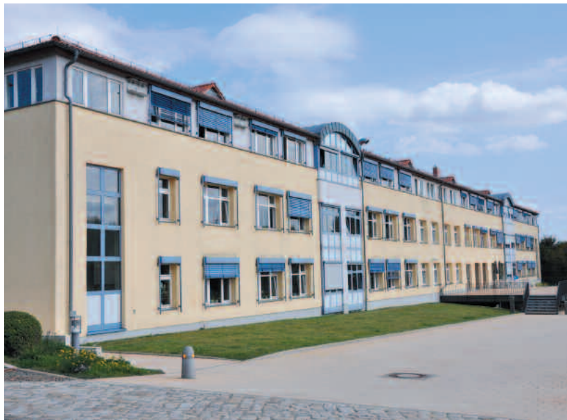
Kreisverwaltungsgebäude Papendorfer Weg in Bad Belzig

Seit Ende der 90er Jahre gab es immer wieder große Probleme mit der Unterbringung der Belegschaft des Landkreises. Die Dezentralisierung einer Verwaltung ist sicherlich in puncto Bürgerfreundlichkeit vorteilhaft, aber in der Leitungstätigkeit von Fachämtern problematisch. Deshalb wurde seit Jahren versucht, ein verträgliches Konzept für die konzentrierte Unterbringung der Verwaltung in Belzig vorzulegen. Doch in dieser Frage gab es stets heftige Kritik durch die Opposition. Hinzu kam, dass die Bauzustandsanalyse des Hauses III der Kreisverwaltung in Belzig zum Abriss des Gebäudes riet. Mit dem Neubau eines Verwaltungstraktes im Papendorfer Weg in Belzig – Richtfest wurde im August 2000 gefeiert – entspannte sich die Lage etwas. Auch das Kreisarchiv konnte mit dem Neubau technisch gut ausgestattete Räume im Keller des Hauses beziehen und von Brandenburg nach Belzig verlegt werden. Zudem wurde das Backsteingebäude am Papendorfer Weg für Verwaltungsarbeit nutzbar gemacht. In den Folgejahren nahmen die Umzüge jedoch kein Ende. Die Gebäude in der Puschkinstraße, Steinstraße, Ernst-Thälmann-Straße und im Weitzgrunder Weg