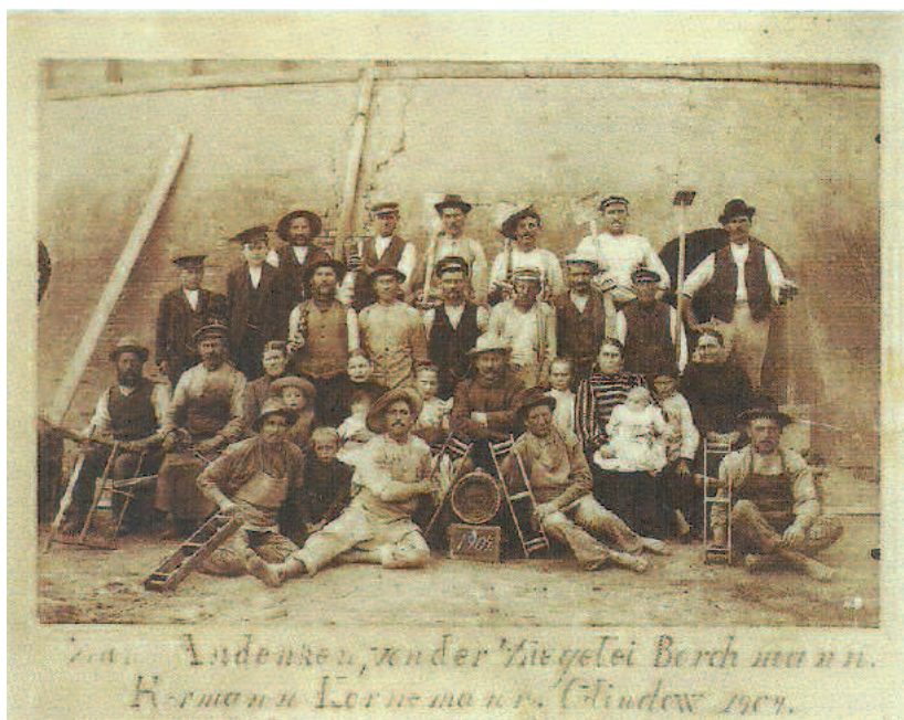
Belegschaft der Ziegelei Borchmann