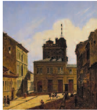
Berlin-Mitte - „Alte Sternwarte“ Dorotheenstraße mit Sitz der Tele- graphenexpedition, heute Staats- bibliothek

Station 9 – Steinberg bei Zitz – Informationstafel