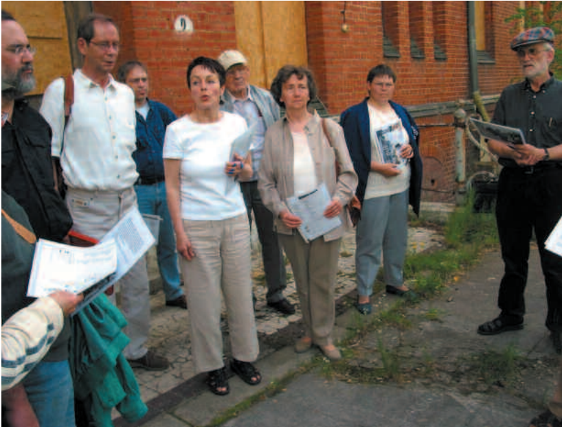
Vortrag in Beelitz-Heilstätten