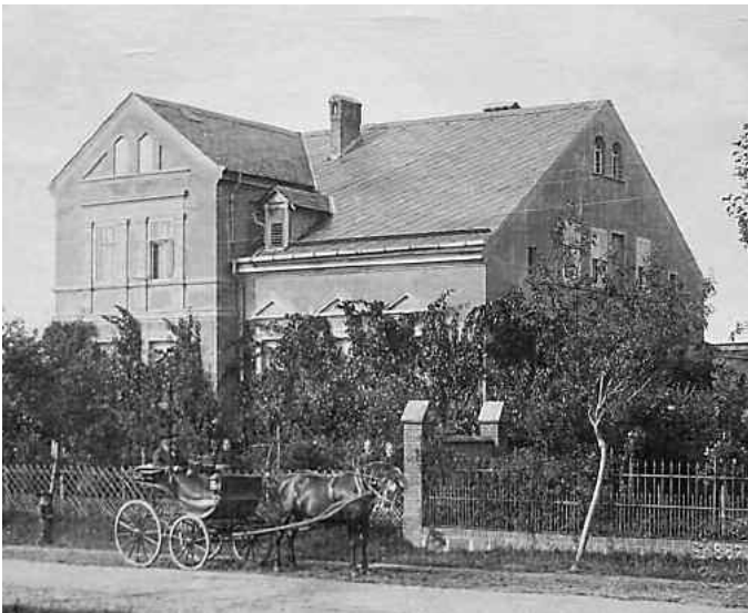
Das Foto stammt aus dem Quitzw- Archiv.