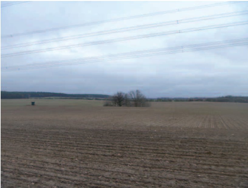
Blick vom Posch-Fenn in Richtung Stücken auf die Feuchtstelle inmitten der Felder

Mühsam war der sonntägliche Weg der Schiäßer und Trensdorfer durch Sumpf und Sand, vorbei an Poschfenn und Renngrund, nach Stücken. Nach dem Gottesdienst kam eine Erfrischung im Alten Sandkrug unweit des Stückener Weinberges gerade recht. Auch die Fresdorfer kamen hier vorbei. Bei Bier und Wein ging es oft lustig zu bis in den Abend. Einige besonders Durstige kehrten in der Folge schon auf dem Hinweg im Krug ein. Der Wirt wehrte es ihnen nicht; er hatte seinen Vorteil. Durch Gerstensaft mutig geworden, verhöhnten die Gottlosen die auf dem Rückweg einkehrenden oder vorbeieilenden Kirchgänger.