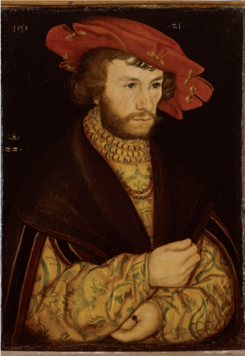
Jugendbildnis Caspar von Köckritz von 1521, Lucas Cranach d.Ä., Original im Staatlichen Museum Schwerin, Repro Fechner