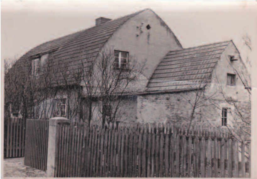
Holzsparendes Bohlendach der Siedlerdoppelhaushälften von 1928, um 1800 vom königlich-preußischen geheimen Ober-Bau-Rath David Gilly erfunden, mit kleiner Gaube und Stallanbau