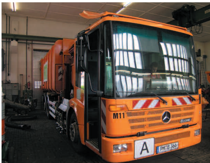
Entsorgungsfahrzeug des kreiseigenen Abfallwirtschaftsbetriebes APM, Foto: aus der Mediathek im Kreisarchiv

Nicht nur Ämter, Personal und Dienststellen erfuhren eine Zusammenlegung, auch Gebühren, Verordnungen und Satzungen mussten dem neuen Landkreis und seinen Strukturen angepasst werden. So trat mit dem Start ins Jahr 1995 erstmals eine einheitliche Abfallgebühren- und Entsorgungssatzung in Potsdam-Mittelmark in Kraft. Und auch die Mitarbeiter des Betriebes für Abfallwirtschaft zogen Ende März 1995 in das neue Verwaltungsgebäude auf den gemeinsamen Betriebshof der Abfallwirtschaft,