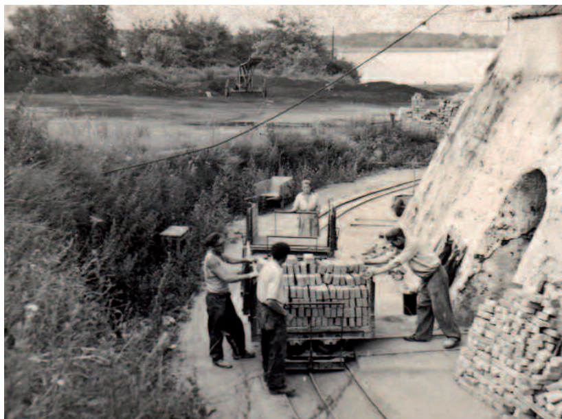
Arbeiter am Ringofen