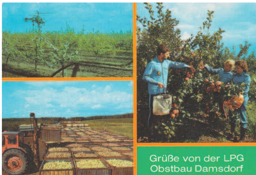
Obstbau Damsdorf mit Obstlagerplatz in Schenkenberg auf der Postkarte