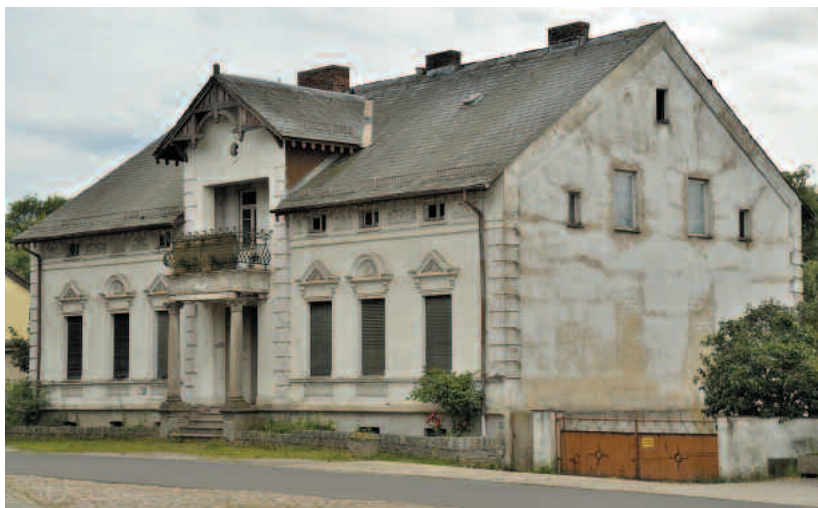
Das Petschsche Wohnhaus