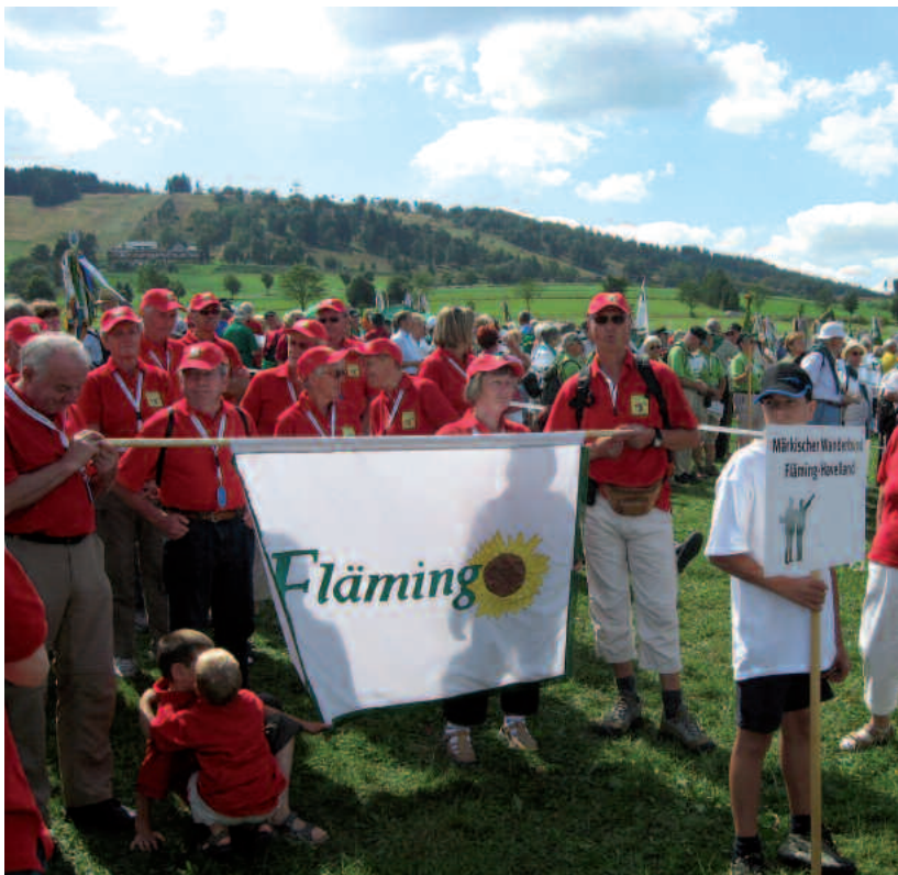
Deutscher Wandertag in Willingen 2009

„Wandern auf Luthers Spuren“ war das Motto des Deutschen Wandertages 2017 in Eisenach und am Rennsteig. Dem Deutschen Wanderverband gehören etwa 600 000 Wanderer in 58 Mitgliedsorganisationen an. Zu ihnen gehört auch der am 28. März 2007 gegründete „Märkische Wanderbund“, der 2009 in Willingen erstmals an einem Deutschen Wandertag teilnahm. Über 40 märkische Wanderer reisten damals per Bus in die sauerländische Kleinstadt mit der berühmten Skisprungschanze. Mit ihrem geschlossenen Auftreten in den roten Wanderhemden mit Brandenburg-Adler erregten sie sofort Aufmerksamkeit und Neugier bei den Mitwandernden und den Zuschauern.