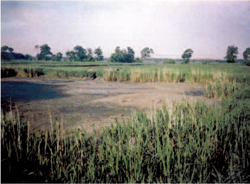
Absatzbecken vor der Entschlammung