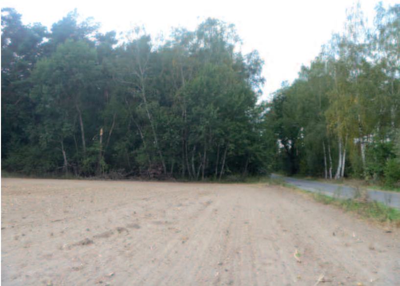
Straße von Tremsdorf nach Fresdorf

Als im 12. Jahrhundert deutsche Einwanderer über die Elbe in das dünn besiedelte Wendenland kamen, hatten die Dörfer Wildenbruch und Fresdorf eine besondere Aufgabe: Sie hatten die alte Heerstraße von Treuenbrietzen über Beelitz nach Saarmund zu sichern. Beide Dörfer waren mit mehr Hufen ausgestattet als die umliegenden Orte und schützten von ihren Wehrkirchen aus die Landenge zwischen dem Großen und dem Kleinen Seddiner See. Im weiteren Verlauf konnte zumindest Fresdorf diese besondere Stellung nicht behaupten. Stücken, abseits der wichtigen Straße,