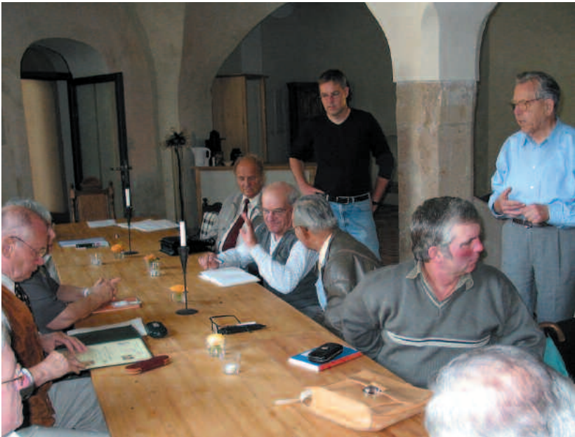
Chronisten im Rittersaal im Schloss Wiesenburg