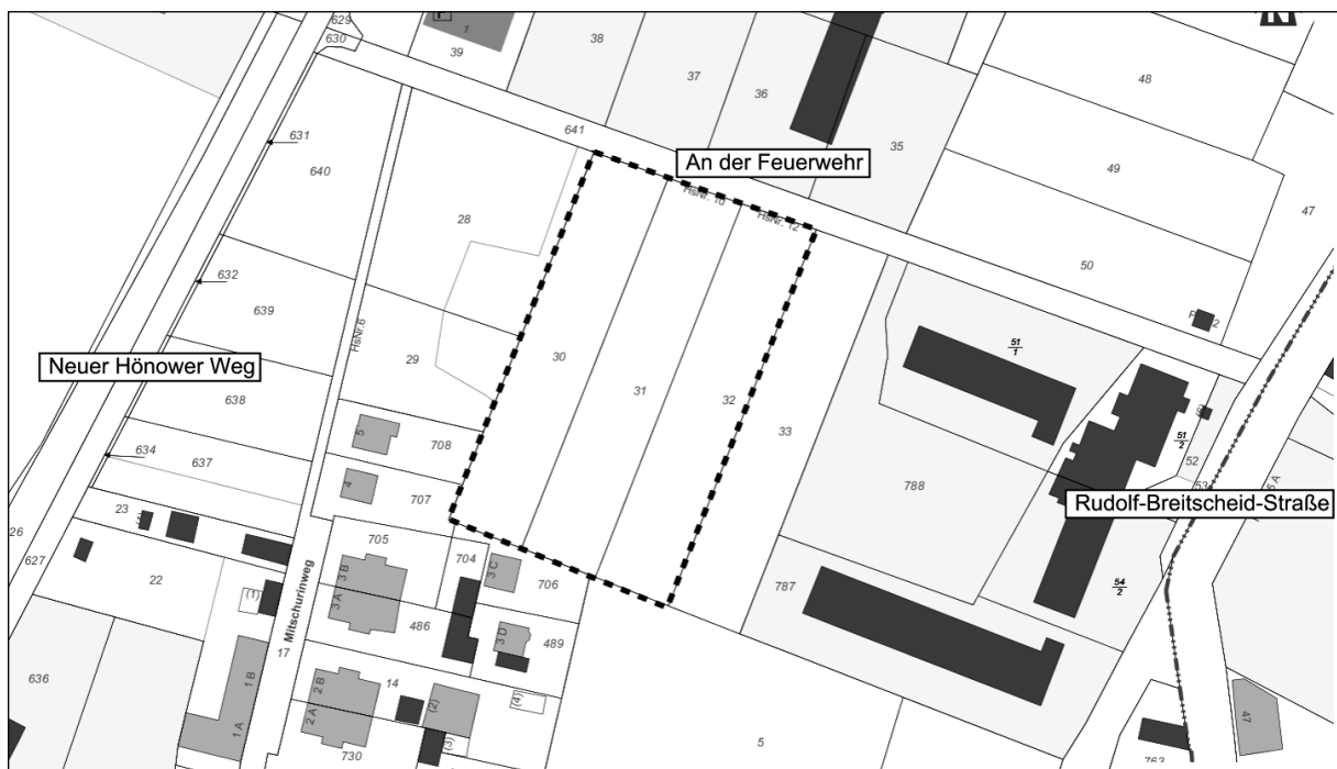
Geltungsbereich des vorhabenbezogenen Bebauungsplans „An der Feuerwehr“ mit einbezogenem Grundstück (Strichlinie / Stand: April 2014)

Der rund 0,77 ha umfassende Geltungsbereich des Bebauungsplans befindet sich im Ortsteil Dahlwitz-Hoppegarten, an der Straße An der Feuerwehr . Der Geltungsbereich umfasst in der Flur 4 der Gemarkung Dahlwitz-Hoppegarten die Flurstücke 30, 31 und 32. Eine Übersicht des Geltungsbereiches des Bebauungsplanes ist dem folgendem Kartenausschnitt zu entnehmen.