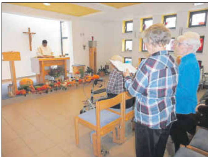
Mit einem Gottesdienst feierte man im St.-Marien-Stift Erntedank.

Am 1. Oktober feierten wir traditionell unseren Erntedankgottesdienst. Der Altar wurde mit den verschiedensten Naturalien geschmückt. Darunter waren unter anderem selbst Einkochtes oder Ernte aus dem eigenen Garten, frisch gebackenes Brot, Kräuter, Kürbisse, Blumen und vieles mehr. Gerade in dieser Zeit besinnen wir uns, dass wir in Frieden leben, satt werden und ein Obdach haben. In unse-