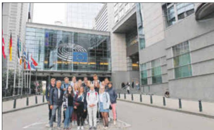
Die Teilnehmer der Exkursion in Brüssel.