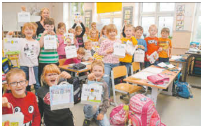
Die Erstklässler freuten sich sichtlich über die Lesetüten, die ihnen die Kinder aus den zweiten Klassen überreichten.