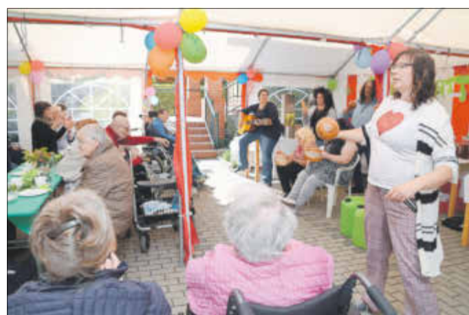
Bewohner der Wohnstätte hatten zur Jubiläumsfeier ein kleines unterhaltsames Playback-Programm einstudiert.

der Wohnstätte, Tagesstätte sowie im ambulant betreuten Einzelwohnen, für psychisch erkrankte Menschen. Sie sind Heilerziehungspfleger, Heilpädagogen, Sozialpädagogen und Ergotherapeuten, die für die Aufgaben in den Einrichtungen ausgebildet sind. Es sind gefragte Fachkräfte, nach denen auch die Tätige Gemeinschaft regelmäßig Ausschau hält.