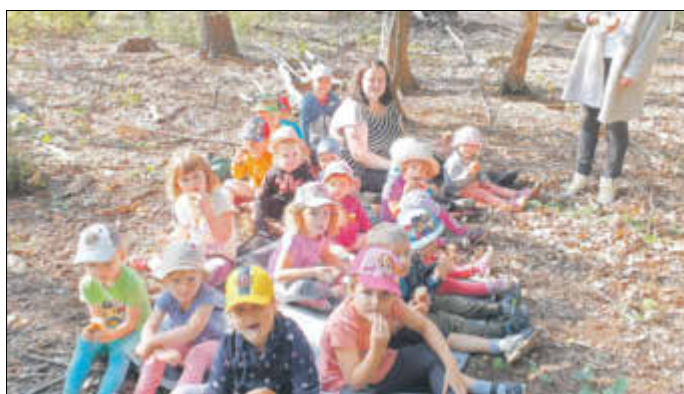
Stärkung nach aufregenden Stunden in der Natur.

leckerem Frühstücksproviant bestückten Rucksäcke und los ging es die Mühlberger Straße hoch und dann rechts, immer den Traktoren nach. Das fanden alle mächtig aufregend! Auf halber Strecke breiteten wir unsere mitgebrachten Decken aus und aßen unser Frühstück an der frischen Luft – das schmeckt dann gleich doppelt so gut!