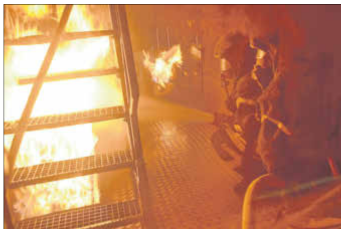
Hitze und Flammen in einer unübersichtlichen Situation verlangten den Kameraden in der Heißausbildung viel ab.

Jährlich ein Einsatz unter realistischen Bedingungen ist für Kameraden, die Atemschutzträger sind, laut Dienstvorschrift vorgesehen. Dabei ist es gleich, ob dies im Echt-Einsatz oder als Übung erfolgt. „Wir wissen nicht,