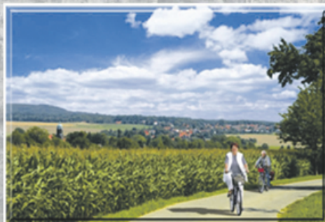
Blick auf Lohmen

Touristinformation Lohmen Schloß Lohmen 1 01847 Lohmen Tel 03501 / 5810-24 Fax 03501 / 5810-42 touristinformation@lohmen-sachsen.de www.lohmen-sachsen.de