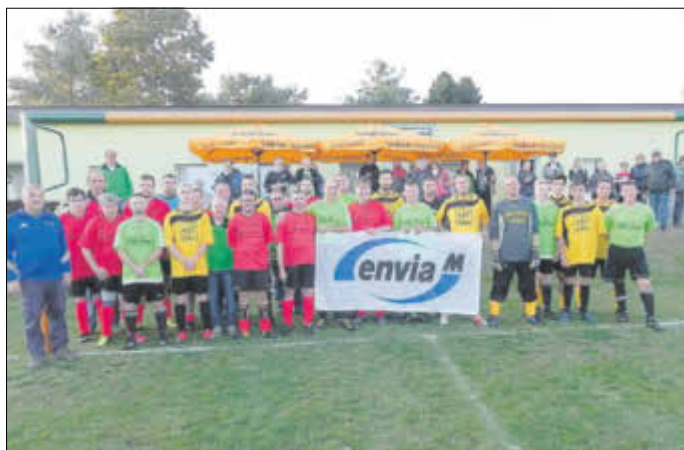
Teilnehmer des Turniers mit dem Sponsoren-Banner.

Jedes Jahr führt „Wacker“ Zobersdorf ein Fußballturnier durch, in dem verschiedene Mannschaften ihre Kräfte messen. Auch in diesem Jahr nahmen Sportler der Elsterwerkstätten Herzberg wie auch der Firma Theile daran teil. Damit auch behinderte Menschen ihren Lieblingssport ausüben können, ist es wichtig, dass Fußballvereine wie Wacker ihre Strukturen für Menschen mit Handicap öffnen. Es war ein faires Turnier. Alle spielten mit Begeisterung, besonders sah man die große Freude den Spielern der Elsterwerkstätten an, die