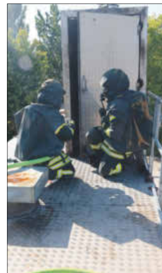
Einstieg eines Löschtrupps in den Brandcontainer.

rät sowie dem richtigen Verhalten im Einsatzszenario vertraut machten, bevor es mit dem Einstieg in den Container ernst wurde. Den Abschluss bildete eine Auswertung der Einsatzübung jedes einzelnen Trupps.