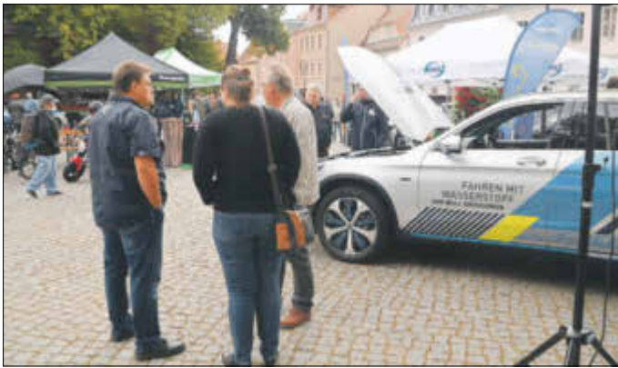
Auf dem Marktplatz konnten verschiedene Fahrzeuge mit alternativen Antriebs-technologien angeschaut und teils auch ausprobiert werden.

Ist die Mobilität in Elbe-Elster bereits elektrisiert? Keineswegs und sie bewegt sich mit rund 100 Elektromobilen nur einen sehr kleinen Schritt in Richtung auf eine zukunftsfähige, klimagerechte Mobilität. Dies nahm der Landkreis zum Anlass, um mit einem weiteren Aktionstag am 18. September Elektromobilität auf dem Bad Liebenwerdaer Marktplatz in der Praxis mit 28 Ausstellern und in der Theorie mit neun Fachvorträgen Antworten rund um das Thema Elektro-, Wasserstoff- und nachhaltige Mobilität vorzustellen. Ob elektrisch oder mit Wasserstoff, alternative Antriebsmöglichkeiten gibt es nicht nur für PKW. So präsentierten verschiedene Aussteller sich mit den neuesten An-