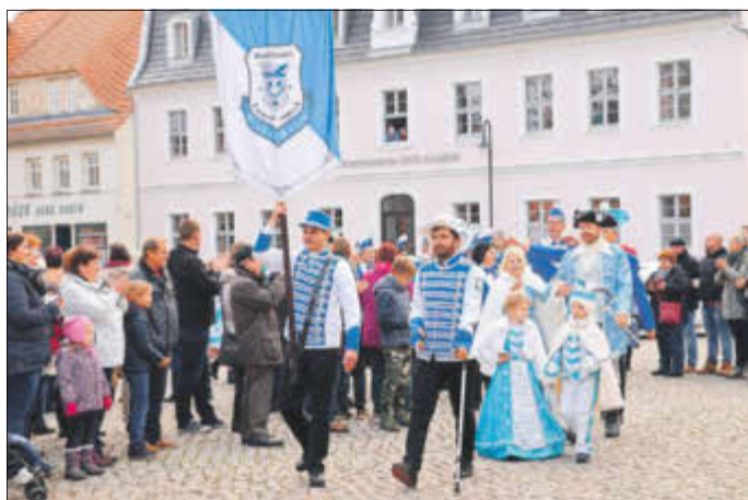
Am 11.11. ziehen wieder die Winklischen Narren in Bad Liebenwerda ein.