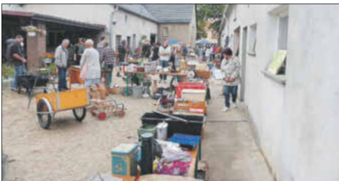
Auf vielen Grundstücken wurde allerlei Trödel zum Kauf angeboten.

Nach dem großen Erfolg vor zwei Jahren wurde in Zobersdorf wieder getrödel. Trödel, Schmuck, Kunsthandwerk und vieles andere, was das Sammlerherz begehrt, waren zu erhalten. Wer wollte, konnte auch einfach nur über die schöne Straße, um mit anderen Besuchern oder Verkäufern ein Schwätzchen zu halten. Früher war dies in den Geschäften im Dorf gängige Praxis, heute ist der Plausch leider durch die reduzierten Anlaufstellen stark