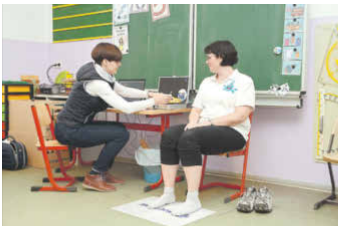
Das Sanitätshaus Bauch bot Venenmessungen an.

Balance Check heißt ein Verfahren, mit dessen Hilfe die Herzratenvariabilität (HRV) bestimmt wird. Die HRV, also die Schwankung der Herzfrequenz während und durch die Atembewegung, gibt Aufschluss darüber, wie das Herz es schafft, mit Stresssituationen umzugehen. Das Ergebnis macht auf die eventuelle Notwendigkeit aufmerksam, die eigene Regulationsfähigkeit durch Training oder Änderungen des Lebensstils wieder zu verbessern: Gewichtsreduzierung, Aufgeben des Rauchens, Verminderung der Stressbelastung und sportliche Betätigung. Die Messung und eine anschließende Beratung zu den Ergebnissen wurden beim Gesundheitstag der Stadtverwaltung am 8. März im Grundschulzentrum angeboten. Zum gesamten Angebot des Tages gehörte indes noch weitaus mehr. Das Epikur Bad Liebenwerda, die Unfallkasse Brandenburg, die Barmer, der Kneipp-Verein