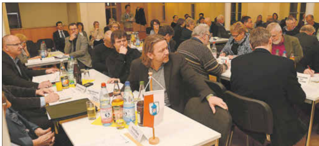
In Mühlberg kamen die Hauptausschüsse der vier Städte zusammen, um die vorbereitenden Beschlüsse für die Bildung einer Verbandsgemeinde zu verabschieden.