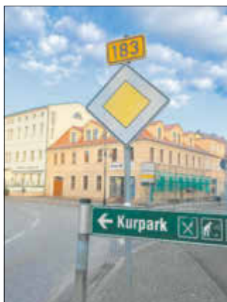
Auch diesem Bild zufolge führt die B183 noch durch die Innenstadt. Das soll sich ändern.

Trotz der neuen Umgehungsstraße sucht sich ein Teil des Durchgangsverkehrs noch immer den Weg durch die Innenstadt von Bad Liebenwerda. Dies liegt aus Sicht vieler nicht zuletzt an der unzureichenden Beschilderung, die insbesondere an der Kreuzung in Richtung Oschätzchen dem aus Sachsen kommenden Verkehr keinen Hinweis auf den Weg zur B101 gibt. Nach Gesprächen mit dem Straßenverkehrsamt des Landkreises Elbe-Elster, die die Stadtverwaltung führte, soll sich daran nun etwas ändern. Vorgeesehen ist, sowohl an der Kreuzung Richtung Oschätzchen als auch an