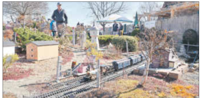
Am zweiten Aprilwochenende startet das Elster-Natourem wieder in die Saison.

modellen verschiedener Hersteller, Antriebe und Modellbahnstile bewundert werden. Der Eintritt kostet für Erwachsene 4,50 EUR, für Kinder bis 14 Jahre 3,00 EUR. Kinder bis drei Jahre haben freien Eintritt. Inhaber der Kur- oder Gästekarte erhalten Ermäßigungen auf den Eintrittspreis. Kontakt: Frank Höppner, Tel.: 035341 49736, Fax: 035341 49738, elsternatourem@bad-liebenwerda.de