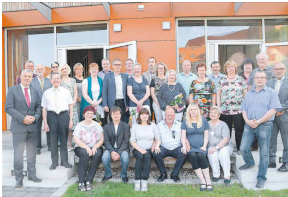
Im Jahr 2017 ausgezeichnete Ehrenamtliche: In diesem Jahr soll es wieder eine Ehrung für die Aktiven geben.

Anlässlich des diesjährigen Stadtfestes am Wochenende des 25./26. Mai soll es wieder eine Veranstaltung zur Würdigung des Ehrenamtes geben. Diese soll am Vorabend des Stadtfestes (Freitag, 24. Mai) stattfinden. Vereine und Gruppen ehrenamtlich Tätiger sind aufgerufen, Vorschläge zur Ehrung besonders aktiver Mitstreiter zu machen, die uneigennützig helfen und da sind, wenn man sie braucht. Es wird gebeten, die Vorschläge mit einer kurzen Begründung zu versehen, die sich in der Laudatio wiederfinden soll. Vorschläge können bis spätestens 30. April an Bärbel Ziehlke gesandt werden, gern auch per E-Mail (baerbel.ziehlke@badliebenwerda.de).