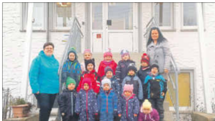
Kinder und Erzieherinnen der Evangelischen Kita „Gänseblümchen“.

Als nunmehr Evangelische Kindertagesstätte steht die Kita „Gänseblümchen“ im Ortsteil Kröbeln seit 1. Januar dieses Jahres in Trägerschaft der Ev. Bildung und Erziehung Niederlausitz gGmbH (Diakonisches Werk Elbe-Elster). Grundlage dafür war ein Beschluss, den die Stadtverordnetenversammlung der Stadt Bad Liebenwerda im November des vergangenen Jahres getroffen hat.