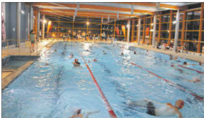
Auch nachts herrscht beim 24-Stunden-Schwimmen reger Betrieb auf den Bahnen.

Insgesamt 199 Schwimmer waren am Start, insgesamt legten sie 1702,58 Kilometer zurück: Beim 24-Stunden-Schwimmen, das noch im Januar in der Lausitztherme Wonnemar stattfand, kam wieder einiges an Strecke zusammen. 19 Einzelstarter und 14 Mannschaften mit zwischen sieben und 24 Mitgliedern beteiligten sich an dem Sportereignis, unter ihnen auch wieder Schwimmer des SV Neptun aus der Partnerstadt Lübecke.