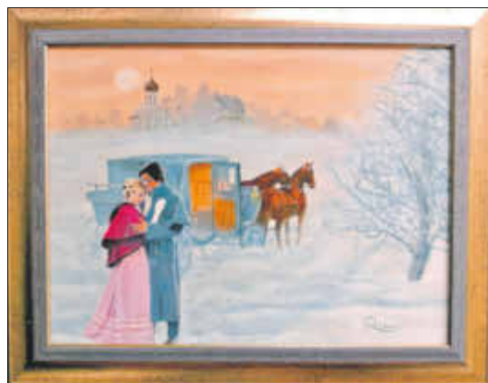
„Romanze in der Taiga“ ist der Titel dieses Ölgemäldes.