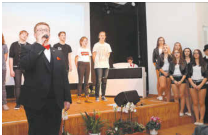
Mit Musik, Gesang und Tanz brachten die Oberschüler ein gelungenes Programm auf die Bühne.