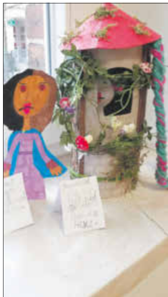
Von Zweitklässlern gestaltete Märchenkasten werden in der Bibliothek ausgestellt.

Dass Märchen bei den Kindern immer wieder beliebt sind, zeigte jüngst ein Märchenprojekt, das