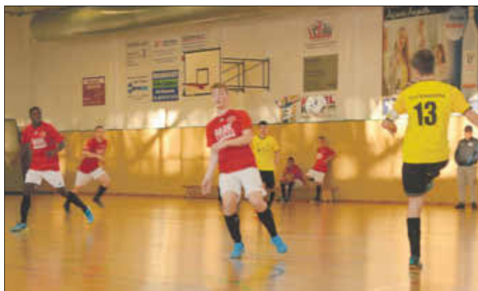
Sechs Mannschaften kämpften um den „Pokal des Bürgermeisters“.

Sechs Fußball-Mannschaften aus dem A-Junioren-Bereich (17/18 Jahre) traten am 20. Januar auf Einladung des FC Bad Liebenwerda in der Sporthalle in der Heinrich-Heine-Straße zum „Pokal des Bürgermeisters“ an. Mit der Ausrichtung des Turniers will der Verein neben dem sportlichen Wettkampf auch die Verbundenheit zur Stadt Bad Liebenwerda demonstrieren.