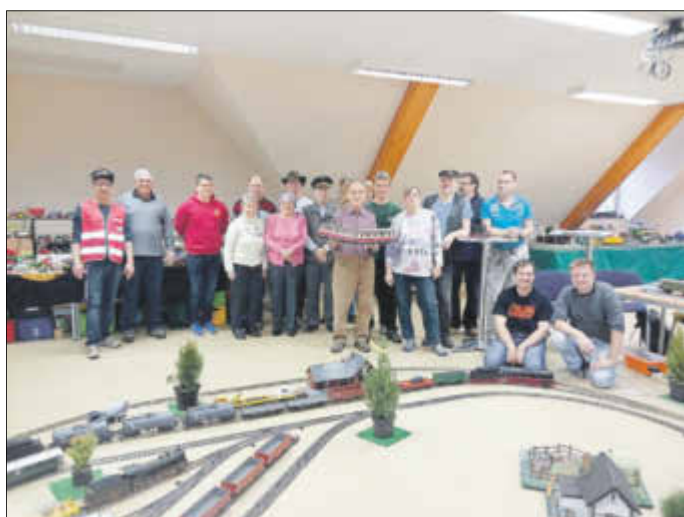
Teilnehmer der Indoor-Fahrtage in Maasdorf.