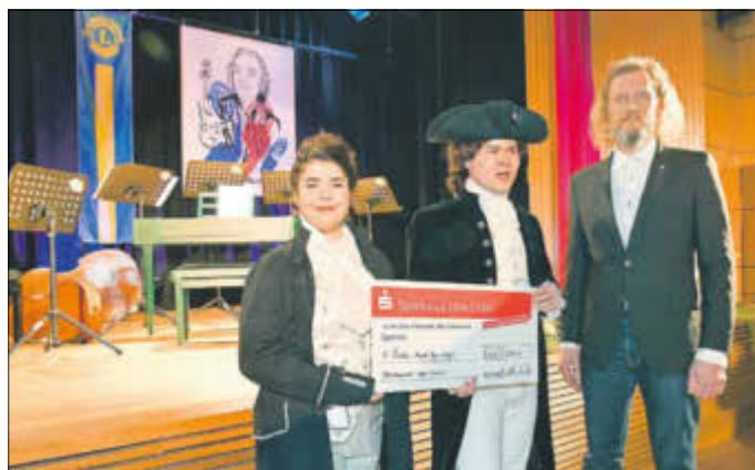
Der Hauptpreis ging an das „Neue Mannheimer Orchester“, das als Hofkapelle Elbe-Elster klassische Musik und insbesondere das Erbe der Brüder Graun pflegt.