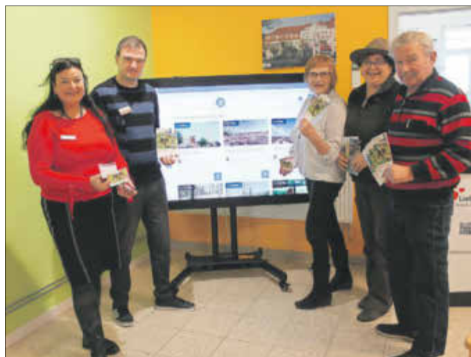
Gemeinsam mit beteiligten Partnern stellte die Tourist Information den neuen Wandertourenkalender vor.

Der neu erschienene Wandertourenkalender 2019 für die Kurstadt Bad Liebenwerda und ihre Umgebung ist kürzlich in der Tourist Information vorgestellt worden. Verschiedene Partner haben dazu beigetragen, über das ganze Jahr verteilt Wander- und Radtouren anzubieten, die in die nähere und weitere Region führen und immer viel Wissenswertes