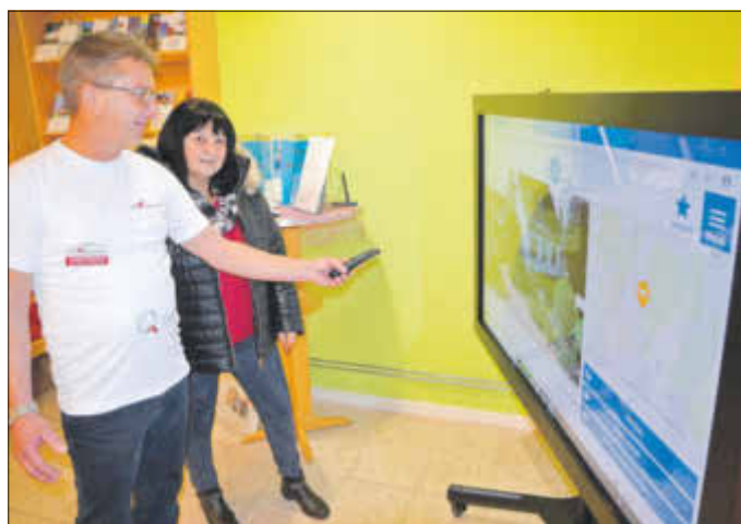
Präsentiert wurde beim „Tag der offenen Tür“ der Touchscreen, der Zugriff auf die Software-Anwendung „Mein Brandenburg“ erlaubt.

Die Tourist Information Bad Liebenwerda führte am 21. Januar einen „Tag der offenen Tür“ durch, zu dem die Beherberger und Gastronomen der Stadt, Gäste aus Wirtschaft, Politik und Verwaltung sowie die Q-Stadt-Partner eingeladen waren. Präsentiert wurde dabei unter anderem die neueste in der Einrichtung verwendete Technik.