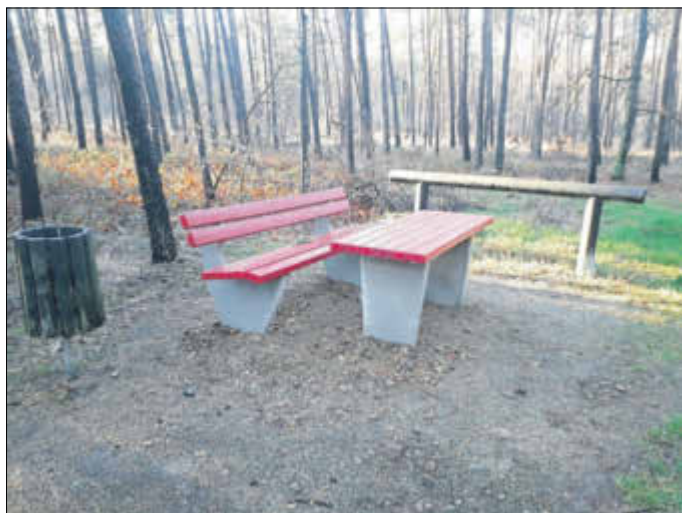
Neue Bänke und Tische im Gemeindegebiet sollten Radler zum Rasten einladen.

Janin Soltis, SB Straßenunterhaltung, Bauhof