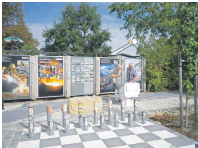
Die Ausstellung zur Lausitzer Energie- und Industriegeschichte ist weiter ausgebaut worden.

Der Heimatverein Maasdorf e. V. führte auch im Jahr 2018 zahlreiche Veranstaltungen durch, wie interessante Vorträge, eine Radpartie, eine Bustour und Adventsveranstaltungen. Weitere Schwerpunkte waren die weitere Gestaltung der Ausstellung „Lausitzer Energie-, Kohle- und Industriegeschichte“ und unser Beitrag zum Natur- und Umweltschutz.