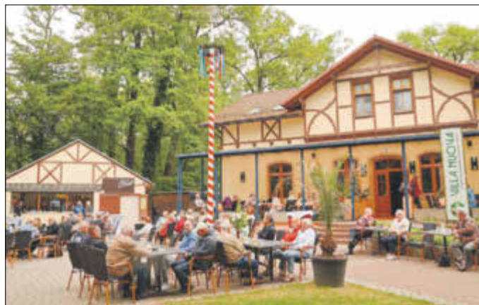
Unter dem rot-weißen Maibaum fanden sich etliche Gäste im Kurpark ein.

Spreewald stilecht mit Blasmusik umrahmt wurde, fand gute Resonanz beim Publikum - auch wenn Wind und bewölkter Himmel am Vormittag nicht unbedingt für bestes Ausflugswetter sorgten.