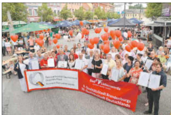
Die zertifizierten Betriebe und Einrichtungen ließen im Anschluss an die Auszeichnung Luftballons steigen.

Parallel zum Elsterlauf fand im Kurpark wieder ein Kinder- und Familienfest mit vielen Stationen statt, die von Vereinen und Einrichtungen eingerichtet worden waren. Zudem befreuigten sich die Jüngsten beim Bambinilauf ebenfalls sportlich. KB