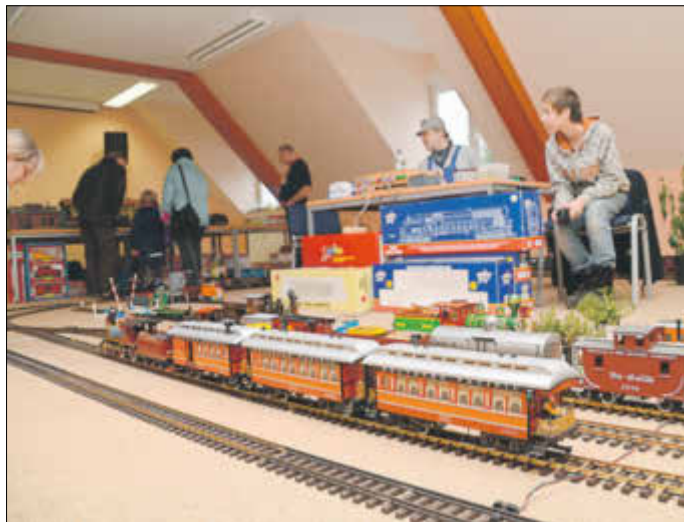
Gartenbahnfreunde kommen beim Indoor-Treffen auch im Winter auf ihre Kosten.

bäude können Gartenbahnen verschiedener Stile in Aktion bestaunt werden. Für das leibliche Wohl ist ebenfalls gesorgt. Alle Interessierten sind herzlich willkommen!