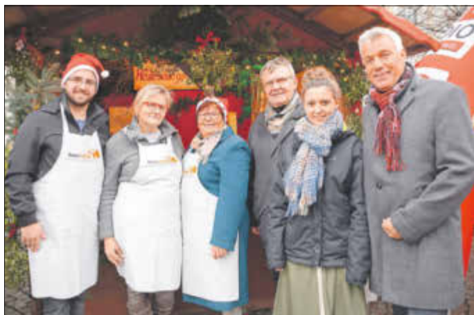
HausLeben zeigte beim Weihnachtsmarkt wieder Präsenz.