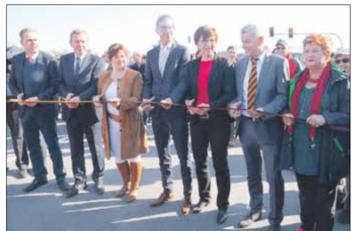
Im Beisein zahlreicher Bürger wurde die neue Ortsumgehungsstraße am 5. Oktober freigegeben.

Elsterwerda startete im September 2017. Auf dem fast fünf Kilometer langen Abschnitt wurde die Fahrbahn erneuert und Überholstrecken eingerichtet. Um die Bauzeit zu verkürzen, kam sogenannter Kompaktasphalt zum Einsatz. Dabei handelt es sich um zwei Schichten des Straßenbelags, die unmittelbar hintereinander aufgebracht werden müssen. Abschließend erfolgt eine Verdichtung mit einer Vibrationswalze. Dieses Verfahren machte es erforderlich, den Streckenabschnitt zu sperren und den Verkehr auf den nebengelegenen Rad- und Wirtschaftswegen und einer Kommunalstraße vorbeizuführen. Die Baukosten betragen 8,5 Millionen Euro.