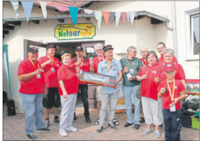
Ein Höhepunkt des 25. Gartenbahntreffens war der Besuch von einer Gruppe Gartenbahner aus Radebeul.

Geschenk im Gepäck: einen Waggon für den Sachsenzug des Elster-Natoureams.