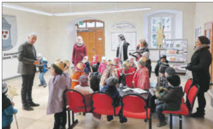
Die Sternsinger im Rathaus-Foyer.

Eine schöne Tradition zum Jahresbeginn fand auch 2019 ihre Fortsetzung: Kinder der Evangelischen Kindertagesstätte St. Martin zogen als Sternsinger von Haus zu Haus,