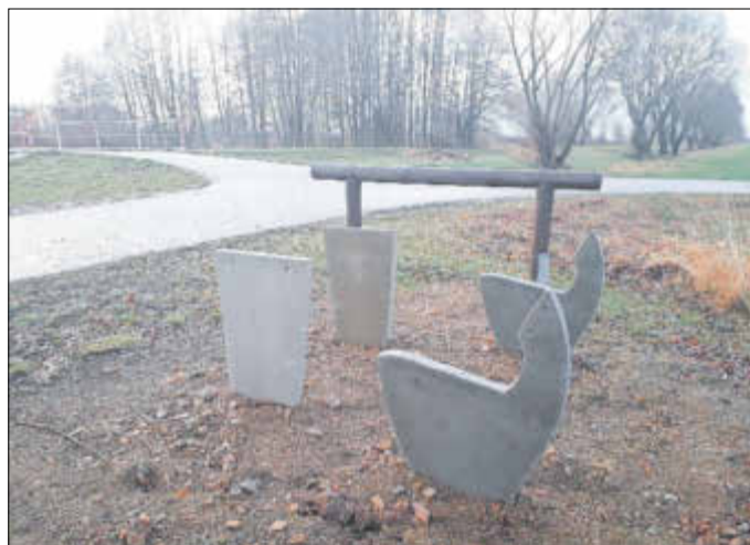
Schon bald nach ihrer Aufstellung wurden die Kunststoffplatten der Bänke und Tische bereits gestohlen.