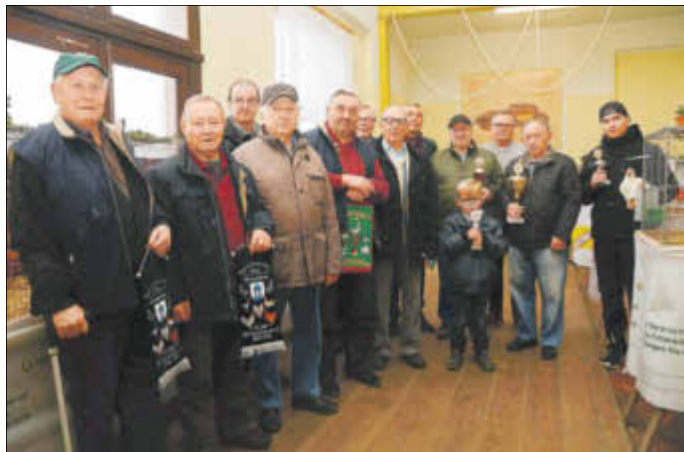
Preisträger und Gäste der Rassegeflügelzucht in Zobersdorf.