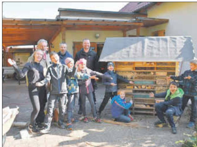
Im Naturschutzprojekt setzten sich Kinder und Jugendliche mit viel Engagement und auch Spaß für die heimische Insektenwelt ein.

nach Motiven bis zum Würfeln mit Quizfragen). Auch das bereits 2017 fertig gestellte Schachspiel bezieht sich mit seinen Figuren auf das Thema der Ausstellung. Außerdem wurden weitere Ausstattungs-elemente aufgestellt, da die Bodengestaltung abgeschlossen ist. Finanzielle Unterstützung erhielten wir 2018 durch das Ministerium für Arbeit, Soziales, Gesundheit, Frauen und Familie des Landes Brandenburg (Lottomittel) durch die Lokale Aktionsgruppe Elbe-Elster (EU-Mittel, „Kleine lokale Initiativen 2018“), von der Aktion „Mensch“, der Sparkassenstiftung „Zukunft Elbe-Elster-Land“, dem Kulturstadamt des Landkreises Elbe-Elster, der Dr.-Wolfgang-Liebe-Stiftung –