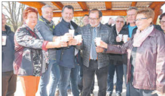
Die Bürgermeister der Kurstadtregion und die Ortsvorsteher der beteiligten Dörfer stießen am 20. Oktober mit Minister Vogelsänger und Landtagsabgeordneten aus der Region auf die Eröffnung des Sternweges durch die Grüne Heide an.

Nachbarstadt Uebigau-Wahrenbrück eingebunden ist, sei erfreulich. Verwirklicht werden konnte das Vorhaben durch Fördermittel, Sponsorengelder und Zuschüsse unter anderem der Aktion Mensch, der Kurstadtregion Elbe-Elster und der Stadt Bad Liebenwerda sowie durch tatkräftige Unterstützung durch den Landesbetrieb Forst, der Wege im Bereich der Grünen Heide auf gut 36 km Länge befestigte und instandsetzte.