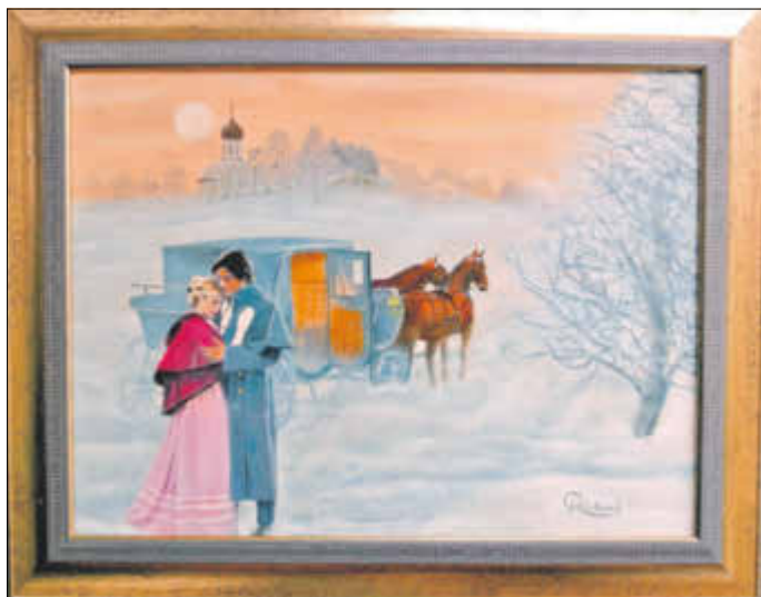
„Romanze in der Taiga“ ist der Titel dieses Ölgemäldes.