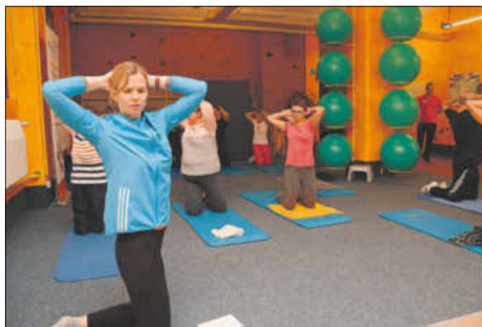
Eine Stunde lang trainierte Olympiasiegerin Britta Steffen mit Teilnehmern des Aktionstages im Epikur.