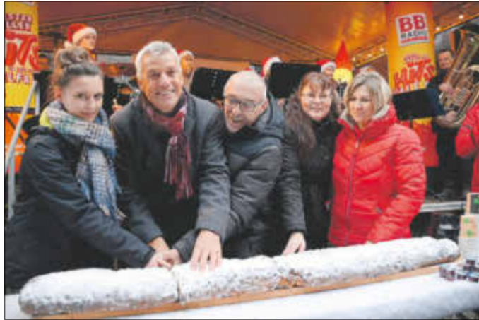
Der Anschnitt des Riesenstollens markierte wie immer den offiziellen Start des Weihnachtsmarktes. Der Ansturm auf das Weihnachtsgebäck stand stellvertretend für die gute Resonanz, die der Weihnachtsmarkt insgesamt erhielt.

trotz nicht idealer Witterungsbedingungen - zahlreiche Besucher auf den Markt der Kurstadt, wo zwischen Bühne und Buden weihnachtliches Treiben herrschte. Wie immer ein erster Höhepunkt war der Anschnitt des Riesenstollens durch Vertreter der Stadt und des Handels-, Handwerks- und Gewerbevereins sowie das Hirtenmädchen Barbara, bei dem dieses Mal Spenden zugunsten der Kneipp-Kindertagesstätte „Pfiffikus“ gesammelt wurden. Viele Besucher des Weihnachtsmarktes ließen sich ein Stück des Stollens der Konditorei Beeg schmecken. Großer Resonanz des Publikums erfreute sich auch das Adventskonzert der Big Band Bad Liebenwerda in der Nikolaikirche.