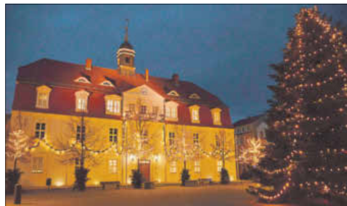
Weihnachtliche Stimmung kam ab Ende November dank der 39 Lichtbäume rund um den Markt auf.

Exakt sind es 22.690 LED-Lämpchen, die an den insgesamt 39 Straßenbäumen leuchten: Am Freitag vor dem ersten Advent (30. November) wurde die neue Weihnachtsbeleuchtung der Innenstadt in Betrieb genommen. Jeder zweite Baum entlang des Marktes sowie der Breiten Straße und der Mittelstraße hatte sogenannte LED-Vorhänge bekommen, nachdem der Handels-, Handwerks- und Gewerbeverein e.V. (HHG) im Oktober unter dem Motto „Die Stadt soll weihnachtlich strahlen!“ noch einmal in die Offensive gegangen war, um die Finanzierung der Beleuchtung zu sichern. Während der Innenstadtfonds mit 7.550 die Hälfte der Gesamtnettokosten in Höhe von 15.100 Euro trug, wurden für den Eigenanteil Lichtbaumpaten gesucht. Ergänzt durch eine Vielzahl kleinerer Spenden sowie einem Teil des Erlöses aus dem Verkauf eines Kalenders mit Luftbildern der Stadt von Jens Berger trugen insgesamt 15 Geschäftsinhaber und Unternehmen durch ihre Lichtbaumpatenschaft dazu bei, dass die benötigten Mittel zusammenkamen.