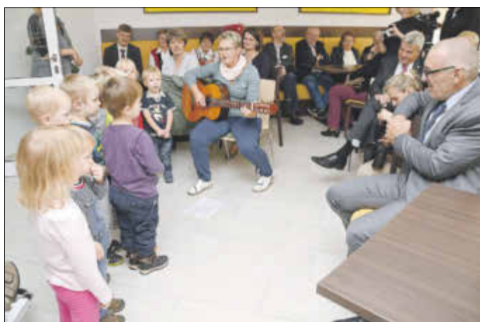
Kinder aus der Kita Waldhaus gratulierten mit einem kleinen musikalischen Programm zur Einweihung.