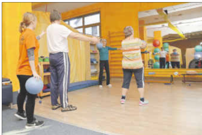
Unter Anleitung von Sportherapeuten wird unter dem Dach des Gesundheitssportvereins Epikur Funktionstraining und Reha-Sport getrieben.

Mit rund 160 Mitgliedern und weiteren rund 300 Menschen, die unter seinem Dach Reha-Sport und Funktionstraining treiben, ist er für die Kur- und Gesundheitsstadt Bad Liebenwerda ein beachtlicher Faktor – und das seit mittlerweile schon einem ganzen Jahrzehnt: Am 15. November, genau am Datum seiner Gründung, hat der Gesundheitssportverein Epikur e. V. im Rahmen seiner Mitgliederversammlung das Jubiläum seines zehnjährigen Bestehens gefeiert.