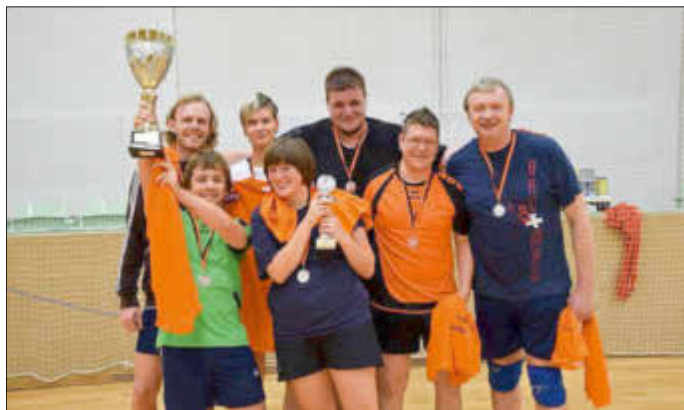
Die Sieger des 17. Volleyball-Night-Events: LSV Bad Liebenwerda.

Der 17. Volleyball-Night-Event, organisiert vom Freizeit- und Medienzentrum Regenbogen in Bad Liebenwerda, fand am 5. November und damit am 23. Geburtstag des Regenbogenhauses in der Sporthalle Bad Liebenwerda statt.