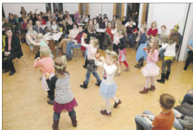
Kinder aus der Kneipp-Kita „Pfiffikus“ in Zeischa eröffneten mit einem Programm die Gründungsversammlung.