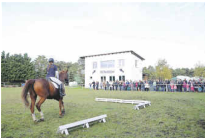
Mit Reitvorführungen wurde die Einweihung des Ersatzneubaus umrahmt.