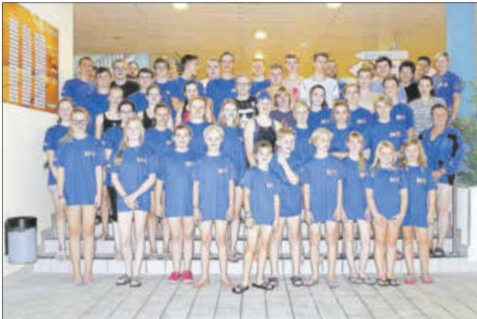
Einmal jährlich treffen sich die Schwimmer aus Bad Liebenwerda und Lübecke.