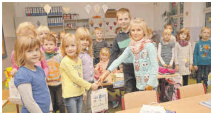
Erstklässler nahmen die Lesetüten aus den Händen von Schülern der zweiten Klassen in Empfang.

Die ersten Buchstaben kennen sie bereits, und ganz gewiss werden es bald noch mehr: Beim Lernen und Lesen und Schreiben haben die Erstklässler im Grundschulzentrum Robert Reiss schon einige Forstschritte gemacht. Um bei ihnen die Lust aufs Lesen zu wecken, haben die Mädchen und Jungen jetzt eine „Lesetüte“ der Bad Liebenwerdaer Buchhandlung Martina Götz bekommen, die ein Buch für Leseanfänger, ein Lesezeichen, einen Stundenplan und einen Brief an die Eltern mit Tipps zur Leseförderung enthält. Überreicht wurden die Lesetüten