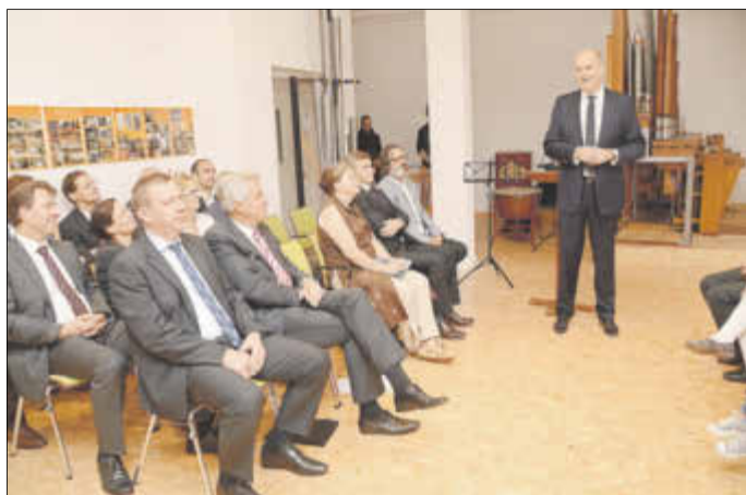
Ministerpräsident Dietmar Woidke lobte das hohe persönliche Engagement, das in die Verwirklichung des Projektes Orgelakademie einfluss.

Dies hörte man in der Südbrandenburgischen Orgelakademie (SBOA) gern: „Ich komme gern wieder. Hier gefällt’s mir“, sagte Ministerpräsident Dietmar Woidke kurz vor seinem Abschied. Im Rahmen eines Besuchs bei den Unternehmen Variograph in Elsterwerda und Reiss Büromöbel in Bad Liebenwerda hatte der Chef der Landesregierung am 21. September auch in der Orgelakademie vorbei geschaut, wo in seinem Beisein der Kammermusiksaal feierlich in Dienst gestellt wurde. Den Aufbau der Einrichtung war von Woidke zuletzt mit 10.000 Euro aus Lotto-Mitteln unterstützt worden.