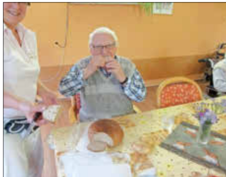
Auch das frische Kartoffelbrot, verfeinert mit selbstgemachtem Fett, stieß auf guten Zuspruch.

In regelmäßigen Abständen führen wir Katholischen Altenpflegeheim St. Marien Thementage durch. Diesmal stand am 30. September 2016 die Kartoffel im Mittelpunkt. Am Vormittag und Nachmittag wurden nicht nur die unterschiedlichsten Kartoffelgerichte zubereitet, es ging auch um die