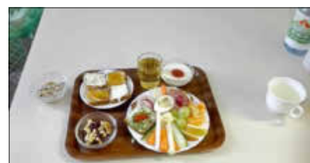
Eindrücke vom Informationsabend