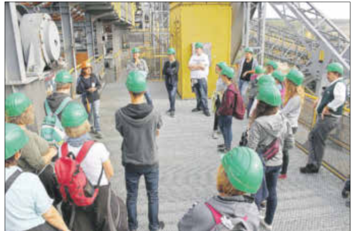
Am Besucherbergwerk F60 in Lichterfeld.