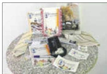
Für zahlreiche Kurstadt-Souvenirs gibt es ab sofort Preisnachlass.

Ab sofort gibt es für zahlreiche Produkte aus dem reichhaltigen Sortiment der Tourist Information Preisnachlässe. Darunter fallen alle Aufkleber der Kurstadt, Krawatten und Tücher aus reiner Seide, Würfelbecher und vieles mehr.