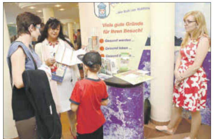
Die Tourist Information präsentierte die Angebote der Kurstadt den Besuchern des Rheumatages.