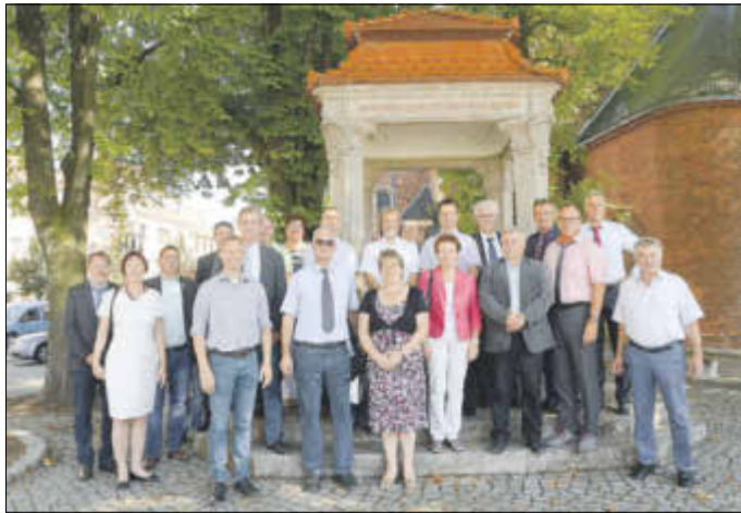
Den Abschluss des „Tages der Kommune“ bildete ein geführter Stadtrundgang durch Bad Liebenwerda.

Der jährlich stattfindende „Tag der Kommune“ des Energiever-