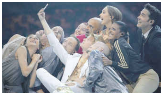
Das Pop-Oratorium „Luther“ erzählt die Reformationsgeschichte einmal anders.

Unter anderem wird ein Open-Air Konzert in der Lutherstadt Wittenberg am 26. August stattfinden, bei dem dann über 200 SängerInnen und Sänger aus Kirchen-, Pop-, Gospel-, Schul- und Jugendchören gemeinsam auf der Bühne stehen.