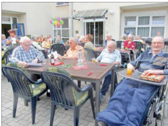
Jährlich wird für die Bewohner des Altenpflegeheims das Grillfest organisiert.