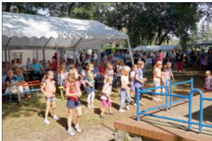
Nach dem Auftritt des Super Dance Club Gröditz konnten sich die jungen Festbesucher im Zumba üben.

Das diesjährige Dorf- und Kinderfest in Prieschka begann am Freitagabend, dem 19. Juli, mit einer Kindernachtwanderung. 53 Kinder und Eltern nahmen mit Begeisterung daran teil. Ausgerüstet mit Taschenlampen wurde eine einstündige Wanderung durch den Gänsewinkel unter-