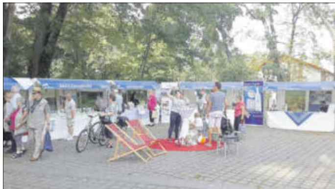
Mit den Brandenburger Kurorten präsentierte sich Bad Liebenwerda auf der „Gesundheitsinsel“ beim Brandenburgtag.

Die Kurstadt Bad Liebenwerda präsentierte sich unter dem Dach des Brandenburgische Kurorte- und Bäderverband e. V. auf der Gesundheitsinsel auf einem der landesweit beliebtesten Feste – dem 15. Brandenburg-Tag, der am 3. und 4. September unter dem Motto: „Hoppegarten ... gut im Rennen“ in Hoppegarten stattfand. Bad Liebenwerda gab auf der Aktionsfläche den Gästen die Gelegenheit, das Heilmittel Moor auszuprobieren. Die Besucher ließen sich zudem zu individuellen Gesundheits- und Reiseangeboten beraten. Am Stand waren ebenso Wandern, Radfahren sowie die Heide, aber auch speziell das Kulturangebot zum 18. Internationalen Puppentheaterfestival sehr gefragt. Viele Besucher zeigten Interesse, sich zum Tag der offenen Tür in der MEDIAN Fontana-Klinik, dem 12. Branden-