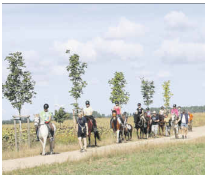
Der Wanderritt führte die jungen Reiter nach Reichenhain.

Bereits zum zweiten Mal fand für den Reitnachwuchs in Oschätzchen ein dreitägiges Zeltlager statt. In der letzten Ferienwoche trafen sich 22 Kinder und Jugendliche und errichteten auf dem Reitplatz eine kleine Zeltstadt. Unter anderem stand auf dem Programm ein individuelles Reittraining für Groß und Klein, eine Kremserfahrt durch die Natur zum „Eiscafé Tiersch“ nach Nieska, sowie viel Spaß und Spiel. Den Höhepunkt des Reitlagers bildete ein Wanderritt mit nach Pferden nach Reichenhain, wo die Kinder und Jugendlichen vom Gasthaus „Eichhörnchen“ mit einem leckeren Mittagessen versorgt wurden. Der verantwortungsvolle Umgang mit Pferden, die