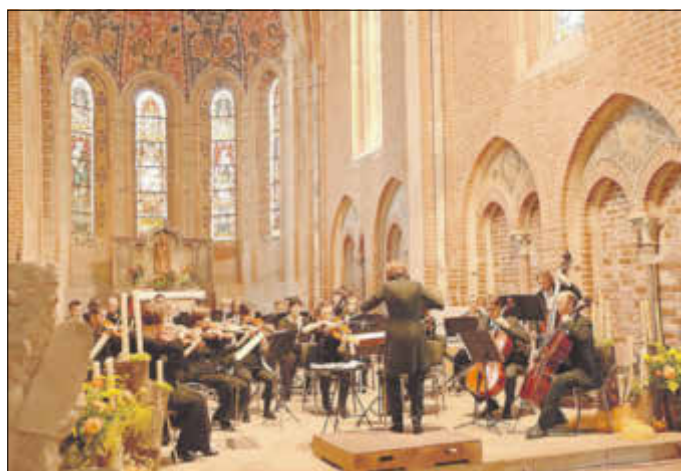
Beim Konzert des Orchesters Sinfonietta aus Dresden kamen auch im Speziallager komponierte Musikstücke zur Aufführung.