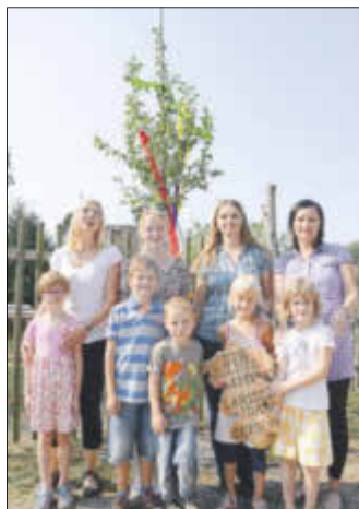
Die Schulanfänger und ihre ehemaligen Erzieherinnen am neu gepflanzten Birnbaum an der Kita „Kinder vom Mühlenhof“.

Mit einem Birnbaum haben die Mädchen und Jungen, die mit dem Schulanfang die Kita „Kinder vom Mühlenhof“ in Lausitz verlassen, eine Erinnerung an ihrem alten Kindergarten hinterlassen. Am Tag der offenen Tür, der am 10. September in der Einrichtung stattfand, haben die fünf Schulanfänger dieses Jahres gemeinsam mit ihren Eltern einen Birnbaum gepflanzt. Ein Holzschild benennt die Namen der Schulanfänger. Bereits seit Jahren wird dieser Brauch in der Kita „Kinder vom Mühlenhof“ gepflegt.