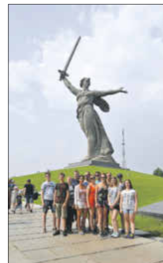
„Mutter Heimat“ in Wolgograd.

manche unserer europäischen Standards eigentlich überflüssig sind. Der Zusammenhalt im Ferienlager war unglaublich groß und von der angespannten politischen Situation merkte man kaum etwas, jedoch waren die Meinungen der Bürger darüber verschieden. Trotzdem begegneten sie uns immer gastfreundlich und aufgeschlossen, womit sich meine Erwartungen bezüglich der russischen Mentalität bestätigten. Die Reise erweiterte unseren Horizont in jeder Hinsicht und ich kann nur jedem empfehlen, solche Gelegenheiten zu nutzen, um sich sein eigenes Bild von der Welt zu schaffen.