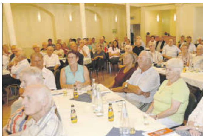
Bei der Eröffnungsveranstaltung verfolgten zahlreiche Teilnehmer des Treffens die Ausführungen zur Musik im Lager.