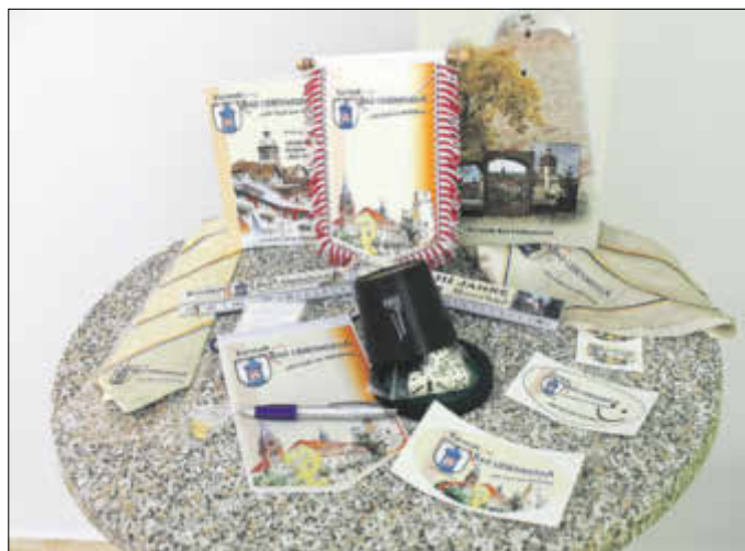
Für zahlreiche Kurstadt-Souvenirs gibt es ab sofort Preisnachlass.

Ab sofort gibt es für zahlreiche Produkte aus dem reichhaltigen Sortiment der Tourist-Information Preisnachlässe. Darunter fallen alle Aufkleber der Kurstadt, Krawatten und Tücher aus reiner Seide, Würfelbecher und vieles mehr.