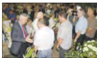
Viele verdiente Bürger Zeischas wurden während der Festveranstaltung ebenfalls ausgezeichnet.