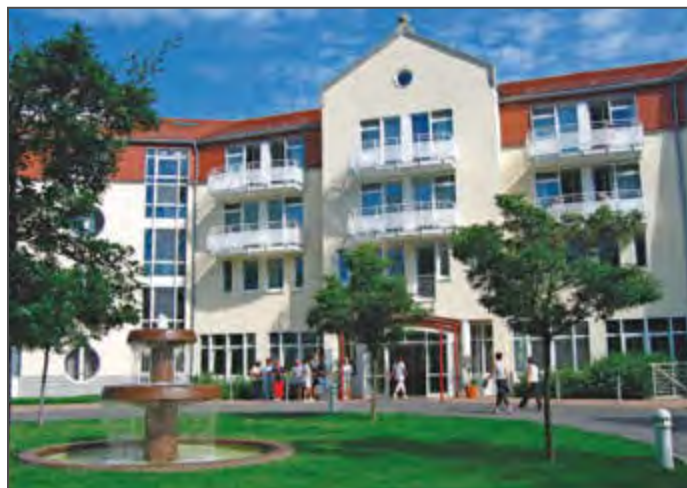
Die MEDIAN Fontana-Klinik ist in diesem Jahr Gastgeber des „Tag des Rheumakranken“.