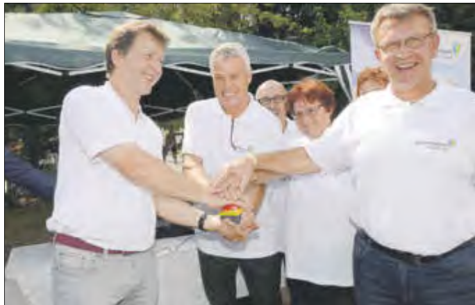
Gemeinsam freigeschaltet wurde von den Verwaltungschefs der vier Städte die Internetseite der Kurstadtregion Elbe-Elster.