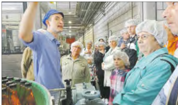
Betriebsführung bei der Bauer Fruchtsaft GmbH.

Die Bauer Fruchtsaft GmbH lädt in diesem Jahr herzlich ein zu einem kleinen Apfeltag, am Sonntag, dem 17. September, auf dem Betriebsgelände des Unternehmens, Am Brunnenpark 5 - 6, in Bad Liebenwerda in der Zeit von 11 bis 17 Uhr.