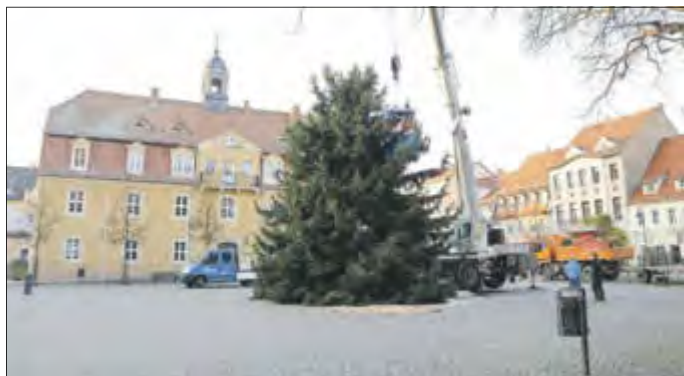
Auch ein stattlicher Weihnachtsbaum für den Markt wird wieder gesucht.

Um auch in diesem Jahr die Stadt weihnachtlich schmücken zu können, werden wieder Nadelbäume und Tannengrün gesucht. Die Bäume sollten eine Größe zwischen zwei und fünf Metern haben. Weiterhin wird ein großer, stattlicher Baum ab einer Höhe von 13 Metern für den Weihnachtsmarkt benötigt.