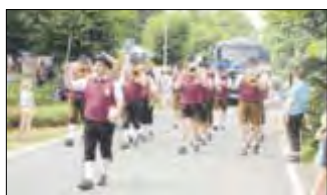
Mit von der Partie: Die Blaskapelle aus dem bayerischen Westendorf.