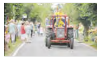
Der Festumzug am Sonnabend zog viel Publikum an.