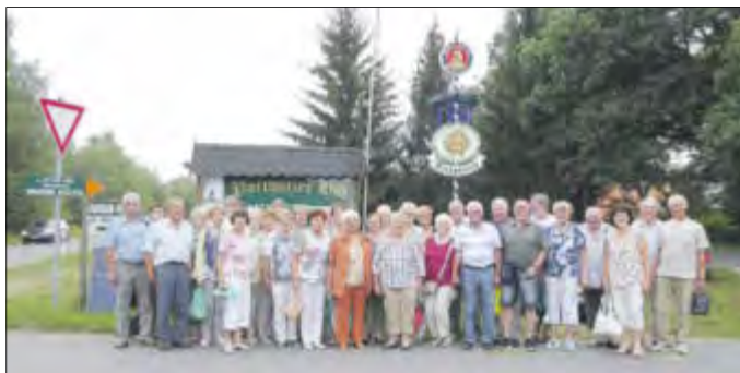
Vor ihrer Sommerpause besuchten die Sängerinnen und Sänger des Kurstadt-Singkreises das Lausitzer Seenland.

Bevor der Kurstadt-Singkreis Bad Liebenwerda in die Sommerpause ging und viele Mitglieder den wohlverdienten Urlaub antraten, gab es noch eine tolle Ausfahrt in die Senftenberger Seenlandschaft. Mit dem Bus fuhren wir Richtung Großkoschen. Die Fahrt von dort mit der Seeschlange war die Überraschung des Tages. Bei dieser Fahrt umrundeten wir den Geierswalder See. Neben der schiffbaren Verbindung Koschener Kanal sahen wir die „Marina“ den Leuchtturm und die schwimmenden Ferienhäuser. Unterwegs machten wir eine Kaffeepause und ließen uns die selbst gebackenen Muffins und Kaffee gut schmecken. Über den Barbara Kanal führte die Tour zum Sornoer Kanal. Der Aussichtspunkt „Rostiger Nagel“ lud uns ein, einen atemberaubenden Blick über das entstehende Lausitzer Seenland zu genießen. Der Fahrer der Seeschlange übermittelte uns sehr ausführlich und kompetent die Entstehungsgeschichte der Seenlandschaft. Mir wurden Erinnerungen wach, da ich im Tagebau Großkoschen vor etwa 50 Jahren als Jungfachaarbeiter, kurze Zeit gearbeitet habe. Es ist