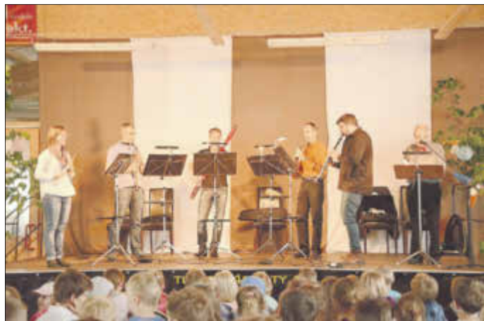
Musiker von der renommierten Kammerakademie Potsdam führten für die Kinder das musikalische Märchen „Peter und der Wolf“ auf.