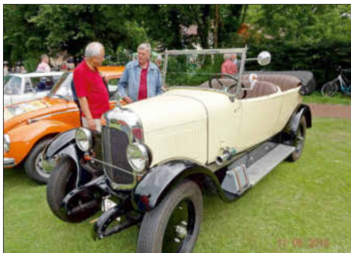
Erfreulich viele Oldtimer-Liebhaber beteiligten sich mit ihren Schmuckstücken an der Veranstaltung.