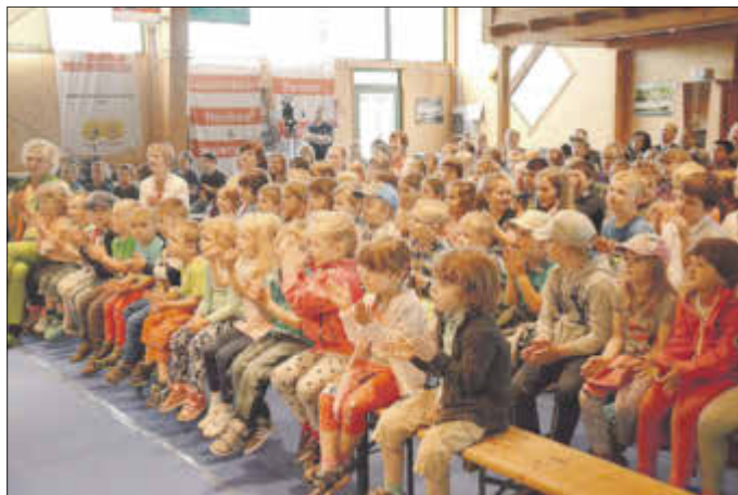
Grundschüler und Kita-Kinder aus Bad Liebenwerda und Elsterwerda zählten zu den Gästen, die „Expert-Bau Bad Liebenwerda“ am Kindertag in Ruhland empfing.