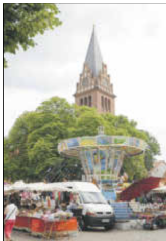
Bereits am Freitag öffnete der Schau- stellerpark auf dem Markt.

Am Wochenende vom 27. bis 29. Mai feierten die Bad Liebenwerdaer und ihre Gäste das Brunnenfest mit Elsterlauf. Während bereits ab Freitagnachmittag mit Schaustellerpark und der Veranstaltung „CityHeartBeat“ der Konditorei Beeg das Programm des Festes startete, fiel der offi-