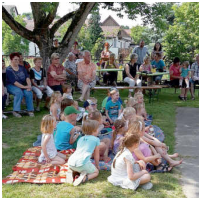
Das schöne Wetter lockte viele Interessierte zum Kinderfest und zum Tag der offenen Tür im Kindergarten.

Anlässlich des 40-jährigen Jubiläums des Kindergartens Gänseblümchen in Kröbeln veranstaltete der Förderverein der Einrichtung am 4. Juni 2016 ein Kinderfest und einen Tag der offenen Tür. Das schöne Wetter lockte viele Interessierte an. Das Musiktheater Dudel Lumpi begeisterte nicht nur die Kinder, auch die Erwachsenen erfreuten sich daran. Die Kinder des Kindergartens präsentierten sich ebenfalls mit einem kleinen Programm. Vom Ortsbeirat bekamen die Kinder ein Netz voller Spielbälle geschenkt. Eine besondere Freude für uns war die Einweihung der lang ersehnten Nestschaukel, die den Kindern ab sofort als neues Außenspielgerät zur Verfügung steht. Nochmals vielen Dank an Alle, die uns bei diesem Projekt unterstützt haben. Bedanken möchten wir uns weiter bei Herrn Uwe Keller, der uns mit der musikalische Umrahmung