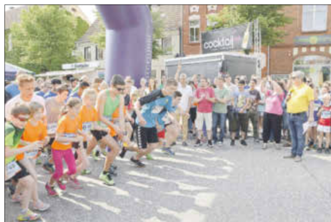
Mit über 1000 Teilnehmern bewies auch der Elsterlauf einmal mehr seine Beliebtheit.