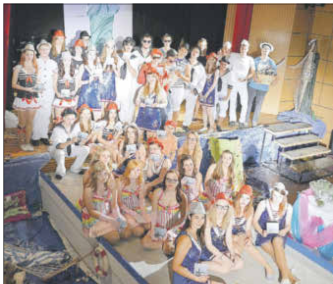
Nicht nur Kostüme und Kulissen waren sehenswert: Das Musical der Oberschule Robert Reiss erntete begeisterten Applaus des Publikums.