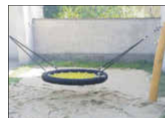
Eingeweiht wurde zu diesem Anlass auch die neue Nestschaukel.

Förderverein „Gänseblümchen Kröbeln e. V.“