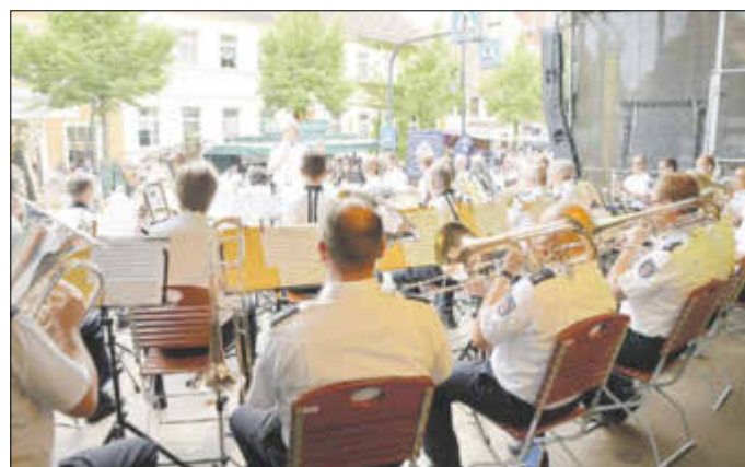
Beim Konzert des Landespolizeiorchesters Brandenburg am Sonntagnachmittag wurden Spenden für „HausLeben“ gesammelt.