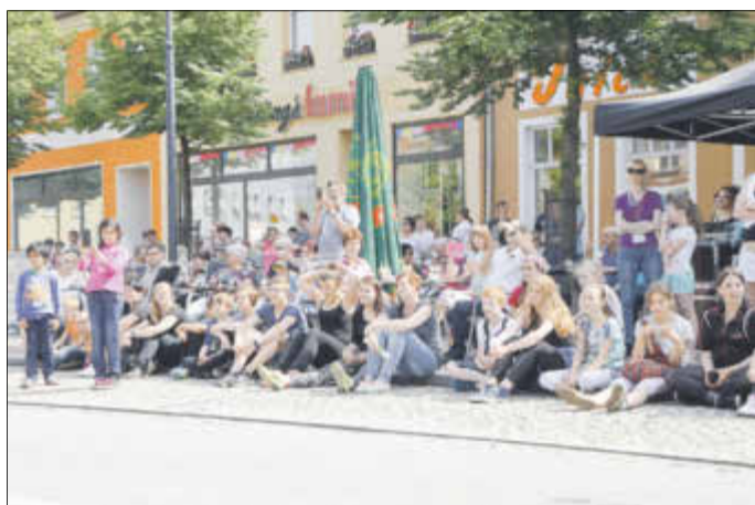
Die Talentshow des Grundschulzentrums zog das Publikum in ihren Bann.

Mineralquellen Bad Liebenwerda GmbH, Bernd Landmann (Flash-Dance Media), Antenne Brandenburg, Sparkassenstiftung „Zukunft Elbe-Elster-Land“, UKA Cottbus Projektentwicklung GmbH & Co. KG, Bauer Fruchtsaft GmbH, Privatbrauerei Ernst Barre GmbH, Schaustellerfamilie Krämer, HGB Bad Liebenwerda mbH, REISS Büromöbel GmbH, Jagdverband Bad Liebenwerda e. V., Volksbank Elsterland eG, dm Elsterwerda (Drogeriemarkt), enviaM