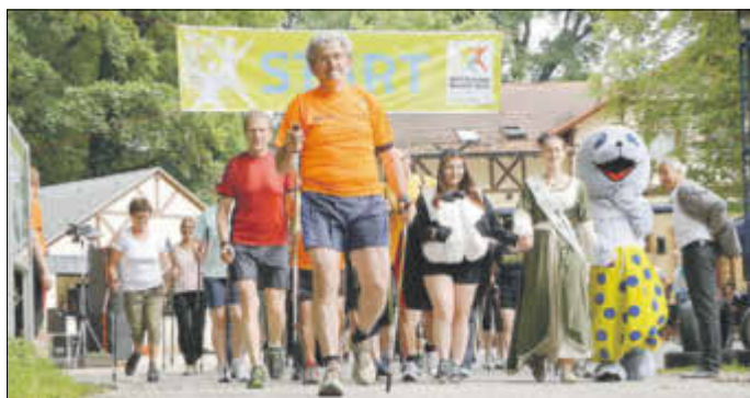
Zum 14. Mal fiel im Kurpark-Wäldchen der Startschuss für den Walkingtag.

In gewohnter Weise vor der tollen Kulisse des Kurpark-Wäldchens hat am 12. Juni – und damit etwas später als in anderen Jahren – der 14. Deutsche Walkingtag in der Kurstadt Bad Liebenwerda stattgefunden. Gemeinsam von der Tourist Information der Kurstadt, den Median-Kliniken Bad Liebenwerda, der Barmer GEK, der Lausitztherme Wonnemar, dem DRK und dem Lauf- und Walkingverein 05 Bad Liebenwerda organisiert sowie von der Mineralquellen Bad Liebenwerda