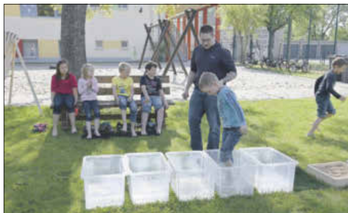
Kneipp-Anwendungen wie das Wassertreten konnten während des Projekttages von den Kindern ausprobiert werden.