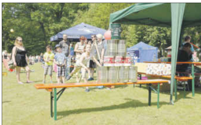
Für Spaß und Unterhaltung war beim Kinder- und Familienfest im Wäldchen bestens gesorgt