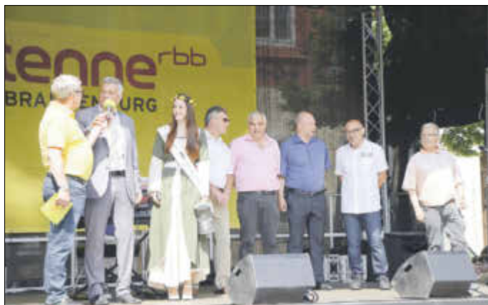
Die offizielle Eröffnung des Brunnenfestes.