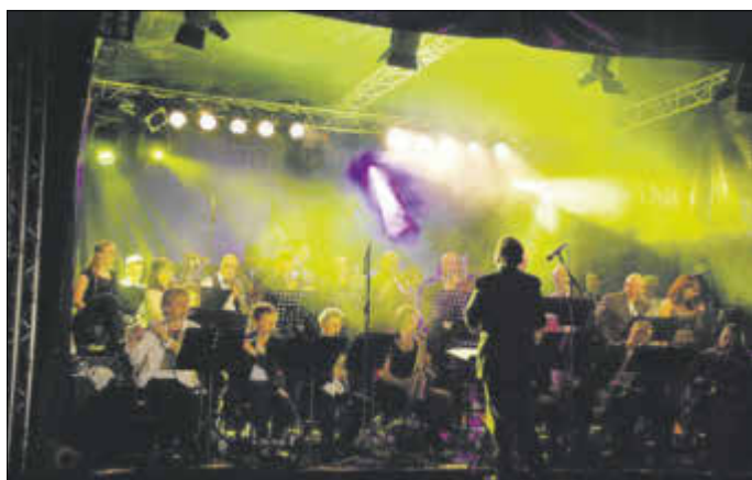
Im Vorjahr gab es den Auftakt, nun geht das Musikfest BaLie in die zweite Auflage.

Vom 1. bis 3. Juli wieder jede Menge Musik im Kurpark Bad Liebenwerda und im Stadtzentrum