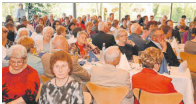
Viele der insgesamt 178 Mitglieder feierten im Bürgerhaus das Jubiläum des TSV.