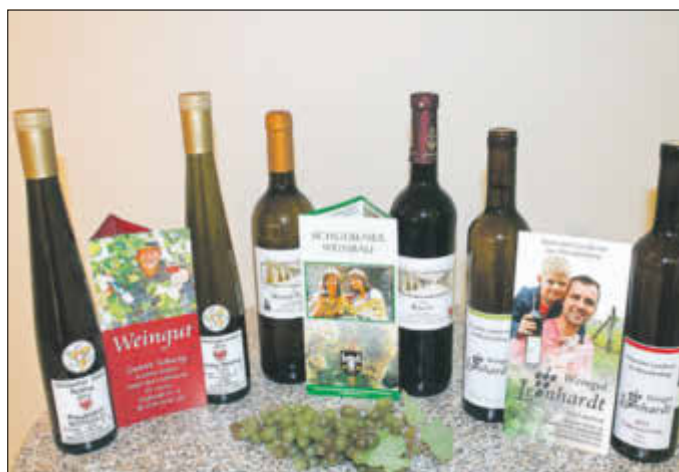
Neben den Weinen von Winzern aus dem Stadtgebiet sind in der Touristinformation jetzt auch edle Tropfen aus Schlieben erhältlich.