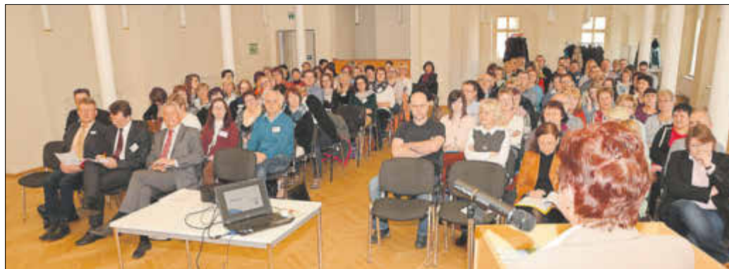
Eine gemeinsame Personalversammlung der Verwaltungen der vier Städte fand unlängst in Mühlberg statt.