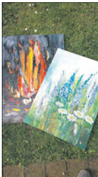
Die Ausstellung zeigt unterschiedlichste Werke der „Donnerstagsmalerinnen“.

Ausstellung in der Touristinformation von Mai bis Juni