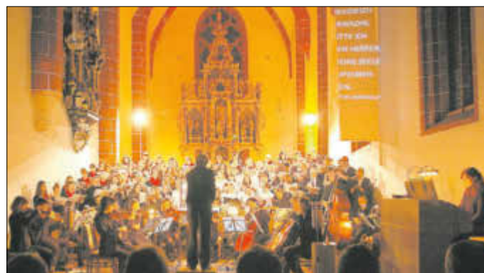
Noch ganz erfüllt von dieser wunderbaren zweiten Aufführung der „Friedensstifter“ zur Osternacht in Meißen, freuen sich die Sängerinnen und Sänger nun auf den „Messias“.