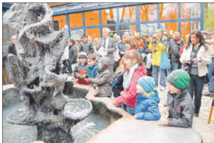
Auf großes Interesse stieß die Einweihung des neuen Brunnens auf der Terrasse der „Villa Nuova“.