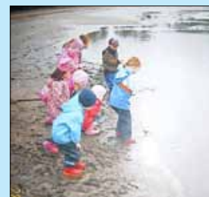
Abfischen an den Maasdorfer Teichen: Die Kinder verfolgten interessiert das Spektakel.

zum Schluss ein großer, dicker Karpfen im Kescher gezeigt wurde, lachten die Kinder laut auf, denn der Fisch versuchte aus dem Netz zu hüpfen. Alle freuen sich jetzt schon auf das Abfischen 2015! Kita „Am Fliegerberg“