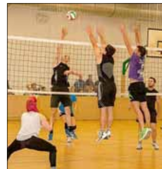
Bis in die frühen Morgenstunden rangen die Teams um Punkte.