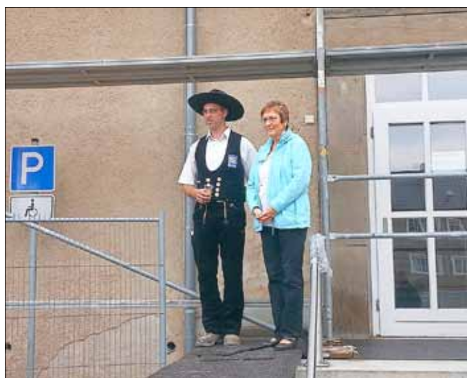
An der Multifunktionalen Halle des Grundschulzentrums konnte kürzlich Richtfest gefeiert werden.