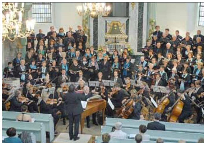
Die Zusammenarbeit der Kantoreien Elsterwerda und Bad Liebenwerda hat gute Tradition, bei der Aufführung