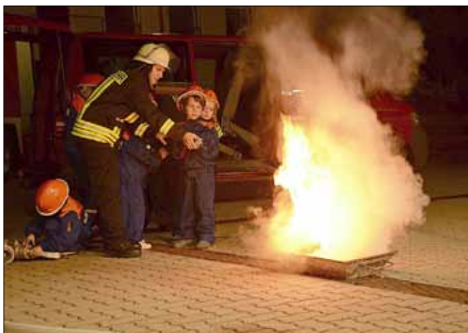
Eine Vorstellung ihres Könnens gab während des Tages der offenen Tür die Kinder- und Jugendfeuerwehr.

Den Kameraden war es im Vorfeld bewusst: Wer das Publikum erreichen will, der muss etwas bieten. Und entsprechend war ein anspruchsvolles Programm mit vielen Höhepunkten organisiert worden, das den ganzen Tag über keine Langeweile aufkommen ließ. Dank der Unterstützung der Volksbank Elsterland, der envia M, der