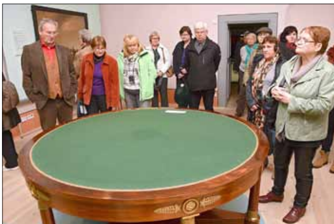
An diesem Tisch ordneten die Mächtigen Europas 1814/15 in Wien einen ganzen Kontinent neu: Er war Originalausstellungsstück in der Landesausstellung zu sehen.

Als sich schließlich Sachsens Herrscher zu Beginn des 19. Jahr-