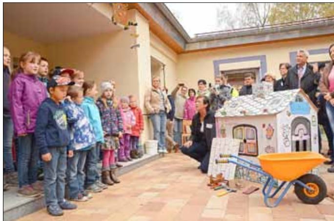
In ihrem Programm anlässlich der Wiedereröffnung griffen die Kinder noch einmal die lange Bauzeit an ihrer Kita auf.

Komplett modernisierte Einrichtung bietet den rund 90 hier betreuten Kindern nunmehr beste Bedingungen