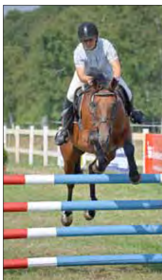
Bereits zum 11. Mal findet Anfang August das Reit- und Springturnier der Kurstadt Bad Liebenwerda auf der Reitanlage in Dobra statt.

Für das leibliche Wohl an beiden Tagen ist natürlich gesorgt. Vielleicht schauen Sie einmal in Dobra vorbei. Der Reit- und Fahrverein Dobra e. V. würde sich sehr über Ihren Besuch freuen.