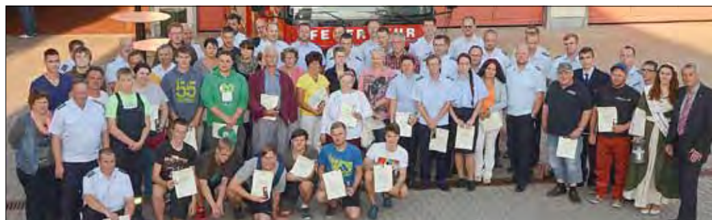
Kameraden der Freiwilligen Feuerwehr Bad Liebenwerda, zivile Fluthelfer und Helfer der Feuerwehr wurden für ihren Einsatz beim Hochwasser 2013 ausgezeichnet.

von Helfern beim Hochwasser im vergangenen Jahr zu würdigen. Insgesamt sollen im Land Brandenburg bis zu 17.000 Menschen damit ausgezeichnet werden. Neben den 45 Kameraden der Bad Liebenwerdaer Ortswehr sind 40 zivile Helfer aus Bad Liebenwerda, den Ortsteilen sowie aus anderen Kommunen für ihren Einsatz beim Hochwasser im Territorium der Stadt Bad Liebenwerda für die Hochwasser-Medaille vorgeschlagen worden. Weitere Meldungen sind noch möglich. Darüber hinaus erhalten die Kameraden der Freiwilligen Feuerwehren der Ortsteile ebenfalls Einsatzmedaillen. Diese werden in dezentralen Veranstaltungen im jeweiligen Ortsteil übergeben. KB