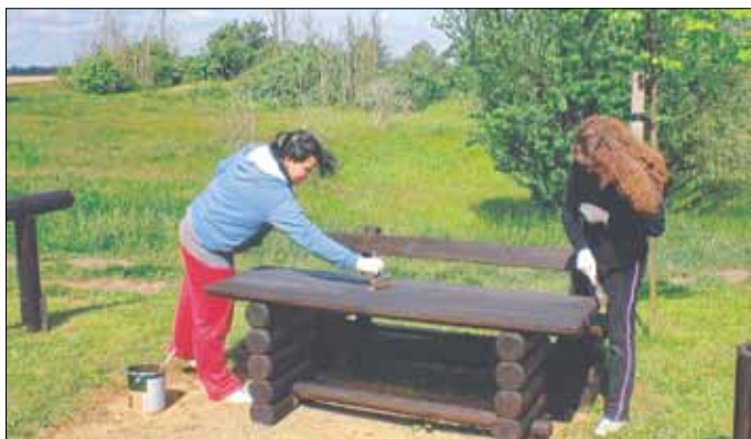
Bei der „48-h-Aktion“ packten Burxdorfer Jugendliche kräftig zu und trugen so zur Verschönerung des Ortsbildes bei.

Bereits zum vierten Mal wurde von den Burxdorfer Jugendlichen während der „48-h-Aktion“ an kommunalen Objekten kräftig Hand angelegt. Waren es in den vergangenen Jahren ein neuer Farbanstrich der Spielgeräte auf dem Spielplatz, die Säuberung der Namenstafeln am Denkmal der Kriegsoffer sowie andere Dinge, die das Ortsbild verschö-