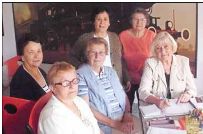
Der Vorstand der Ortsgruppe V bedankt sich bei allen, die mit ihrem Beitrag zur Listensammlung die Arbeit der Volkssolidarität unterstützen.