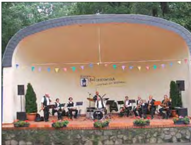
Die Welzower Blasmusikanten spielen am 27. Juli im Kurpark auf.

Die Kurkonzerte finden sonntags in der Zeit von 15 bis 17 Uhr in der Musikmuschel am Haus des Gastes der Kurstadt Bad Liebenwerda statt.