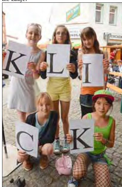
Letzte Abstimmungen vor dem Auftritt - Schüler des Grundschulzentrums kurz vor dem Betreten der Bühne. proben