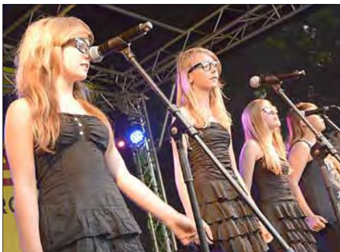
Talente des Grundschulzentrums sorgten am Samstagnachmittag für einen Besucheransturm auf dem Rossmarkt und nicht zuletzt für gute Stimmung.