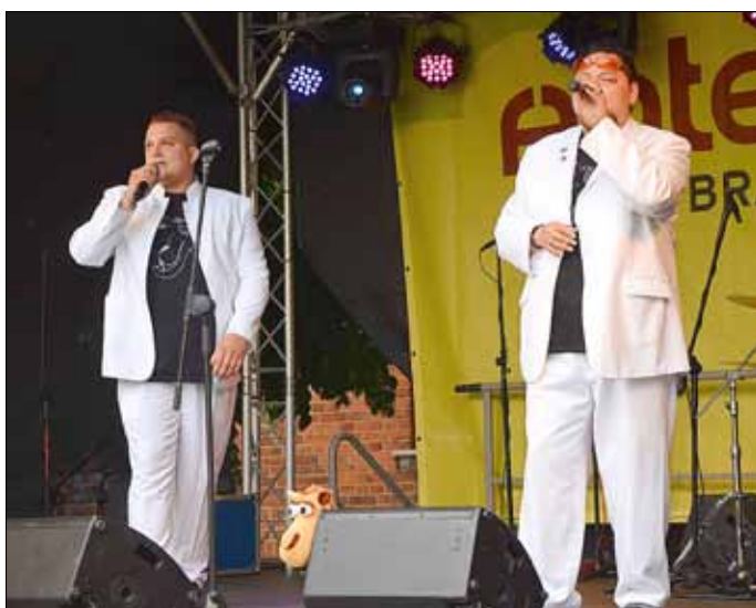
Gaben mit Stimmungsmusik den Auftakt für die Bühnenshow am Samstag: Die Wüsten Wüstensöhne.