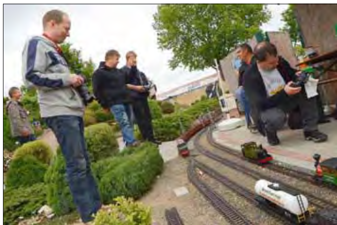
Spezialisten für Modellbahnen mit Akku-Antriebe nutzten das Gleisnetz im Maasdorfer Erlebnispark am Elsternatouream zum Experimentieren mit ihren Modelllokomotiven.

in Maasdorf. Rund 20 Gartenbahnfreunde vor allem aus Sachsen-Anhalt, aber auch aus Berlin,