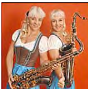
(Erleben Sie das vielseitigste Zwillingsspaar nach Alice und Ellen Kessler. Lassen Sie sich von den „Dresden-Zwillingen“ mit Gesang, Melodien auf dem Saxophon und ihrem artistischem Können verzaubern!)