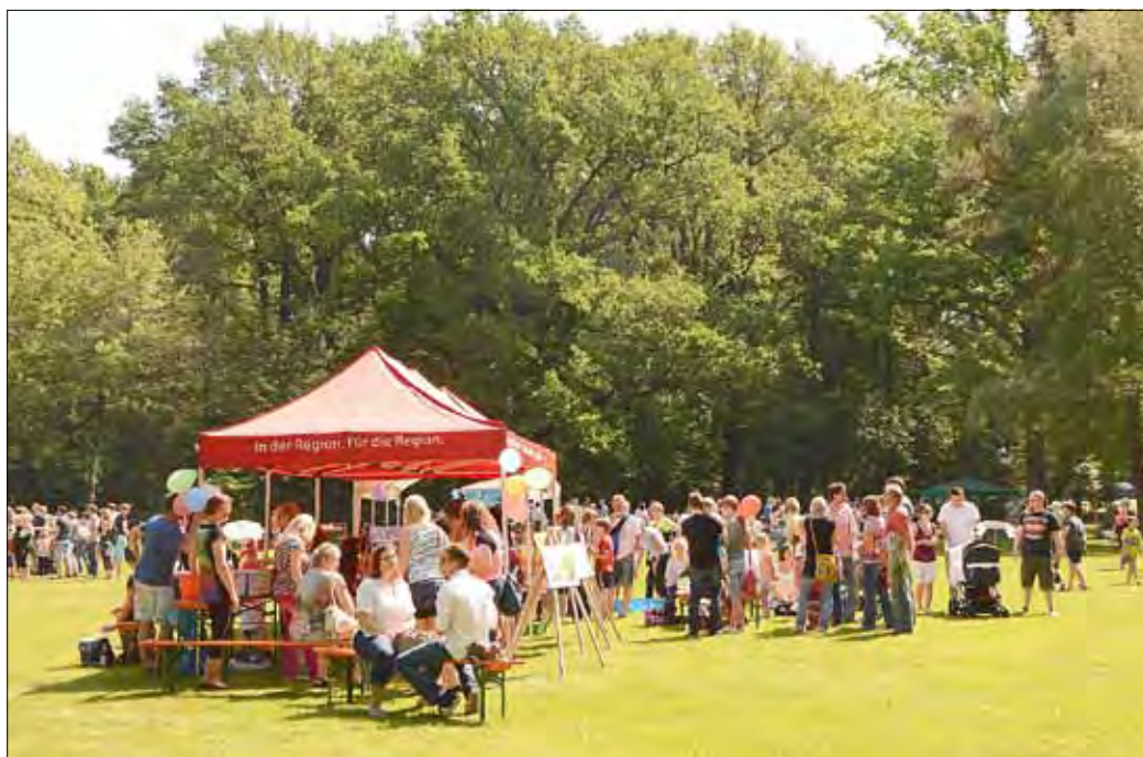
Etliche Einrichtungen und Vereine hatten im Kurpark ein Kinder- und Familienfest auf die Beine gestellt, das sich bei bestem Wetter großen Zuspruchs erfreute.

Das passt hierher: Brunnenfest und Elsterlauf haben vom 23. bis 25. Mai am neuen Veranstaltungsort in der Bad Liebenwerdaer Innenstadt ihre Premiere gegeben und Besucher und Teilnehmer durchweg überzeugt. Im Herzen der Stadt begeisterten Show, Musik und Unterhaltung bei überwiegend gutem Wetter die Festbesucher, der Elsterlauf am Festsonntag hatte nicht nur einen Teilnehmerrekord mit fast 1000 Startern zu verzeichnen, sondern