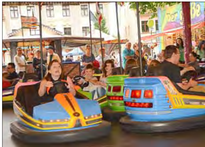
Der Markt hatte sich während des Festwochenendes in einen Schaustellerpark verwandelt.