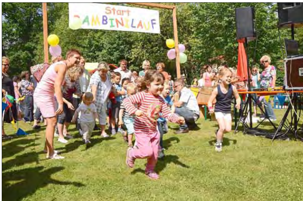
Sportlich ging es auch während des Familienfestes auf der Wäldchenwiese zu: Zahlreiche Kinder beteiligten sich dort am Bambini-Lauf, der in bewährter Weise durch die Zahnarztpraxis Damm organisiert worden war.