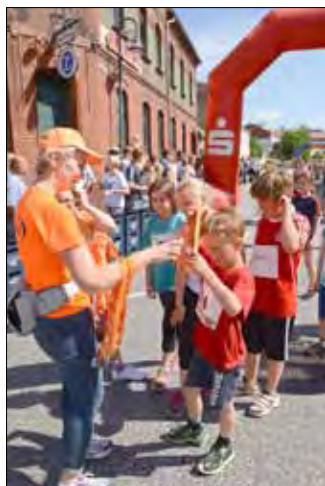
Jeder Teilnehmer des Elsterlaufes, der es ins Ziel schaffte, erhielt in diese Jahr eine Finisher-Medaille.