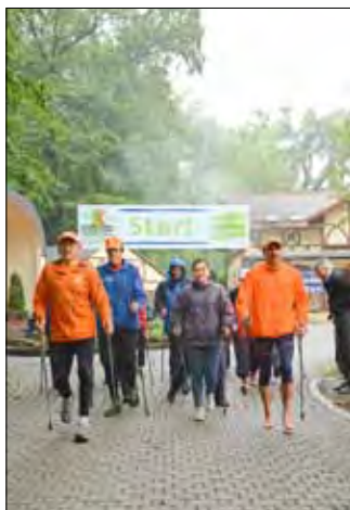
Nordic Walking durch den Regen: Insgesamt machten sich 20 Starter auf drei verschiedenen Strecken auf den Weg.