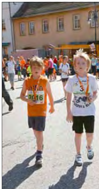
Geschafft! Der Zieleinlauf befand sich am Rossmarkt. Dort warteten bereits etliche Zuschauer auf die ankommenden Läufer.