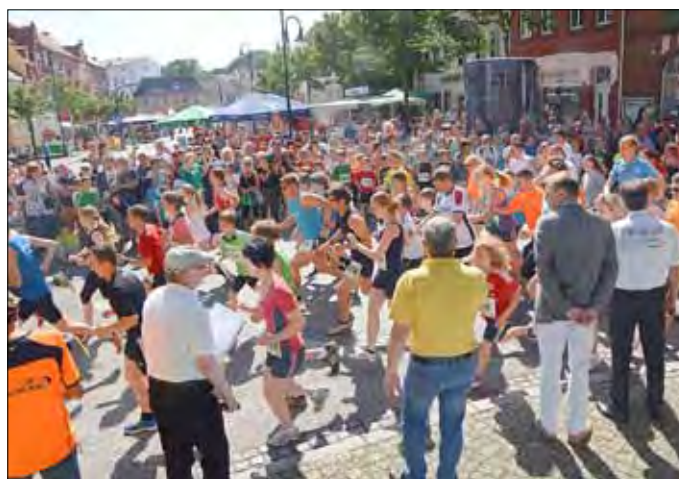
Gute Stimmung beim Start des Elsterlaufes: Zahlreiche Zuschauer umrahmten nicht nur am Beginn des Laufes die Strecke und feuerten die Läufer an., wie sich die Läufer