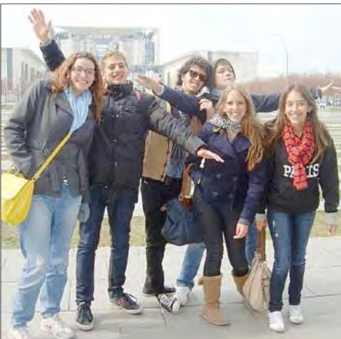
Kolumbianische Schüler suchen Gastfamilien auf Zeit in Deutschland.