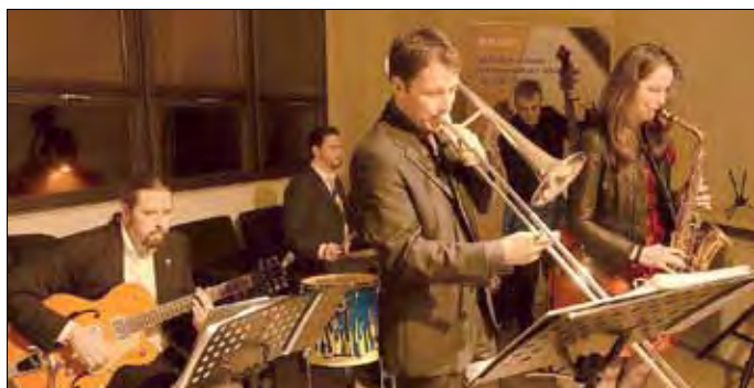
Mit schwungvollen Klängen umrahmte die Jazz-Formation der Big Band Bad Liebenwerda die Veranstaltung musikalisch.