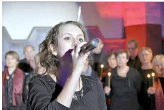
Nicht jeder kann Solo singen, aber die Mitwirkung im Gospelchor macht Freude, fördert die Stimme, hebt die Stimmung, hält gesund!