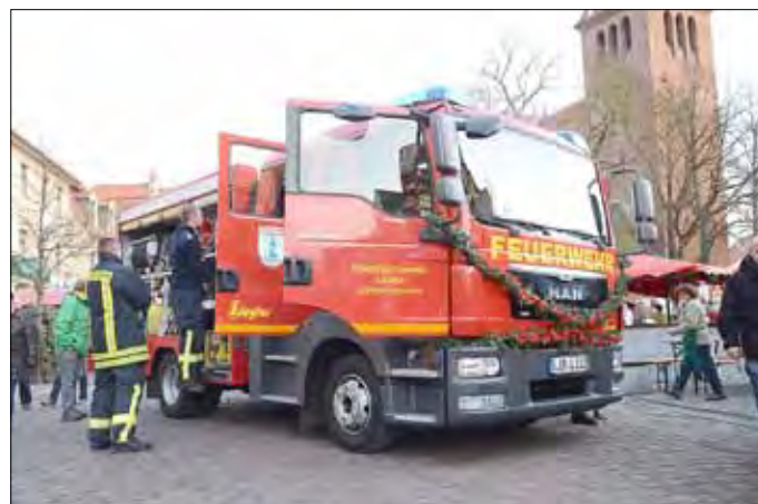
Zur Eröffnung des Weihnachtsmarktes wurde den Lausitzer Kameraden offiziell ihr neues Löschfahrzeug übergeben.