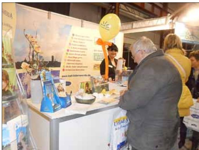
Das Haus des Gastes machte auf dem Chemnitzer Reisemarkt auf die Angebote der Kurstadt aufmerksam.

Vom 10. bis 12. Januar präsentierten sich die Kurstadt Bad Liebenwerda zum wiederholten Mal beim Chemnitzer Reisemarkt. Gemeinsam mit der Lausitztherme Wonnemar, Elbe-Elster Tours e. V. und der Stadt Uebigau-Wahrenbrück wurde den Besuchern die Reiseregion Elbe-Elster-Land in all ihrer Vielfalt vorgestellt, um die Reiselust in den Süden des Landes Brandenburg zu wecken. Druckfrisch wurde den Gästen der aktuelle Reisekatalog