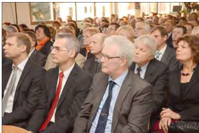
Vertreter aus Wirtschaft, Politik und Verwaltung zählten zu den Gästen des gemeinsamen Neujahrsempfangs.

Bei ihrem gemeinsamen Neujahrsempfang haben die beiden Städte des Mittelzentrums in Funktionsteilung, Elsterwerda und Bad Liebenwerda, im Ausstellungszentrum der REISS Büromöbel GmbH vor zahlreichen Gästen aus Politik, Wirtschaft, Verwaltung und Vereinen sowie der Partnerstadt Lübbecke das alte Jahr Revue passieren lassen und einen Ausblick auf die