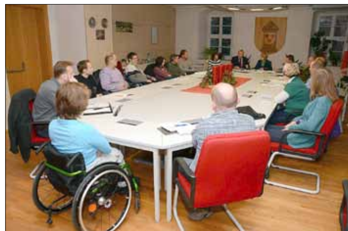
Noch im alten Jahr war im Rathaus bereits über die Gründung eines Behindertenbeirates beraten worden. Am 28. Januar wird sich das Gremium gründen.