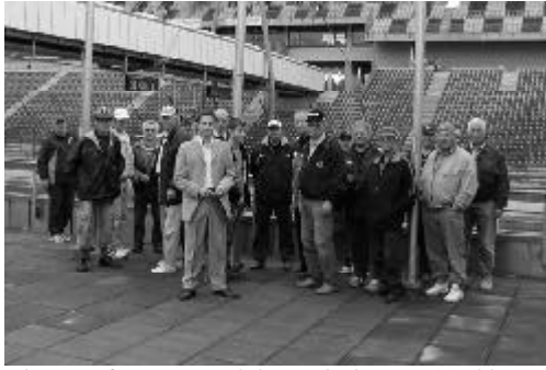
Erinnerungsfoto vom Besuch des Lausitzringes am 15.7.04