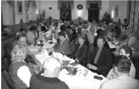
Weihnachtsfeier der Radler am 5.12.04 im Haus des Gastes Bad Liebenwerda

Bei den 8 monatlichen Sonntags-Familienfahrten, z.B. nach