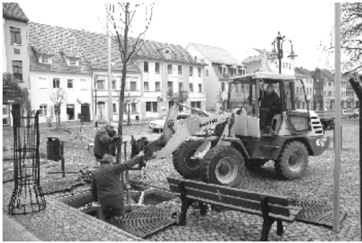
Mitte November wurden wieder Bäume vor das Rathaus gepflanzt.

Vor dem Rathaus von Bad Liebenwerda stehen seit Mitte November wieder Bäume. Mitarbeiter eines Bad Liebenwerdaer Garten- und Landschaftsbauunternehmens pflanzten sechs Linden in die dafür vorgesehenen Einlassungen im neuen Pflaster des Marktplatzes. Der Anblick des Rathauses, der jahrelang durch Bäume geprägt war, ist nun wiederhergestellt. Gefällt worden waren die alten Linden im Zuge der Marktplatzsanierung, die nun abgeschlossen ist. Zur Glühweinmeile am 2. Dezember wird der Markt um 14 Uhr feierlich übergeben.