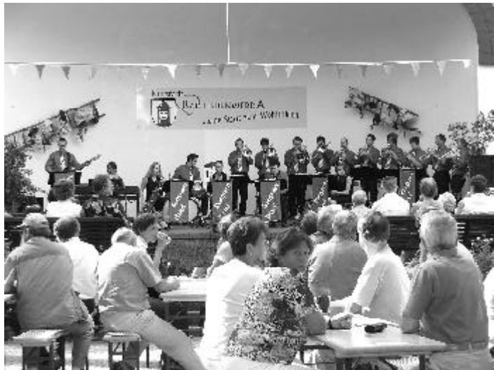
Eröffneten den Konzertreigen und lassen ihn am 2. September ausklingen: Die Evergreen-Big-Band aus Bad Liebenwerda.

Mit dem Konzert der Evergreen-Big-Band geht am Sonntag, den 2. September, die diesjährige Saison der Kurkonzerte zu Ende. Die Bad Liebenwerdaer Musiker, die bereits zur Eröffnung der Saison Anfang Mai in der Musikmuschel im Wäldchen aufspielten, werden von 15 bis 17 Uhr Swing- und Dixieland-Stücke hören lassen. Insgesamt 15 Kurkonzerte lockten in diesem Jahr wieder hunderte Konzertgäste ins Wäldchen. Mitunter verbanden sich die Auftritte der Musikensembles mit anderen Veranstaltungen, die im „Haus des Gastes“ stattfanden, etwa dem Deutschen Walkingtag oder dem Rosenfest. Bei letzterem sorgten die allseits bekannten Schlossberg-Musikanten für einen Besucherrekord: Rund 800 Besucher tummelten sich im Wäldchen, um den Klängen der Sonnewalder Formation zu lauschen. Das Team vom „Haus des Gastes“ möchte sich zum Ende der Kurkonzert-Saison bei allen Mitorganisatoren und treuen Besuchern bedanken und lädt herzlich zum Besuch des Konzertes am 2. September ein.