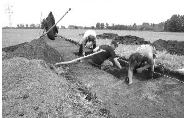
Bei einer archäologischen Voruntersuchung an der Landesstraße 66 bei Lausitz fanden sich Hinweise auf jungsteinzeitliche Siedler.

Sah es zunächst so aus, als gäbe das Areal aus archäologischer Sicht nicht viel her, brachten einige Keramikfunde die Fachleute auf die Spur. Ein besonders