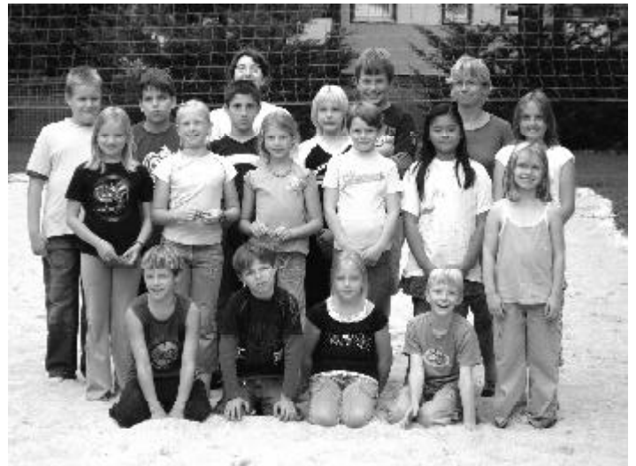
Eine tolle Woche erlebten diese Mädchen und Jungen im Ferienlager des Regenbogenhauses.

Eine tolle und erlebnisreiche Woche haben 17 Kinder aus der Region vom 6. bis 10. August im Regenbogenhaus verbracht. Erstmals wurde das auf eine Woche verkürzte Ferienlager der Kinder- und Jugendfreizeiteinrichtung nicht in Zeischa, sondern direkt im Regenbogenhaus in der Heinrich-Heine-Straße durchgeführt. Dieser „Test“ ist gelungen, wahrscheinlich wird es im kommenden Jahr erneut ein Ferienlager im Regenbogenhaus geben. Erlebt haben die Jungen und Mädchen im Alter von acht bis zwölf Jahren so einiges: eine Kahnfahrt in Wahrenbrück, Besuche im Wonnemar und im Elster-Natourem, Wanderungen durch die Natur und in der Nacht, grillen, Sport und Spiele. Die nächste Veranstaltung der Kinder- und Jugendeinrichtung „Regenbogen“ findet am 8. September statt. An diesem Tag richtet das Regenbogenhaus am Maasdorfer Sportplatz ein Fußballturnier der Jugendclubs aus, bei dem Mannschaften aus der Region gegeneinander antreten. Zuschauer sind herzlich eingeladen.