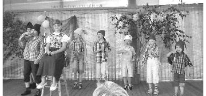
Bei der Playback-Show kam im Festzelt Stimmung auf.

Unter diesem Motto stand das diesjährige Dorffest vom 22.-24. Juni in Burxdorf. Los ging es am Freitag gegen 20 Uhr, nach einem kleinen Regenguss, mit einem musikalischen Fackelumzug unter Begleitung des Musikvereins Fichtenberg e.V. durch das festlich geschmückte Dorf. Im Anschluss daran folgte ein beschwingender Tanzabend. Am Samstag war uns Petrus mit angenehmeren Temperaturen hold gestimmt und der Tag hatte es mit seinem Programm in sich. Für die Kleinen gab es neben einer Hüpfburg und einer Kletterstange viel Spiel und Spaß rund um den Fest- und Spielplatz.