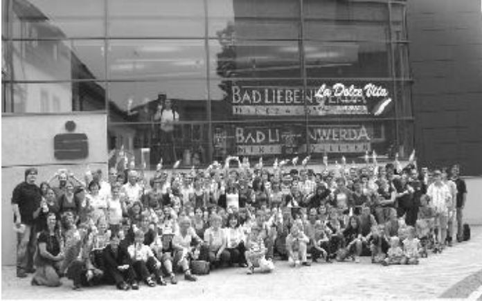
Teilnehmer der Musikwoche posieren vor einem „Bunten Abend“ im Bürgerhaus mit Mineralwasserflaschen der Mineralquellen Bad Liebenwerda fürs Foto.

Am Ende gab es nur noch eines: Begeisterung. Und die äußerte sich nicht allein in Form von stehenden Ovationen beim Abschlusskonzert am 12. August in der Nikolai-Kirche von Bad Liebenwerda. Die 38. Chor- und Instrumentalwoche der Evangelisch-Lutherischen Landeskirche Sachsens, die vom 3. bis 12. August in Bad Liebenwerda und damit erstmals in Brandenburg stattfand, hat Publikum, Teilnehmer, Organisatoren und Gastgeber gleichermaßen in Euphorie versetzt.