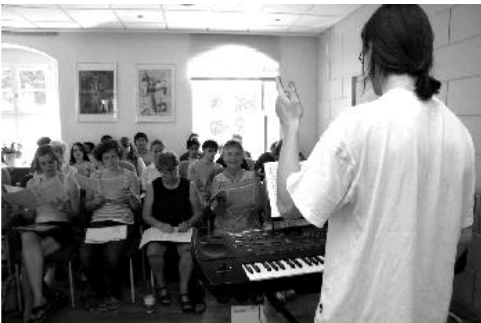
Chorproben im Sitzungssaal des Rathauses: Die Stadt unterstützte die Musikwoche in hohem Maße.

Schließlich galt es, innerhalb einer Woche ein musikalisches Mammutpro-