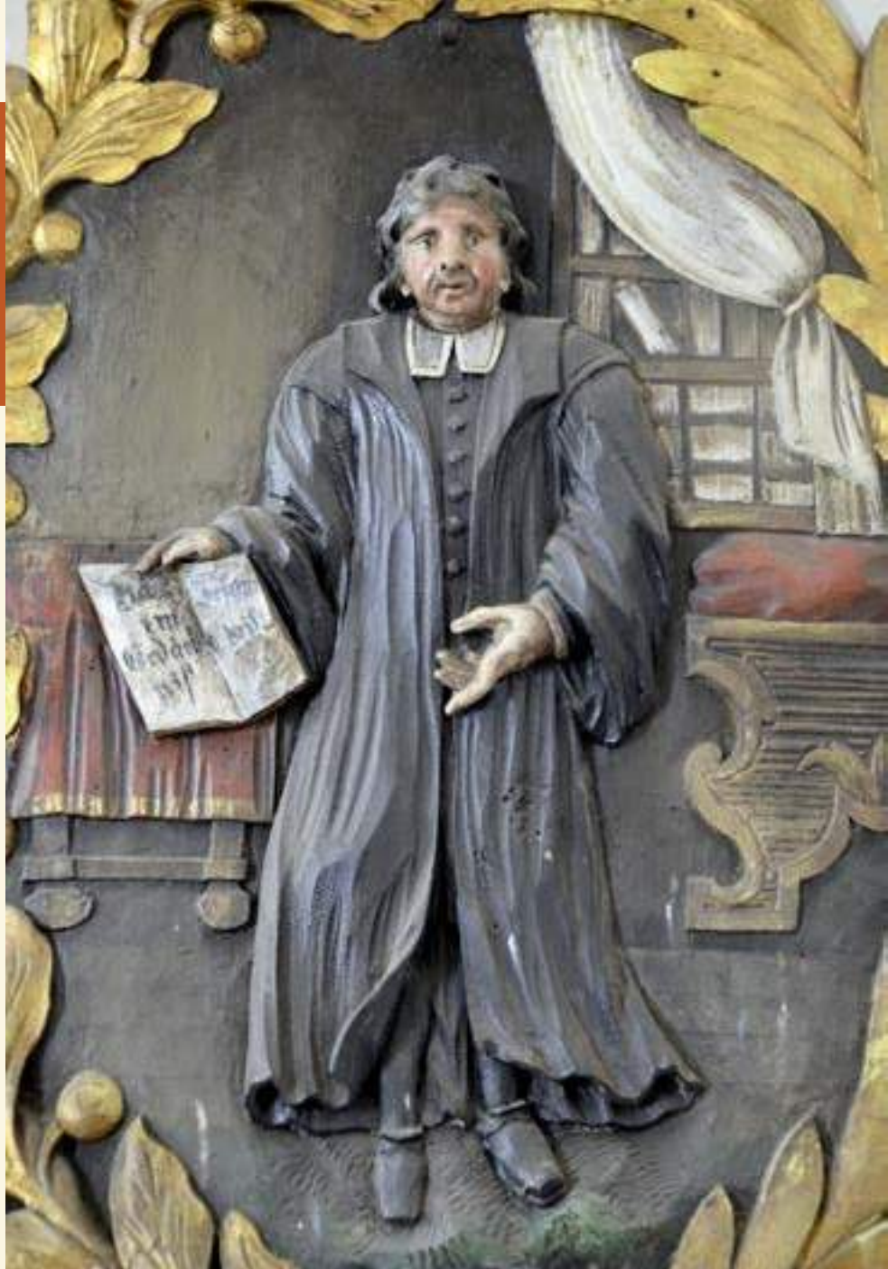
Lutherdarstellung am Kanzelkorb der Dorfkirche Löwenbruch (Teltow-Fläming)

In den evangelischen Ländern wurde mit der Darstellung Luthers der Übergang zur neuen Lehre bekräftigt und damit die Abgrenzung zum alten katholischen Glauben dokumentiert. In der Mark Brandenburg verdeutlicht dies beispielsweise das Konfessionsbild (2. Hälfte 16. Jh.) in der Kirchhainer Marienkirche. Aus der Vogelperspektive erblickt man Luther und Melancthon am Altar, wie sie dem Kurfürsten und seiner Gemahlin das Abendmahl in beiderlei Gestalt in Anwesenheit des Hofes reichen.