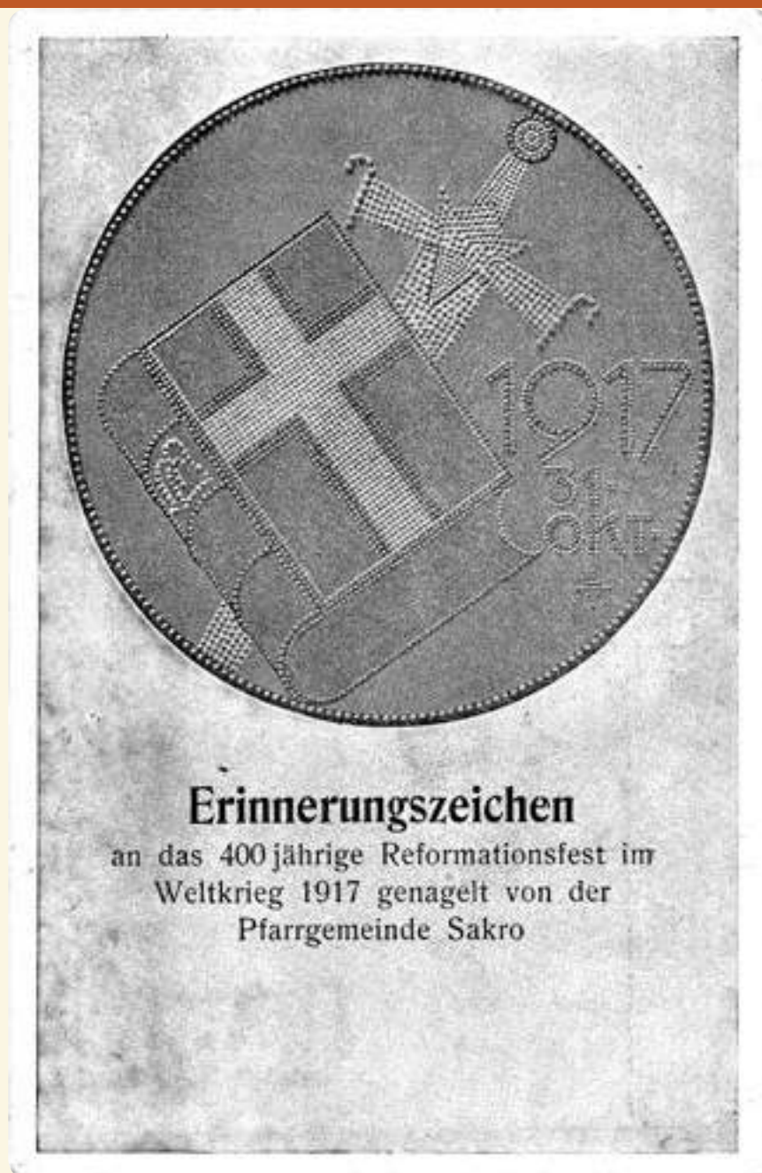
Historische Postkarte; Sammlung Frank Henschel

Genagelt wurde auf hölzerner Unterlage. Vorgebohrte Löcher markierten die Kriegswahrzeichen, die auf Nagelbildern dargestellt werden sollten: neben dem Eisernen Kreuz als häufigstem Motiv das deutsche Schwert, Wehrmänner, Adler, Soldaten, Gra-