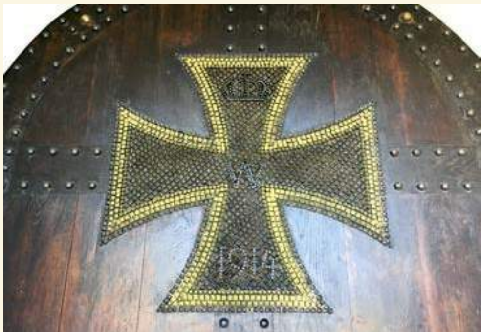
Kriegsnagelung (Eisernes Kreuz) am Portal der Kirche St. Marien auf dem Berge in Boitzburg (Uckermark); Foto: Martin Zobel

In Sacro ist man offen im Umgang mit der Vergangenheit und offen für die Gegenwart. Und das nicht nur im übertragenen Sinne: Zwei der Dorfkirchen, die Pfarrer Trummer in Forst-Nord betreut – Sacro und Eulo – öffnen von April bis Oktober täglich von 8 bis 18 Uhr ihre Türen. Für die anderen drei in Naundorf, Mulknitz und Horno verwalten die Kirchenältesten die Schlüssel und empfangen gern Besucher. —