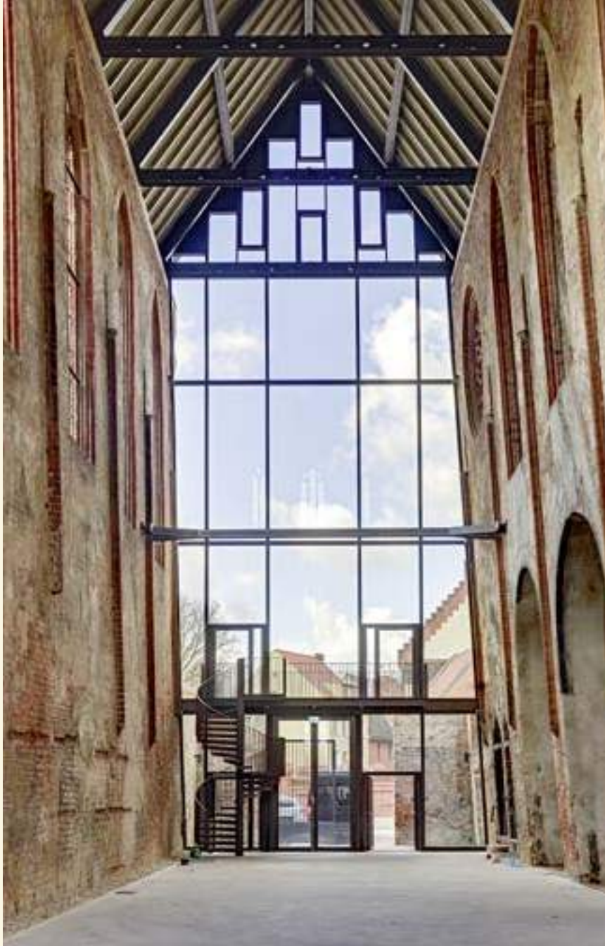
Innenraum nach Westen; Foto: Stefan Melchior

Anders als das Kirchenschiff, das die Spuren erlittener Verletzungen bewusst zur Schau stellt, blieb das niedrige nördliche Seitenschiff in seiner mittelalterlichen Form von den Kriegszerstörungen relativ verschont. Seit die einst zugemauerten Bögen zwischen Haupt- und Nebenschiff wieder geöffnet sind, lässt sich an diesem Raum mit seinem erhaltenen Kreuzgewölbe ablesen, wie sich einst die gesamte Kirche in ihrer gotischen Schönheit präsentierte.