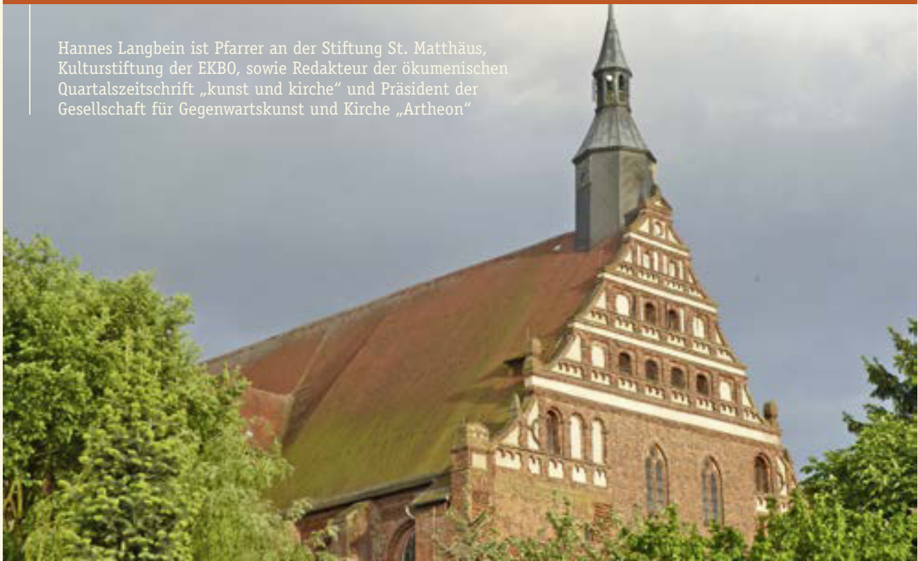
Die „Wunderblutkirche“ in Bad Wilsnack