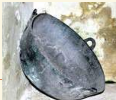
Gusseiserner Kessel, wohl 16. Jh., Wunderblutkirche Bad Wilsnack. Vermutlich verbrannte Joachim Ellefeld am 28. Mai 1552 in diesem Kessel die Wunderhostien; Foto: Hartmut Kühne