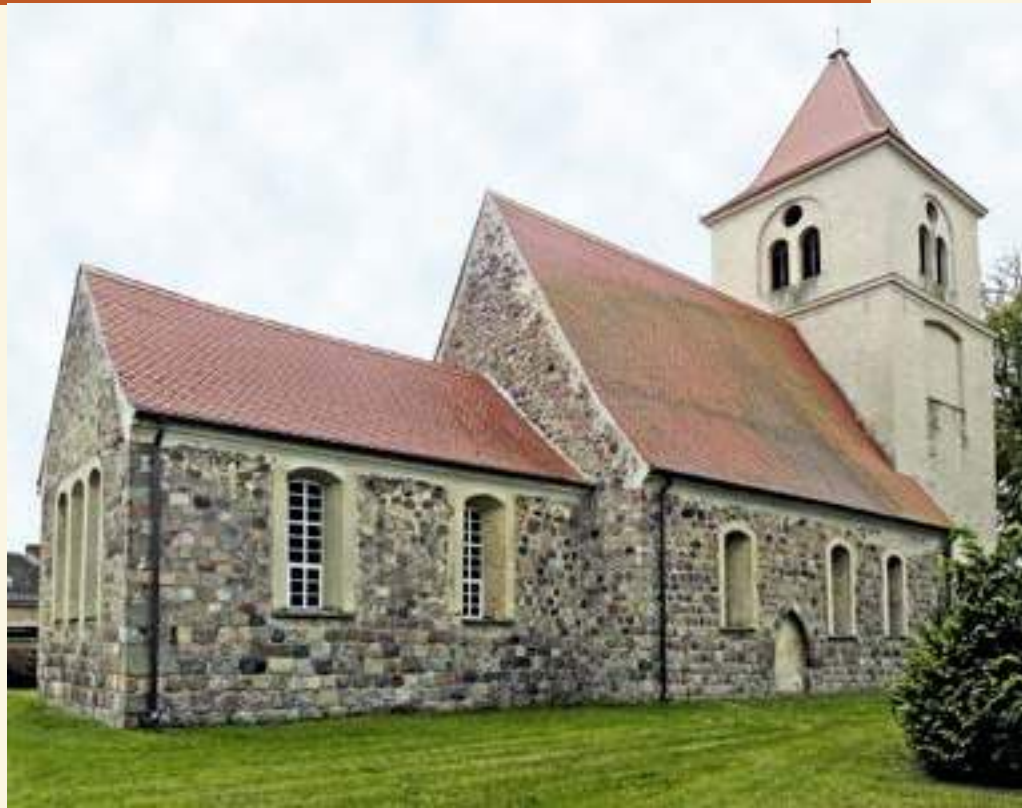
Dorfkirche Biegen (Oder-Spree) von Norden

Da die Gläubigen ihre Messen im Mittelalter in der Gemeinschaft der Heiligen feierten, brachten sie dies in vielgestaltigen Wandmalereien zum Ausdruck. Und während in manchen Dorfkirchen Brandenburgs in den letzten Jahren selbst kaum noch sichtbare Fragmente mit großem konservatorischem Aufwand gesichert werden, findet man in Biegen im Chor etliche gut erkennbare Motive, wie Christus als Weltenrichter in der Mandorla, zwei weibliche Heilige neben Andreas, unter dessen Patrozinium diese Kirche steht, außerdem Szenen der Passion: Abendmahl, Judaskuss und Gefangennahme Jesu sowie Weihekreuze und Wappen, ornamentale Schmuckbänder und florale Girlanden. Auch den vom Kirchenschiff abgesetzten Triumphbogen ziert reiches Dekor, ein Posaunenengel hebt sich deutlich ab, und bei genauer Betrachtung ist eine kleine Kirche ohne Turm auszumachen. Da im nahen Frankfurt Ende des 14. Jahrhunderts ein Kartäuserinnenkloster gegründet worden war, das später auch in Biegen über Landbesitz verfügte, mag diese Malerei auf eine Verbundenheit mit den Schwestern des Klosters hinweisen.