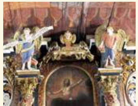
Klitzschena, Holzdecke über dem Altar

Im Rahmen von Untersuchungen zum Einfluss reformatorischer Malerei auf die Kirchen der näheren und weiteren Umgebung besuchte der Verfasser in den vergangenen Jahren zahlreiche Kirchen im Wittenberger Gebiet und im Fläming. Dabei konnte festgestellt werden, dass es mit Ausnahme des direkten Wirkens der Cranach-Werkstatt (z. B. in Kemberg und Dessau) von der Mitte des 16. bis zur Mitte des 18. Jahrhunderts fast keine Ausstrahlung evangelischer Bildprogramme in die Kirchen der Region gab. Altäre, Kanzeln, Epitaphien und Emporen sind dagegen mit Bildwerken nach Vorlagen flämischer und niederländischer Druckgrafik geschmückt. Wohl die einzige Ausnahme ist der in der 2. Hälfte des 17. Jahrhunderts wirkende Wittenberger Maler Johann Amberger, der in Schleeßen das Abendmahlsgemälde Cranachs mit dem am Tisch sitzenden Martin Luther vom Reformationsaltar der Stadtkirche Wittenberg kopierte.