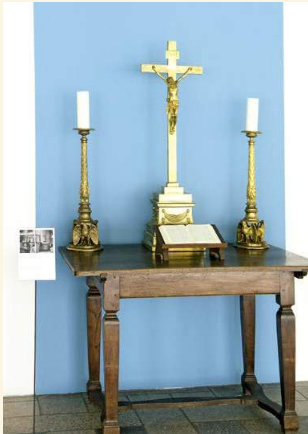
Original erhaltener Altartisch, Kreuzifix und Leuchterpaar, nach Entwurf Schinkels für die Unionsfeier in der Garnisonkirche angefertigt und schon 1814 aufgestellt

heben. Das verleiht dem Reformationsgedenken eine innere Spannung, die nicht aufgehoben, sondern nur ausgehalten werden kann. Im Gedenkjahr 2017 die Gemeinsamkeiten zwischen den Konfessionen herauszustellen, nicht das Trennende, in der Hoffnung, auf dem Weg zur Einheit weiter voranzukommen – das ist die Herausforderung, vor der wir stehen. Was daraus wird, liegt nicht allein in unserer Hand. —