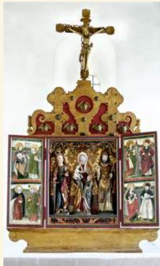
Das restaurierte Altarretabel aus der Dorfkirche Fredersdorf (Uckermark); Foto: Thoralf Herschel

Von 1978 bis 1997 befanden sich die Seitenflügel in der kirchlichen Werkstatt in (Ost-)Berlin und kamen unfertig zurück. Die braune Ölfarbe war entfernt worden, so dass die Malereien wieder zutage traten. Der Rahmen hatte einen vorläufigen weißen Anstrich erhalten. Doch bald lösten sich an den Rändern Farbteile und eine umfassende Restaurierung wurde immer dringlicher. Nach einem Anstoß zur Restaurierung 2010, der Unterstützung des Förderkreises Alte Kirchen und dem Vorhaben der Beteiligung an einer Ausstellung in Potsdam 2011/12 flossen Fördermittel für die erste Stufe der Restaurierung der Seitenflügel und der Konservierung des Mittelschreins. Nun wurde der kunsthistorische Wert immer deutlicher. Nach Ende der Ausstellung 2012 kehrte das Kunstwerk nach Fredersdorf zurück, aber es schien undenkbar, dass in einer zweiten Phase der bedeutendere Mittelteil mit den Plastiken restauriert werden könnte. Jedoch kamen Spenden zusammen, die Kommune Zichow unterstützte das Vorhaben und die Stiftung Preussisches Kulturerbe stellte eine große Summe bereit, so dass das Undenkbare Realität wurde: Die zweite Stufe der völligen Instandsetzung 2015/16. In mühsamer Kleinarbeit haben die Restauratoren spätere Farb-