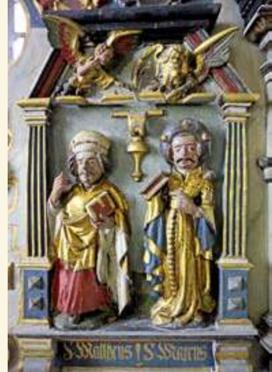
Gotische Heiligenfiguren, zu Evangelisten umgestaltet: Matthäus und Markus

Die nächste größere Renovierung ist ebenfalls am Altar vermerkt: „Secunda vice Renovatu 1739 F.W. Janssen“. Zu diesem Zeitpunkt hatten die katastrophalen Folgen des Dreißigjährigen Krieges dazu geführt, dass die Herren von Bredow in wirtschaftliche Turbulenzen gerieten und das kirchliche Patronat abgeben mussten. Börnicke gehörte ab 1652 zum Amt Oranienburg. Im 18. Jahrhundert teilten die in Klein Ziethen, Groß Ziethen, Staffelde und Flatow ansässigen Adligen sowie eine bürgerliche Familie aus Nauen das kirchliche Patronat in Börnicke mit dem König. Bei der Renovierung 1739 und der Überarbeitung des Wappenfrieses bewahrten die Beteiligten die Erinnerung an das Patronat der Familie von Bredow. Dabei wurden jedoch die Wappen der Stifterfamilie von Bredow und der Ehefrauen willkürlich am Altar angeordnet. Für uns scheinbar zusammenhanglos haben sich die neuen Patronatsherren mit ihren Wappen in den Fries am Altar eingefügt. Einzig an dem heutigen Wappen der Familie von Redern konnte das darunterliegende Wappen vollständig identifiziert werden. Es handelt sich um das Wappen der Bülows, eine Familie, die in der Mitte des 16. Jahrhunderts mit der Familie von Bredow verbunden war. Der Altar erhielt damals seine heute noch sichtbare graue Marmorierung. Im 19. Jahrhundert klagte man mehrfach über den schlechten Zustand des Altares, der völlig vom Wurm zerfressen werde. Allerdings reichten 1867 fünf Taler aus, um die Altarwand aufzufrischen. 1932 ließ