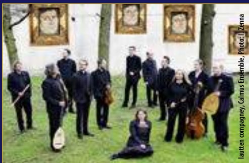
lauten compagney, Calmus Ensemble, Photo: J. Zenna

Alle Musikveranstaltungen der Kulturfeste im Land Brandenburg zum Reformationsjubiläum werden in unserer Jahresbroschüre und einem Reformationsmusikfaltblatt vorgestellt.