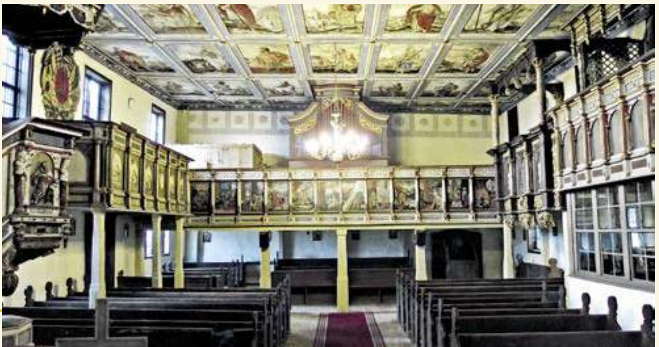
Innenraum nach Westen

Das schlichte und äußerlich unauffällige Kirchengebäude in Klemzig lässt keineswegs auf das umfassende und facettenreiche theologische Programm der üppigen Ausstattung in Wort und Bild schließen. Zweifellos handelt es sich hierbei um eines der wichtigsten Beispiele der Sakralarchitektur auf dem Gebiet der Neumark. Es bleibt zu hoffen, dass diesem Kunstdenkmal in der Zukunft eine erschöpfende Monographie gewidmet wird, die seinem Reichtum an reformatorischer Bildgestaltung und Ikonographie Rechnung trägt. —