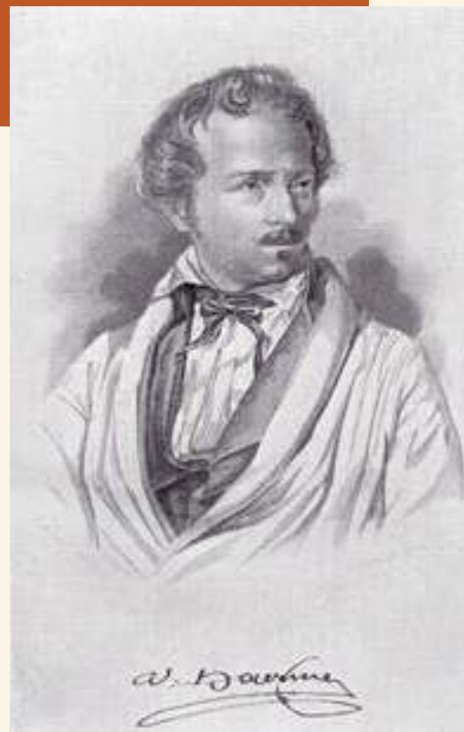
Jugendbild des Schriftstellers Willibald Alexis

In seinen Romanen verbindet Alexis historische Ereignisse mit fiktiven Handlungen; reale Personen der Zeit mischen sich unter die erfundenen Figuren der jeweiligen Erzählung. Der Roman „Die Hosen des Herrn von Bredow“ von 1846 (sein heute noch bekanntestes Werk; 1973 von der DEFA mit Rolf Hoppe in der Rolle des Ritters Götz von Bredow verfilmt) spielt zu Beginn des sechzehnten Jahrhunderts, wenige Jahre vor dem Auftreten Luthers und dem Beginn der Reformation, auf der fiktiven Burg Hohen-Ziatz im Hohen Fläming. Geschildert wird eine Verschwörung des um seine Pri-