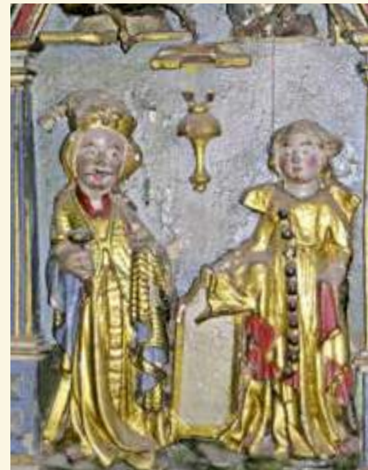
Evangelisten Lukas und Johannes