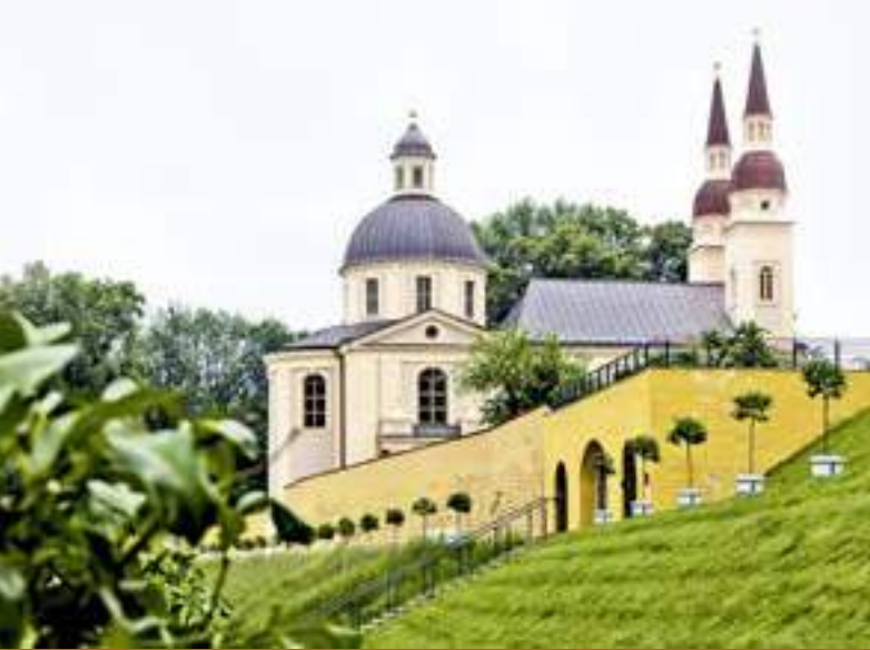
Evangelische Pfarrkirche Zum Heiligen Kreuz in Neuzelle (LOS), ehemalige „Leutekirche“ des Klosters