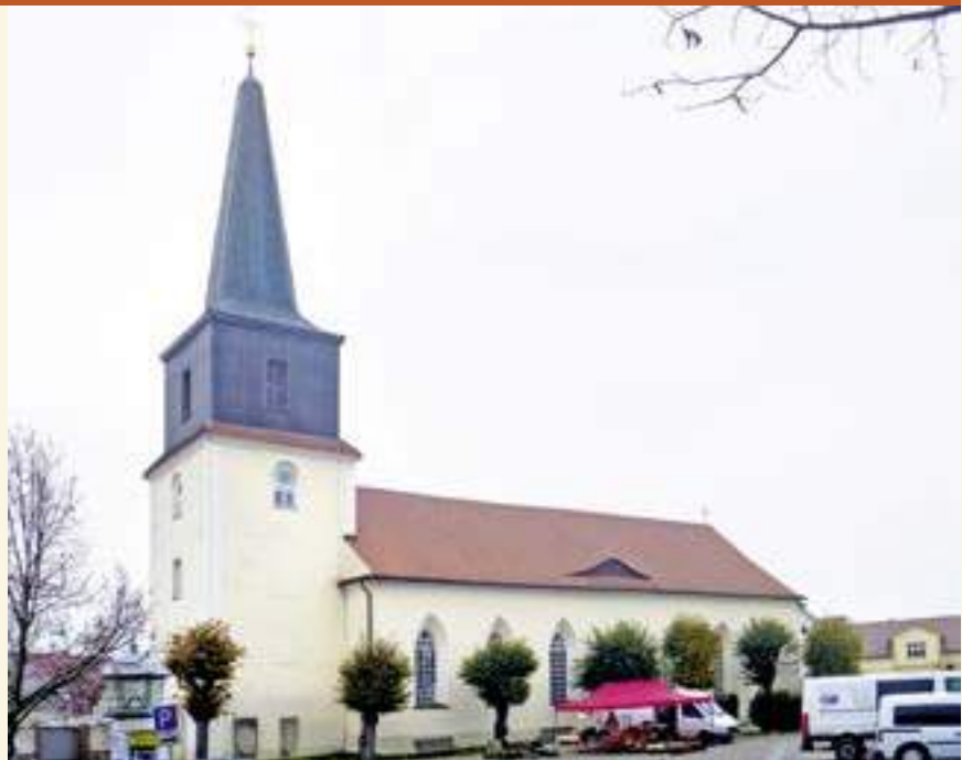
Die Kirche zu Friedland 2016