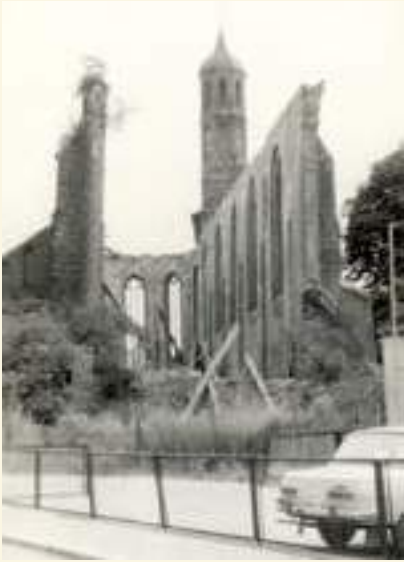
Johanniskirche nach der Kriegszerstörung

oben am Turm. Für die hatte ein alter Brandenburger, der zu DDR-Zeiten seine Heimatstadt verlassen hatte, anlässlich seines 80. Geburtstages gesammelt. Noch war die Kirche eine Ruine, aber die Uhrzeiger sollten schon in eine bessere Zukunft weisen.