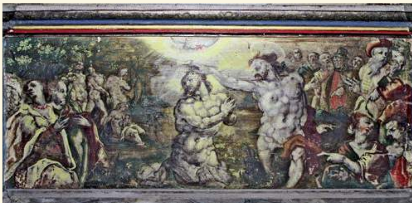
Darstellung der Taufe Christi in der Predella; Foto: Annett Xenia Schulz

Nur noch die Befestigungslöcher der Nägel künden von dem Heiligen Georg und seinem Drachen, die auf dem Foto aus den 1930er Jahren im oberen Geschoss des Altares den gekreuzigten Jesus flankieren, verbunden durch die darüber befindliche Inschrift, die auf das Bild von der ehernen Schlange Bezug nimmt: „Gleich wie Moyses in der Wüsten eine Schlange...“. Die Darstellung