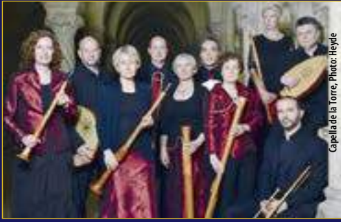
Capella de la Torre