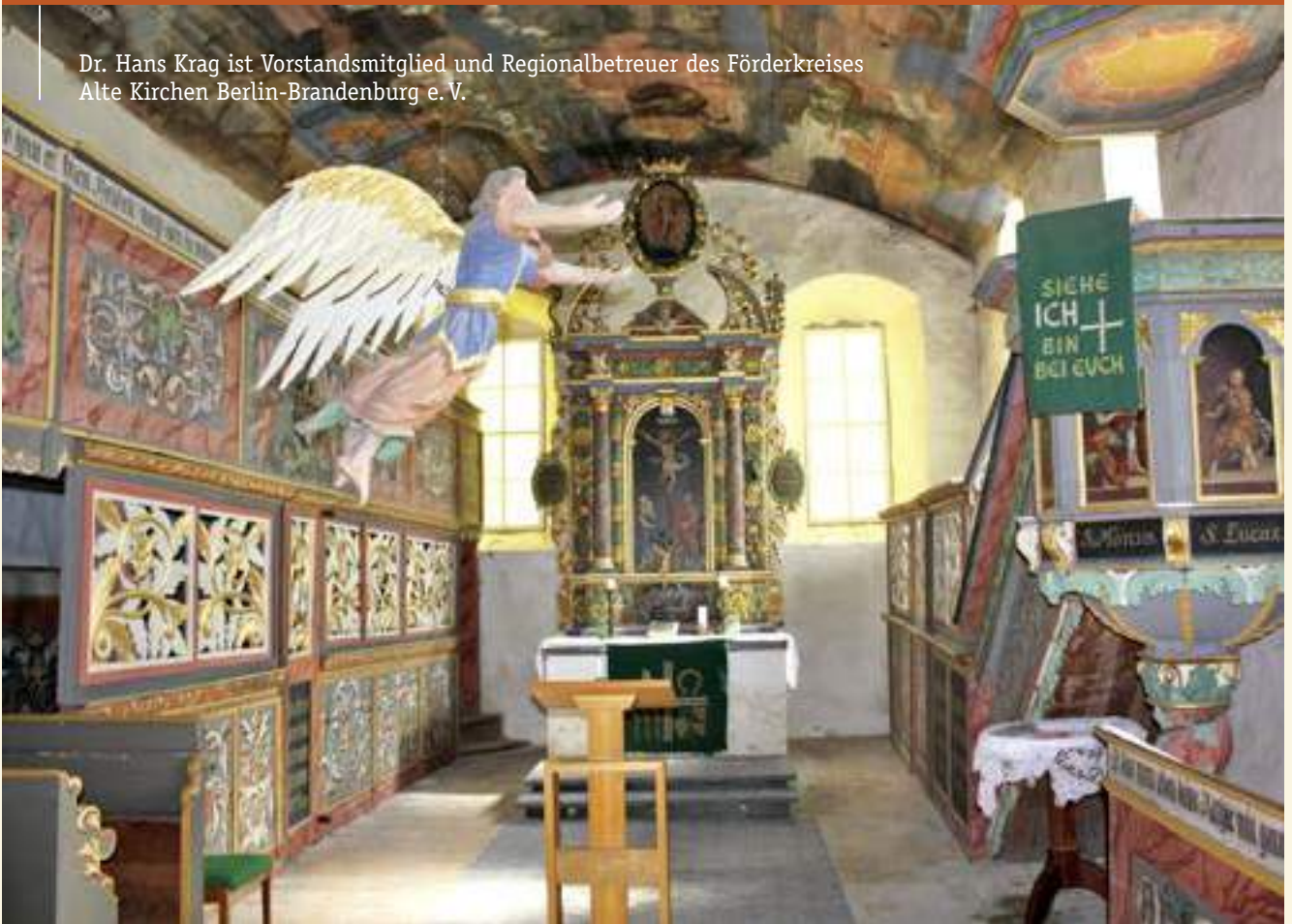
Dorfkirche Waltersdorf (Teltow-Fläming), Blick in den Altarraum

Dr. Hans Krag ist Vorstandsmitglied und Regionalbetreuer des Förderkreises Alte Kirchen Berlin-Brandenburg e. V.