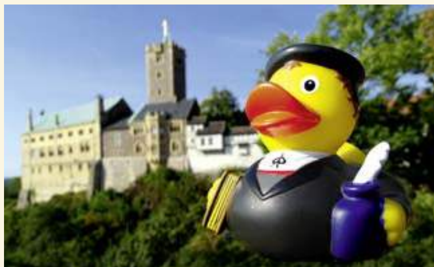
Souvenir zum 500. Reformations-Jubiläum