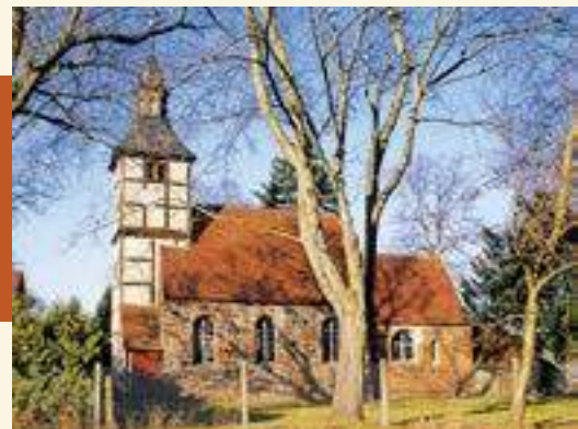
Dorfkirche Schilde von Süden