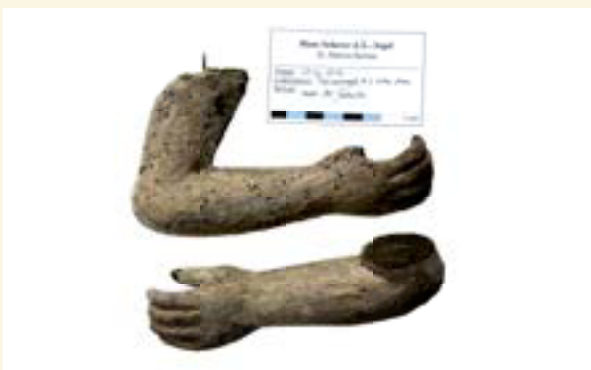
Paukenengel und Hände zum Halten der Schlagstöcke; Fotos: Dirk Zacharias

W enn am 31. Oktober 2017 zum Abschluss der Reformationsdekade in der Bernauer Marienkirche die unter Mithilfe einer erfolgreichen Spendenaktion des Förderkreises Alte Kirchen restaurierten Engelfiguren, geschnitzten Holzpfeifen und Schmuckteile der Schererorgel von 1572/73 aufgestellt zu betrachten sein werden, lässt sich tief in die Zeitschichten blicken.