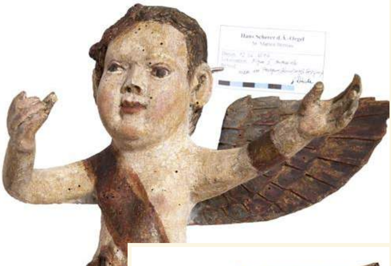
Restaurierter Kinderengel, Flügel