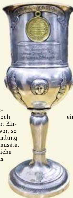
Der Lunower Abendmahlskelch von 1812 mit dem goldenen preußischen Zivil-Ehrenzeichen

„Vor vielen Jahren lebte in Lunow ein Bauer namens Jakob Bertram, genannt ‚Pfälzer-Jakob‘, dessen Wirtschaft zu den besten im Dorfe gehörte. Auch das Glück war der Familie hold und es wuchsen ein Sohn und eine Tochter heran, die ihre Eltern hilfreich unterstützten. Doch die glückliche Zeit endete, als Sohn Martin 20 Jahre alt wurde und die Mutter plötzlich an einer bösen Seuche verstarb. Auch den Vater traf die Seuche schwer. Er überlebte mit Mühe das Krankenlager, aber die einstige Kraft war dahin.