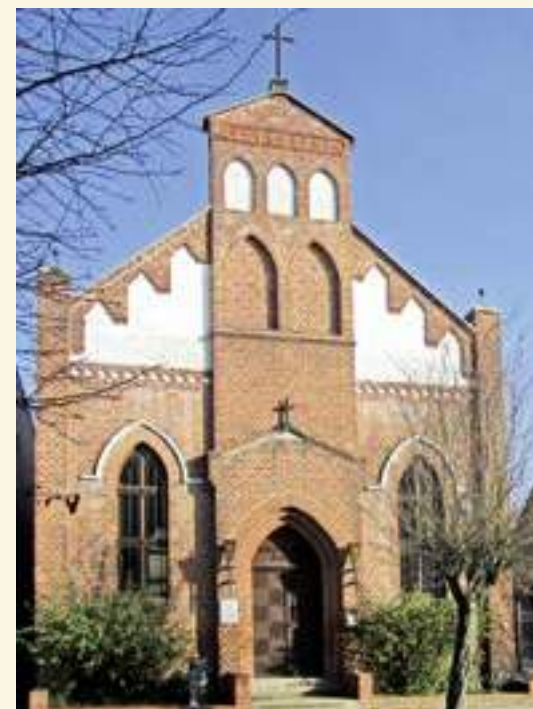
Ehemalige altlutherische Kirche in Brüssow

Auch im uckermärkischen Brüssow, etwa 50 Kilometer weiter nördlich, wurde 1859 eine altlutherische Kirche errichtet, ein Backsteinbau innerhalb der Straßenfront mit reich verziertem Giebel und einem turmartig erhöhten Mittelrisalit. Aus dem Städtchen Brüssow machten sich besonders viele Lutheraner, die mit der Union haderten, auf den Weg in die Neue Welt. Vielleicht war dies der Grund dafür, dass die schrumpfende Gemeinde ihr Gotteshaus bereits 1914 an den örtlichen Apotheker verkaufte, der es als Lageraum nutzte. Seit einigen Jahrzehnten ist in dem inzwischen der Stadt gehörenden ehemaligen Kirchengebäude ein Heimatmuseum untergebracht. Regelmäßig kommen Besucher aus den USA, die auf der Suche nach Spuren ihrer uckermärkischen Ahnen sind. Diese folgten damals den aufrüttelnden Predigten von Pastor Ehrenström und vielleicht einem Banner, das noch heute im Brüssower Heimatmuseum zu sehen ist. Es trägt die Aufschrift: Nach Amerika, ins Land der Freiheit! —