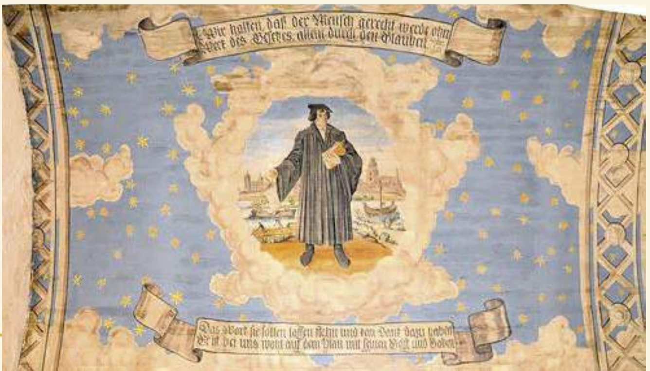
Deckengemälde in der Stadtpfarrkirche St. Marien Kirhhain

Luthers theologischer Standpunkt basierte auf der Bibel als einzigem kritischem Maßstab, sola scriptura . Er schrieb: „Die Beziehung zur Gegenwart trägt zum Verständnis des Textes außerordentlich viel bei. ... Meine Pflicht ist, auszusprechen, was ich an Unrecht – auch bei Höheren – geschehen sehe.“ —