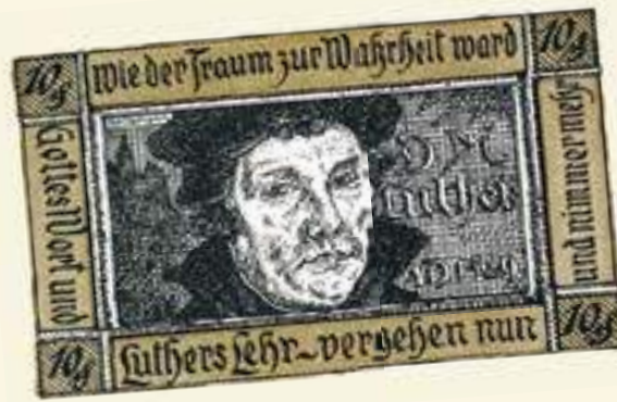
Notgeld der Stadt Herzberg 1921

Neben den prominent sichtbaren Denkmälern oder Bildnissen gibt es in vielen Kirchen Brandenburgs gemalte