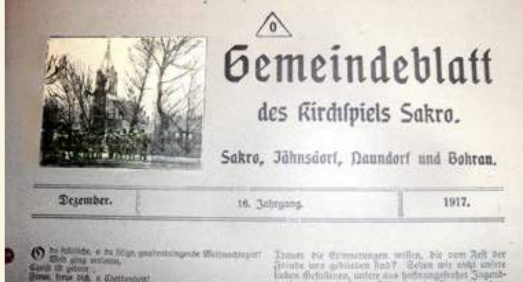
Gemeindeblatt der Kirchengemeinde Sacro, Dezember 1917