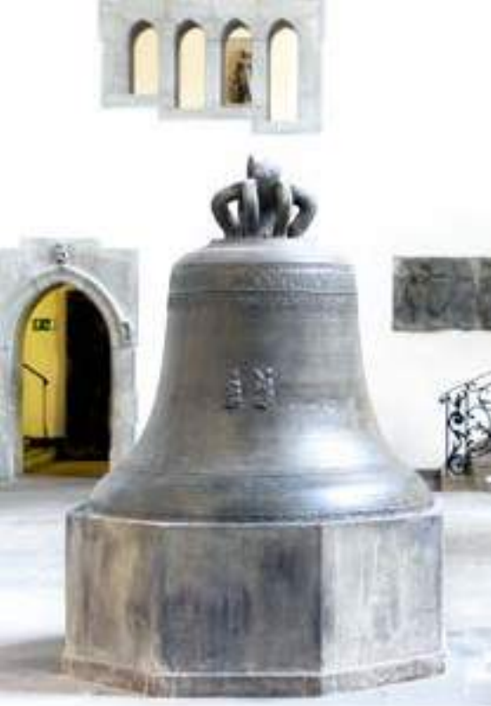
Glocke der Wallfahrtskirche zum Heiligen Blut, Bad Wilsnack (Prignitz), unbekannter Gießer 1471; Foto: Stiftung Stadtmuseum Berlin, Reproduktion: Michael Setzpfandt

Lebenswirklichkeit der Menschen im 16. Jahrhundert. Sie stellt in vergleichender Perspektive die Mark und das Herzogtum Preußen gegenüber, das erste evangelische Territorium Europas, das 1618 durch Erbfall an Kurbrandenburg fiel. Obwohl die Reformation in den beiden Territorien sehr verschieden, ja in Vielem geradezu gegensätzlich verlief, stand das Freiheitsthema gleichermaßen im Zentrum von Kirche, Gesellschaft und Politik. Dabei war es untrennbar mit den religiösen Anliegen Luthers verwoben. Die Exponate der Potsdamer Schau erzählen Geschichten von den Sehnsüchten, Schicksalen und Fragen, die die Menschen in Preußen und Brandenburg mit Reformation und Freiheit verbanden.