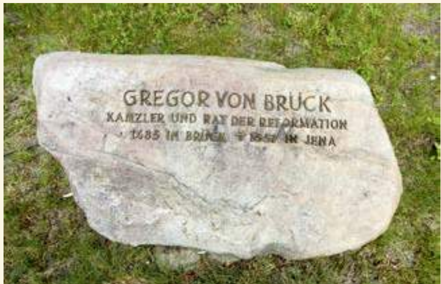
Gedenkstein für den Reformator und sächsischen Kanzler Gregor von Brück vor der Stadtkirche in Brück

Zurück zum Europaradweg R1 bis nach Klein Marzehns. Von hier führt der Weg über die L 84 und die K 6932 zum letzten Abstecher, nach Garrey im Hohen Fläming. Auf dem erhöh-