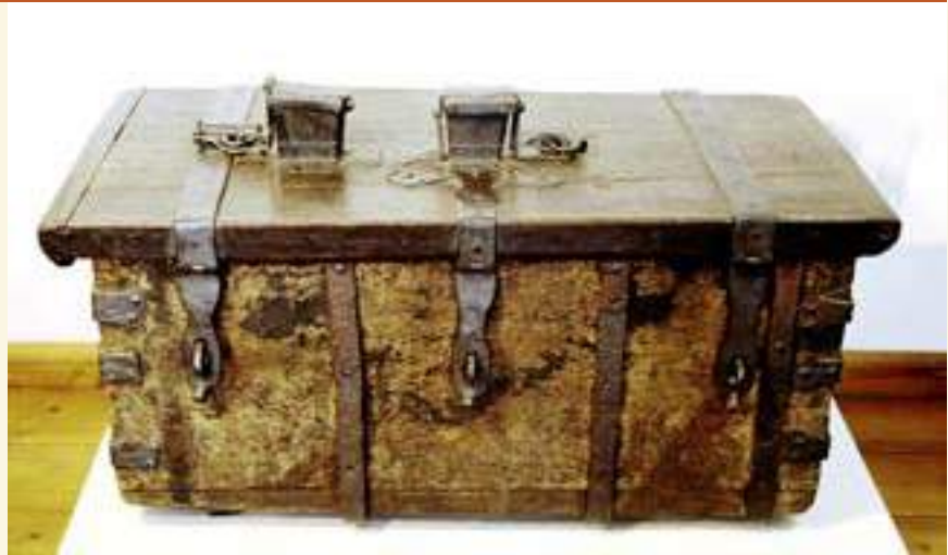
Gemeiner Kasten der Stadtpfarrkirche St. Laurentius Havelberg, 1545