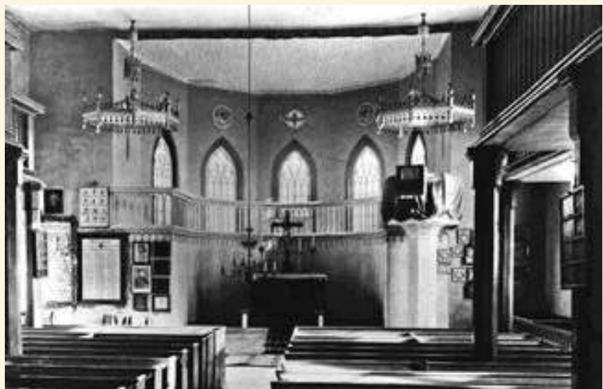
Innenansicht Kirche Friedland um 1932

In vielen Kirchen der Region sind mit unterschiedlichen Begründungen (Brandschutz, größere Baumaßnahmen u. a.) die Kronen und Kränze ab dem letzten Drittel des 19. Jahrhunderts beseitigt oder im günstigsten Falle auf die Kirchenböden verbannt worden. Ein prominentes Bedauern über diesen Umgang mit einer Gedenkkultur ist von Theodor Fontane überliefert. Er