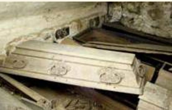
Vorzustand der Grablege der Familie von Graevenitz