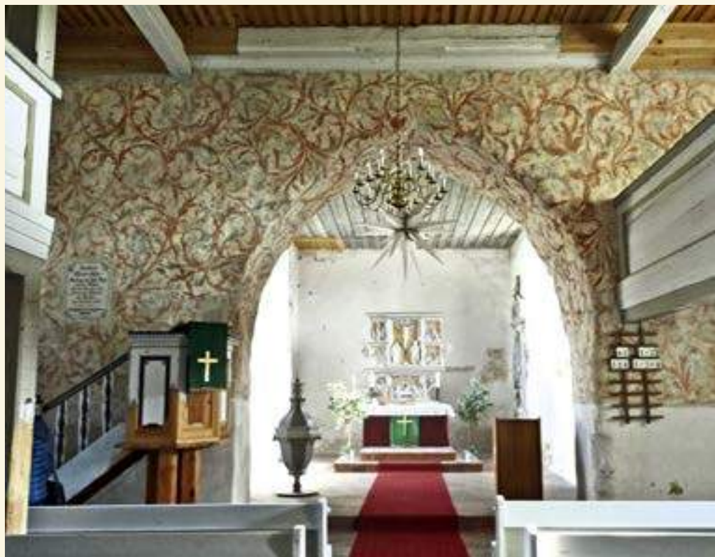
Blick in den Altarraum