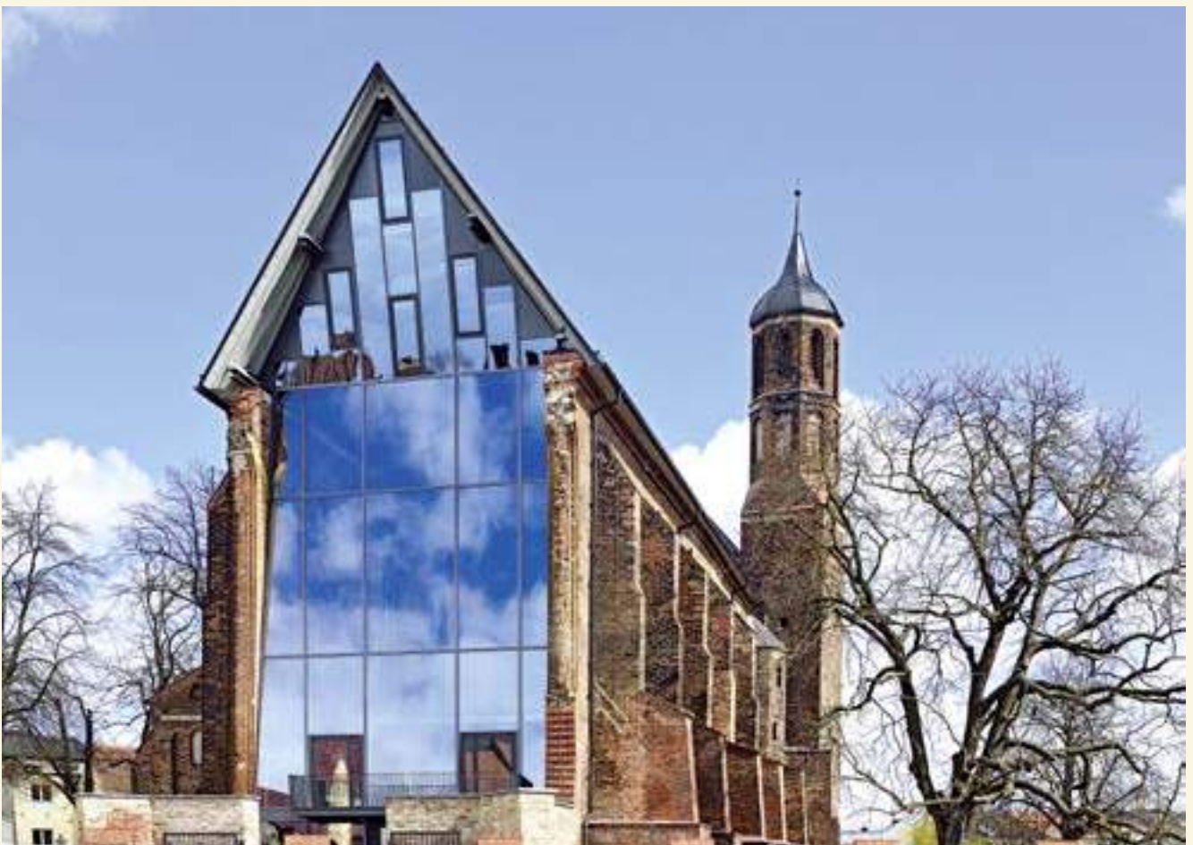
Johanniskirche nach der Instandsetzung 2015 von Westen; Foto: Stefan Melchior

Der Blick in die von innen sichtbare Stahl-Holz-Konstruktion des steilen Dachstuhls gibt dem Hauptschiff eine atemberaubende Atmosphäre. Die hohen Seitenwände neigen sich noch immer deutlich nach Süden. Dieses seit Jahrhunderten andauernde Problem ist nun unter anderem durch Bohrpfähle zur Fundamentstabilisierung gelöst. Die gotischen Spitzbogenfenster wurden mit weißem Antikglas geschlossen. Ihr schönes steinernes Maßwerk ist nur noch teilweise vorhanden, wurde jedoch auch nicht ergänzt – getreu dem Grundsatz: Erhaltenes behutsam bewahren, Verlorenes nicht ersetzen. Das galt selbst für den historischen Putz: Jeder kleinste Rest wurde sorgsam gesichert, Fehlstellen nicht kaschiert. Und besonders deutlich wird dieses Prinzip an der Westfassade. Statt einer Rekonstruktion setzte man die moderne Glaswand demonstrativ zwischen die Abbruchkanten der historischen Mauerreste. Sichtbar bleibt eine offene Wunde.