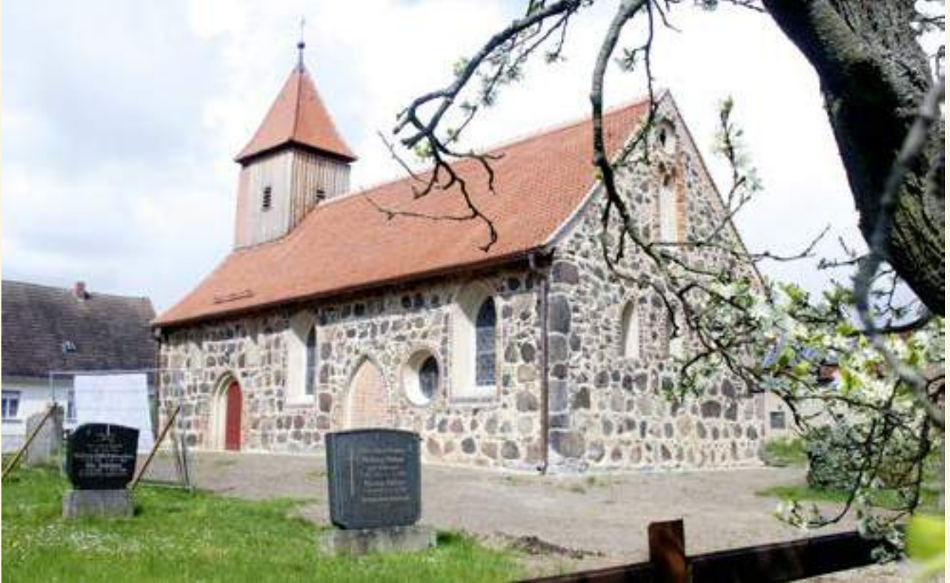
Die sanierte Dorfkirche in Garrey (Potsdam-Mittelmark)