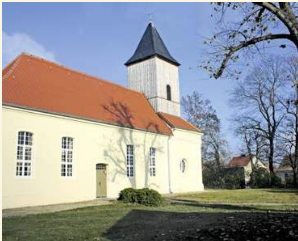
Dorfkirche Märkisch Wilmersdorf von Südwesten

Der Förderkreis Alte Kirchen konn- te bei diesen drei Sanierungsvorhaben, von denen zwei zu Anfang hoffnungs- los aussahen, maßgeblich mitwirken, und zwar nicht nur durch seine ver- hältnismäßig kleinen Finanzhilfen, sondern vor allem durch seine Vermitt- lung anderer Geldgeber und durch Ideen. Er ist also weit mehr als ein Geldsammler und -verteiler, was oft übersehen wird. Aller guten Dinge sind drei – nicht nur drei restaurierte wunderschöne Dorfkirchen, sondern auch drei wesentliche Elemente für eine Sanierung: Engagement, Fantasie und Ausdauer. Etwas Glück dabei kann auch nicht schaden, dann kommt das Geld (fast) von selbst. —