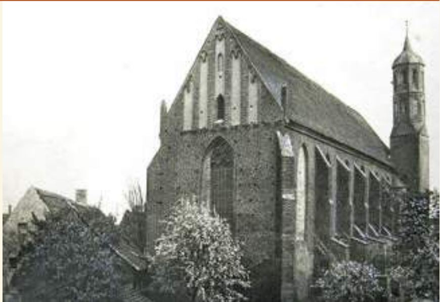
Blick auf die Johanniskirche von Westen, vor 1945; Foto: Bildarchiv Stadt Brandenburg an der Havel

Begonnen hatte die Geschichte im 13. Jahrhundert, als das Franziskanerkloster Ziesar in die Altstadt Brandenburg verlegt wurde. Die der Armut verpflichteten Mönche bauten eine schlichte, schmucklose Backsteinkirche auf rechteckigem Grundriss, der bis heute erkennbar ist. Zwei Jahrhunderte später wurde noch einmal um- und ausgebaut. Im Osten entstand der polygonale Chor, die Wände des Kirchenschiffs wurden aufgestockt, die Fenster vergrößert, Chor und Schiff eingewölbt. Im Norden kam ein Seitenschiff dazu, die Kirche erhielt ihren Glockenturm. Im Wesentlichen in dieser Gestalt war sie über Jahrhunderte ein Wahrzeichen der Altstadt. Sie hatte Bestand beim Niedergang des Klosters nach der Reformation, war