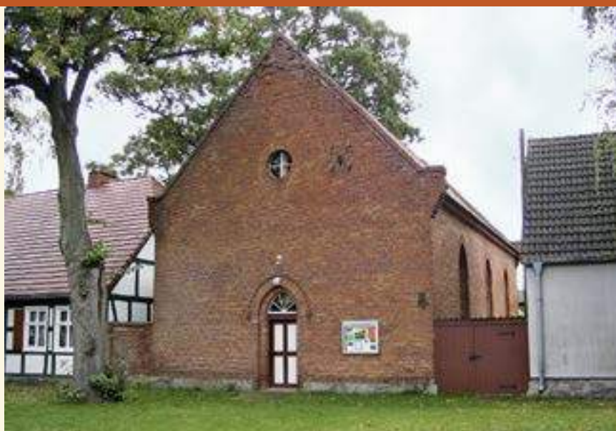
Alt-lutherische Kirche in Fredersdorf

Anlässlich des 300. Jubiläums der Reformation im Jahr 1817 veröffentlichte König Friedrich Wilhelm III. einen Aufruf zur Vereinigung der lutherischen und der reformierten Kirche in Preußen zu einer einheitlichen protestantischen – unierten – Kirche. Nachdem sich 1539 Kurfürst Joachim II. zum Luthertum bekannt hatte, war sein Urenkel Johann Sigismund am Weihnachtstag 1613 zum reformierten Bekenntnis übergetreten.