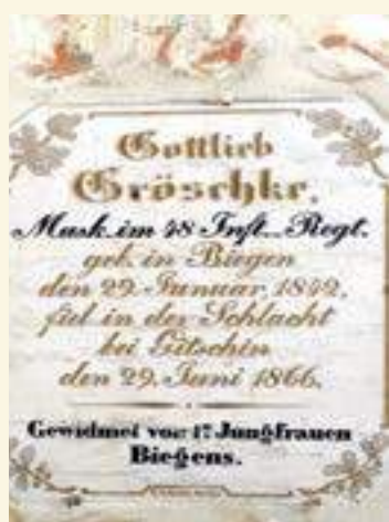
Gedenktafel für den Musketier Gottlieb Gröschke

Neben dem Altar fällt der Blick auf ein farbig gefasstes Sandstein-Epitaph: In Lebensgröße zeigt es den 1601 im Alter von 27 Jahren ver-