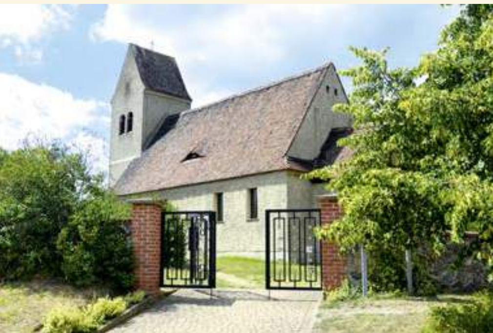
Die Dorfkirche Blankensee (Potsdam-Mittelmark) von Südwesten