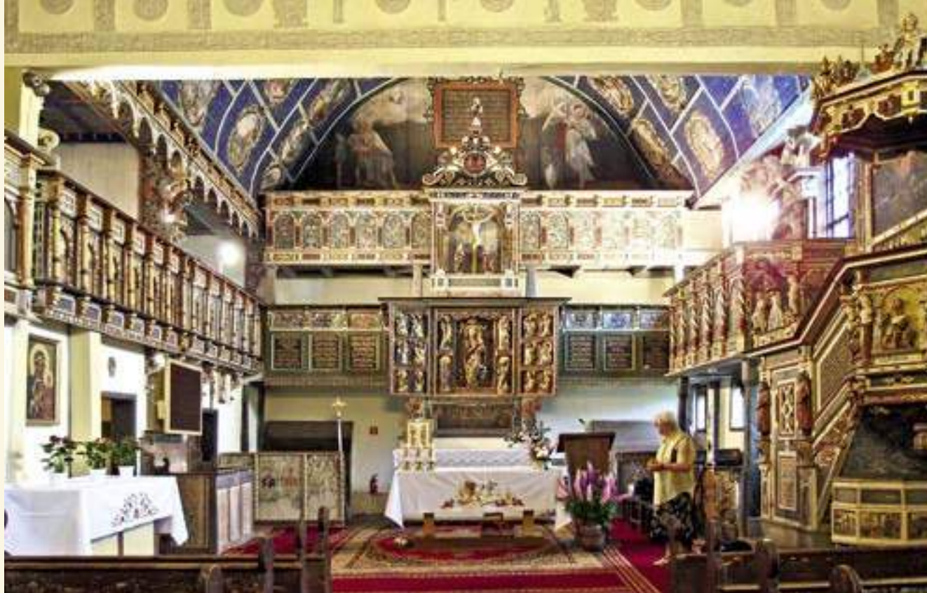
Blick in den Altarraum

Die kubische Form des Taufbeckens zeichnet sich im Vergleich zu zeitgenössischen Taufbecken beispielsweise aus Pommern (z. B. in Dobra/Daber, Anfang des 17. Jh.) durch eine feinere und schlankere Gestalt aus.