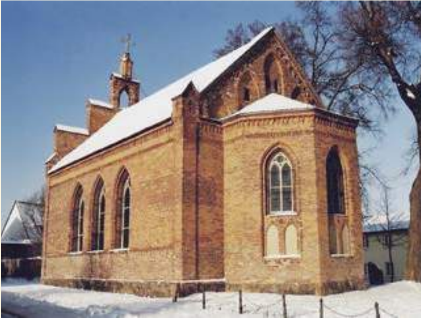
Altlutherische Kirche St. Martin Angermünde

zerstört. Der Chorraum mit einem filigranen Retabel inmitten einer auffälligen Altarwand, dem Altartisch mit Sakramentsschranken, Kanzel, Taufe und Lesepult wurde 1968/69 im nüchternen Stil der Zeit modernisiert, wobei auch die bauzeitliche Ausmalung übertüncht wurde. In ihrem originalen Prospekt erhalten blieb die Orgel, ein klanglich sehr schönes zweimanualiges Instrument des Stettiner Orgelbaumeisters Barnim Grüneberg aus dem Jahr 1912.