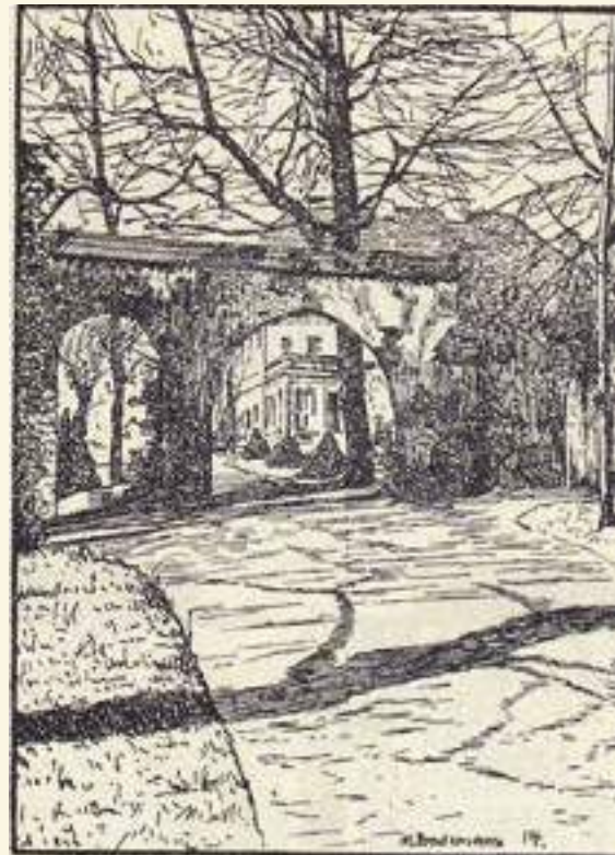
Das Tetzeltent im Kloster Lehnin

Willibald Alexis' Roman „Der Werwolf“ ist keine historische Darstellung der damaligen Geschehnisse. Zwar werden historische Quellen – zum Beispiel der Chronist Peter Hafftiz (um 1530 bis 1601) – wörtlich zitiert, das meiste jedoch entsprang der Phan-