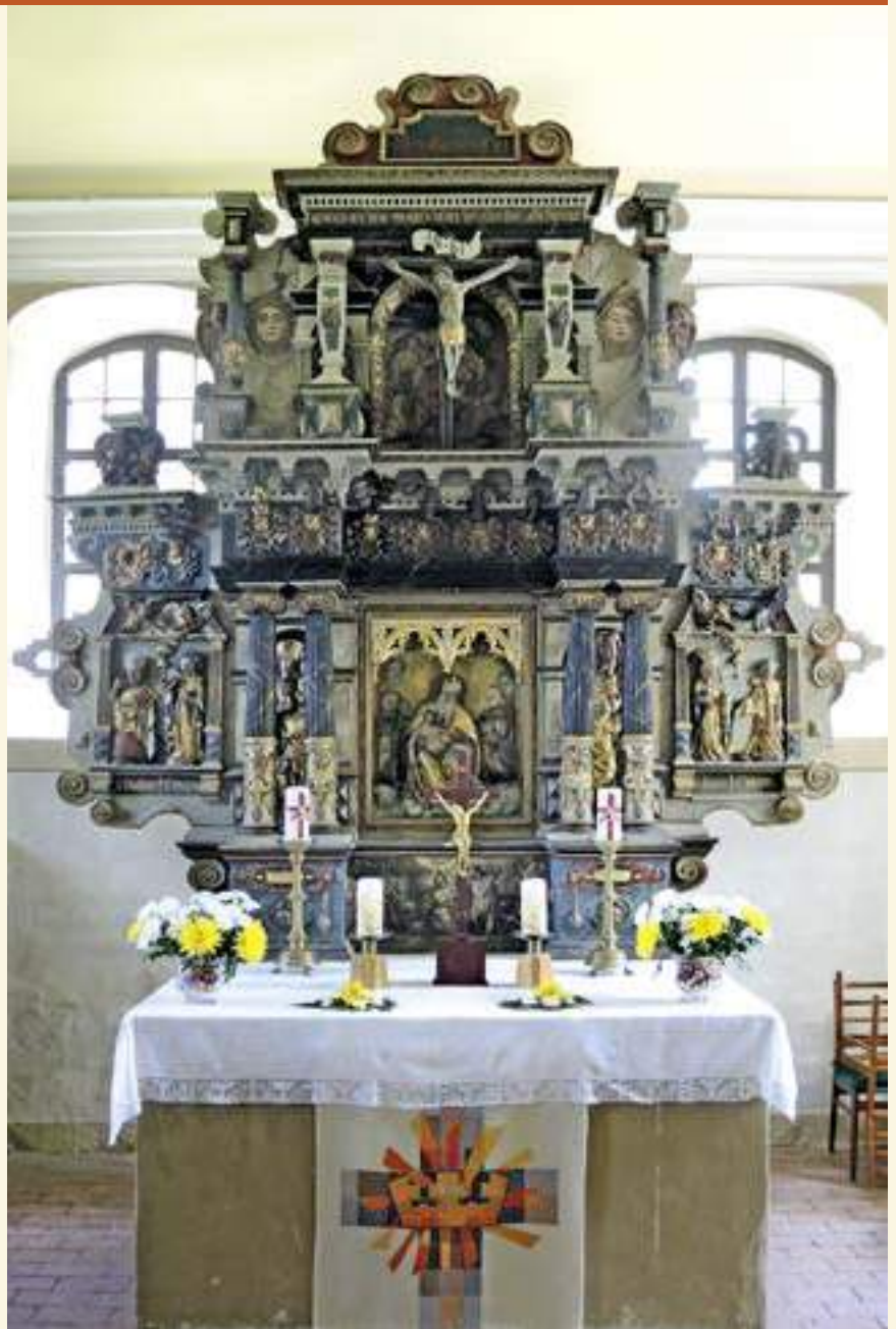
Der Renaissancealtar in der Dorfkirche Börnicke (Havelland)

Der Altar wurde in einer im 16. Jahrhundert modernen Renaissanceform errichtet und reich mit Säulen, Voluten und wuchtigem Gebälk dekoriert. Der zentrale Schrein ist mit einem zweibogigen Schleierbrett geschmückt. Darunter passen maßgenau die beiden gotischen weiblichen Figuren, die sich heute hinter den flankierenden Säulenpaaren verbergen. Eine der beiden ist Maria mit dem Jesuskind auf dem Arm. Die Altarwand und die Wangen zeigten mehrere Gemälde, von denen nur noch drei sichtbar sind. Dazu gehören die Taufe Christi in der Predella und (heute verborgen hinter zwei Pfeilern im Obergeschoss) Darstellungen der ehernen Schlange und