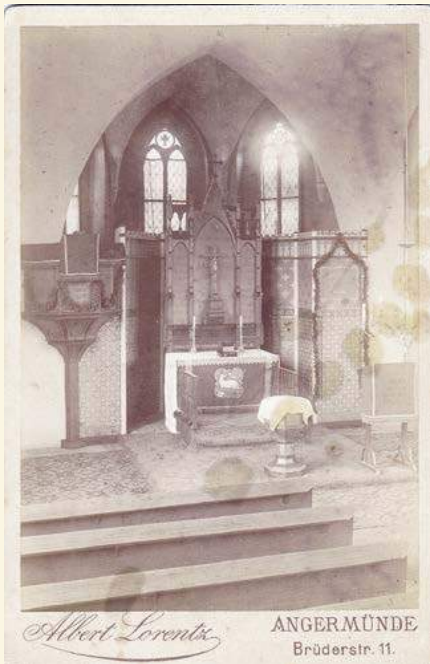
Altarraum der St. Martinskirche Angermünde um 1900; Foto: Archiv Gotthard Wollenberg

hausstrafe wegen Aufwiegelung verbüßt hatte.