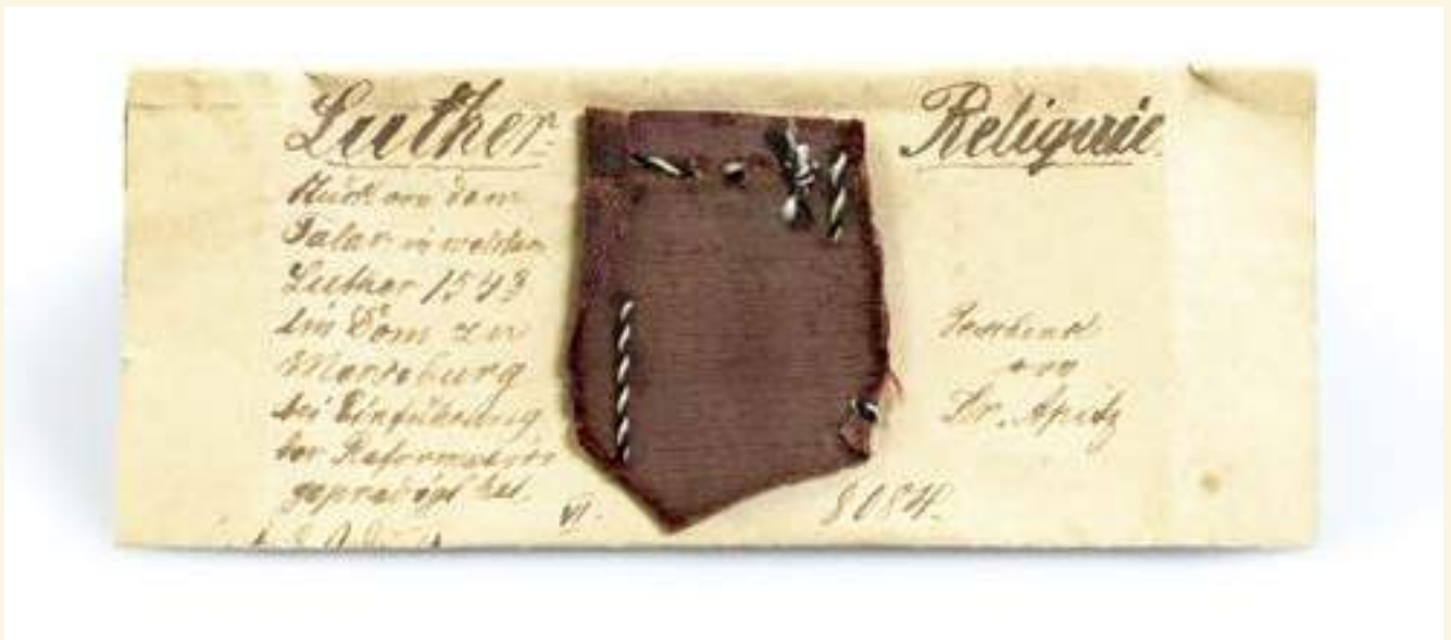
„Luther-Reliquie“, 16./19. Jh., Sammlung Stadtmuseum Berlin; Foto: Michael Setzpfandt

Berliner St. Marien-Kirche haben. Als kleine Hilfe zur besseren Lesbarkeit dieser Kunstwerke und ihrer theologischen, kunst- und stadtgeschichtlichen Bezüge wird jedem Besucher eine kostenlose Broschüre angeboten. Nicht zuletzt dieses verdanken wir auch einer großzügigen Förderung durch die Evangelische Landeskirche (EKBO).