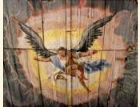
Rackith, Holzdecke mit Engel