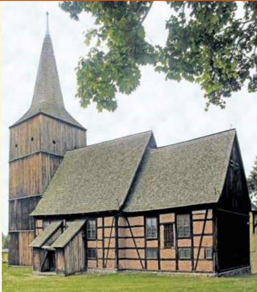
Die Dorfkirche in Klemzig; Foto: Magdalena Poradzisz-Cincio

Im Jahr 1576 fand in Klemzig die offizielle Einführung der Reformation statt. Der erste evangelische Pfarrer in Klemzig war Balthasar Nevius aus Sommerfeld (poln. Lubsko), der im Jahre 1577 die Konkordienformel in Klemzig unterschrieb. Pastor Nevius