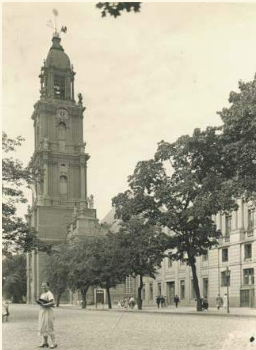
Die Garnisonkirche Potsdam von Südosten

Mit seiner Initiative stand Friedrich Wilhelm III. nicht allein. In vielen Regionen Deutschlands wurden zu Beginn des 19. Jahrhunderts Kirchenvereinigungen, d.h. „Unionen“ eingeleitet und umgesetzt. Den Anstoß dazu bot vielerorts das Reformationsjubiläum 1817. Die erste Union, die im Gedenkjahr der Reformation entstand, war im August 1817 die im Herzogtum Nassau – eine Vollunion, mit Bibel, Apostolischem Glaubensbekenntnis und Augsburger Konfession als Bekenntnisgrundlage.