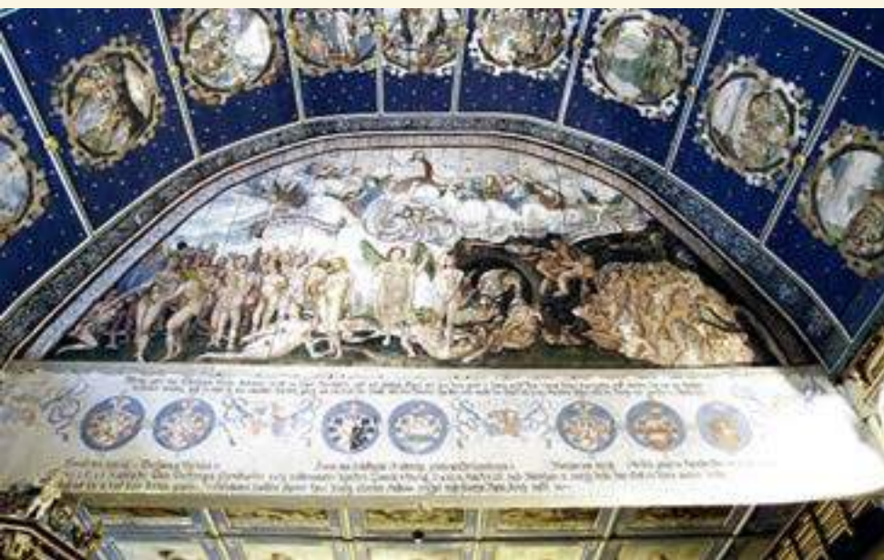
Darstellung des Jüngsten Gerichts an der Westwand des Chorraumes

Ein weiteres ikonographisch interessantes Ausstattungstück ist die 1614 gestiftete Kanzel . Der Kanzelkorb wurde „laut der Tradition“ mit Reliefdarstellungen der vier Evangelisten (Matthäus, Markus, Lukas und Johannes) zwischen Hermen verziert. Die Unterseite des Baldachins zeigt eine gemalte Darstellung der Heiligen Dreifaltigkeit mit zwei anbetenden Engeln. In kunsthistorischer Hinsicht sind die untypischen vollplastischen Darstellungen von Martin Luther und Philipp Melanchthon an der Kanzeltür besonders bemerkenswert sowie die ungewöhnlich drastische Szene der Enthauptung Johannes des Täufers, die sich am hinteren Wändchen, an der Seite des Chorraumes befindet. Diese Märtyrerszene kann sicherlich im Zusammenhang mit den religiösen Unruhen während der Stiftungszeit der Kanzel erklärt werden – in politischer und religiöser Hinsicht handelte