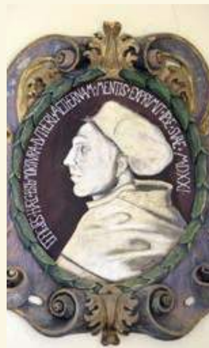
Gedenktafel für Martin Luther in der Dorfkirche Blankensee; Foto Bernd Janowski

Es ist ganz sicher nicht gerade das Fahrrad, was man spontan mit Luther verbindet. Schließlich hat er seine Visitationen per pedes oder mit Pferd und Wagen absolviert. Aber im Jahre 2017, dem Lutherjahr, lässt sich so ziemlich alles mit dem großen Reformator in Verbindung bringen. Wandern, Radfahren und Skaten auf den Spuren der Reformation! Dazu gibt es eine Fülle von unterschiedlichsten Angeboten. Hier nun der Versuch, Luther auf dem Fahrrad hinterherzufahren. Aber nicht nur das: Schlüpfen wir ein Stück weit in seine Rolle und „visitieren“ dabei auf diesem Weg kleine Dörfer, schauen uns an, wie es heute um die Dorfkirchen am Wegesrand bestellt ist.