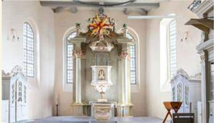
Stadtkirche St. Lambertus Brück, Blick in den Altarraum; Foto: Helmut Kautz

In Brück , in der vorzüglich restaurierten St. Lambertuskirche, „luthert“ es nun authentisch. Anlässlich der Visitation am 17. Januar 1530 war Martin Luther in Brück zu Gast und hat dort mit großer Wahrscheinlichkeit auch gepredigt. Auf dem Kirchenvorplatz ist eine sehenswerte Ausstellung zur Reformationgeschichte aufgebaut. Die Kirche selber ist tatsächlich ganztägig geöffnet, verfügt per godspot über freies WLAN. Und es lohnt sich unbedingt, an einem Sonntag nach Brück zu kommen, um Pfarrer Helmut Kautz in der rasselvollen Kirche predigen zu hören.