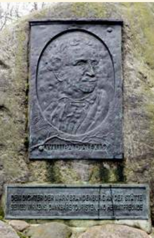
Bildtafel am Willibald Alexis-Denkmal in Kloster Lehnin

In seinem vermutlich 1872 entstandenen Text über Willibald Alexis versichert Theodor Fontane: Aber so gewiß es ist, daß er die Menge der Leser nie ansprechen wird, so gewiß ist es auch, daß die kleinen Willibald-Alexis-Gemeinden noch auf lange hin fortleben werden und innerhalb dieser der Gottseidank nie aussterbende „Enthusiast“, der herbst- und winterlang, während der Sturm den Schnee bis unter die Fenster fegt, sich in seinen märkischen Klassiker vertiefen und bei Gestalten wie Götz von Bredow, Hake von Stülpe ... dankbarst des Schöpfers dieser Gestalten gedenken wird.