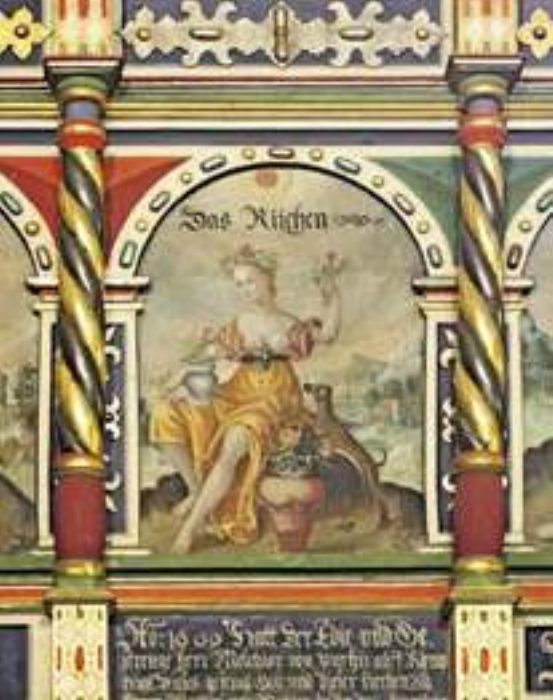
Allegorische Darstellung an der Südempore

es sich um ein für einen lutherischen Prediger unsicheres Zeitalter. Es sei nur daran erinnert, dass erst gegen Ende des Jahres 1613 Kurfürst Johann Sigismund zum Calvinismus konvertiert war. Bei der Analyse der weiteren Darstellungen an der Kanzel ist festzustellen, dass hier in Wort und Bild die Würde des Predigeramtes betont wird.