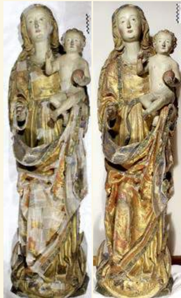
Maria mit dem Christuskind vor und nach der Konservierung

Die Gemeinde verfolgte, stolz auf die Qualität und Schönheit der ihr anvertrauten Ausstattungstücke, die verantwortungsvolle Arbeit Carolin Pults. Vorsichtig wurden die Figuren aus dem Schrein gelöst, um eine gründliche Reinigung vorzunehmen. Mit viel Fingerspitzengefühl konnten jahrhundertalte Verschmutzungen gelöst werden, um dann brüchige Farbstellen zu befestigen, Fugen zu schließen und Fehlstellen auszugleichen. Dabei kamen Hasenhaut- oder Störleim zum Einsatz, organische Festigungsmittel, deren besondere Eigenschaften je nach Notwendigkeit das beste Ergebnis boten. Kleinste Farbschollen wurden wie in einem Puzzle zusammengefügt, gänzlich verlorene Partien dezent angeglichen, feinste Späne zur Sicherung an lockeren Stellen eingesetzt. Besonders aufwendig war die Konservierung des Pressbrokats an der Rückwand des Schreins. Hier konnte Carolin Pult nur mit Hilfe von Japanpapier die brüchige Oberfläche festigen, sonst hätte selbst eine vorsichtige Berührung mit dem Pinsel weitere Schäden verursacht.