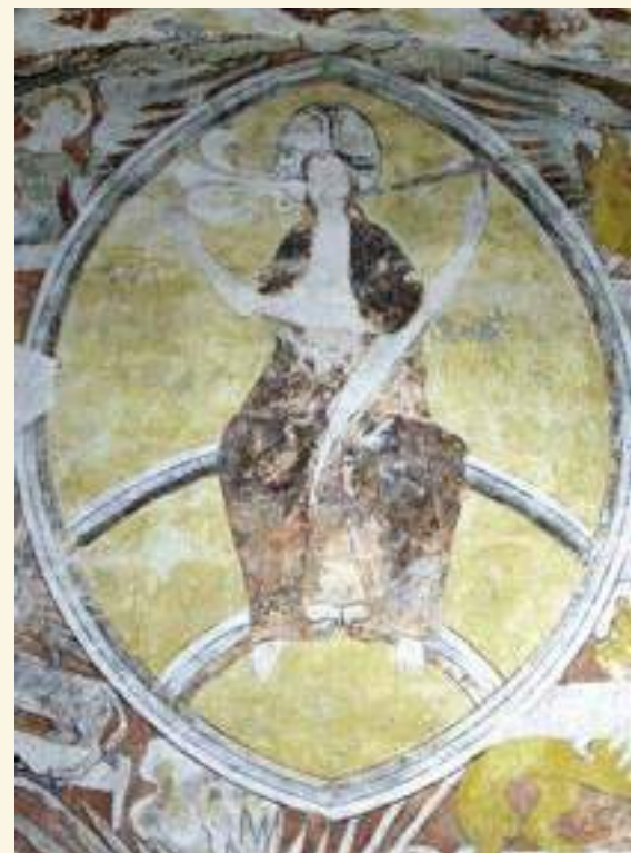
Freigelegte Wandmalerei im Chorraum; Foto: Bildarchiv Stadt Brandenburg an der Havel

Am 12. Mai um 15 Uhr wird im Rahmen des „Tages der Städtebauförderung“ in der St. Johanniskirche eine umfassende Publikation zur Geschichte, Bauforschung, Archäologie und Sanierung des Kirchengebäudes vorgestellt.