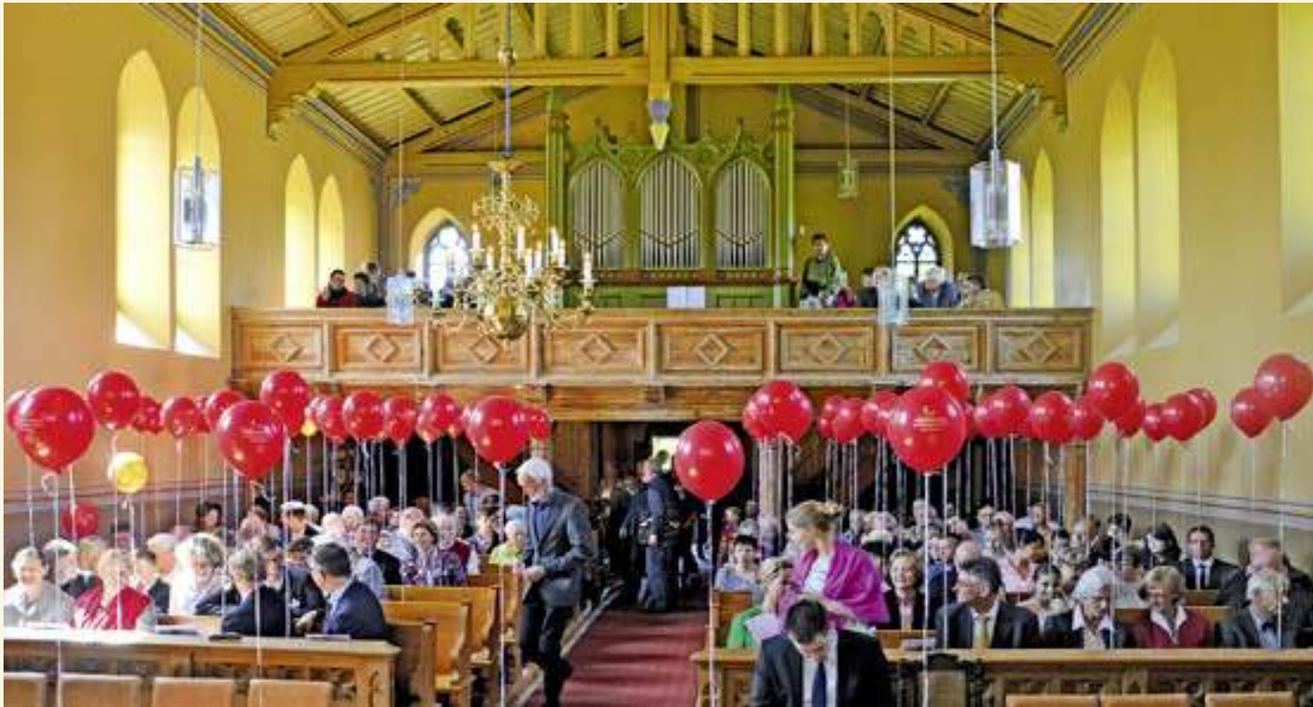
Konfirmationsfeier in der Dorfkirche Brodowin (Barnim)