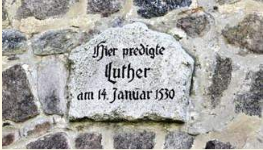
Gedenkstein über dem Westportal der Stadtpfarrkirche St. Marien in Bad Belzig

Die Orte, an denen Luther weilte, waren bestrebt, dies zu dokumentieren. Beeindruckend lang ist das Reisekalendarium des Reformators. Märkischen Boden jedoch betrat er auf seinen zahlreichen Visitationsreisen nur im Bereich der heutigen Landkreise Potsdam-Mittelmark und Elbe-Elster. So soll er am Brunnen von Dietersdorf (Potsdam-Mittelmark) gerastet und seinen Durst gelöscht haben; der Ort hat seither einen Lutherbrunnen im Zentrum. In Treuenbrietzen habe er unter einer Linde vor der Kirche gepredigt, die noch heute als Lutherlinde zu bestaunen ist.