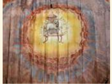
Waltersdorf, Holzdecke mit Gotteslamm