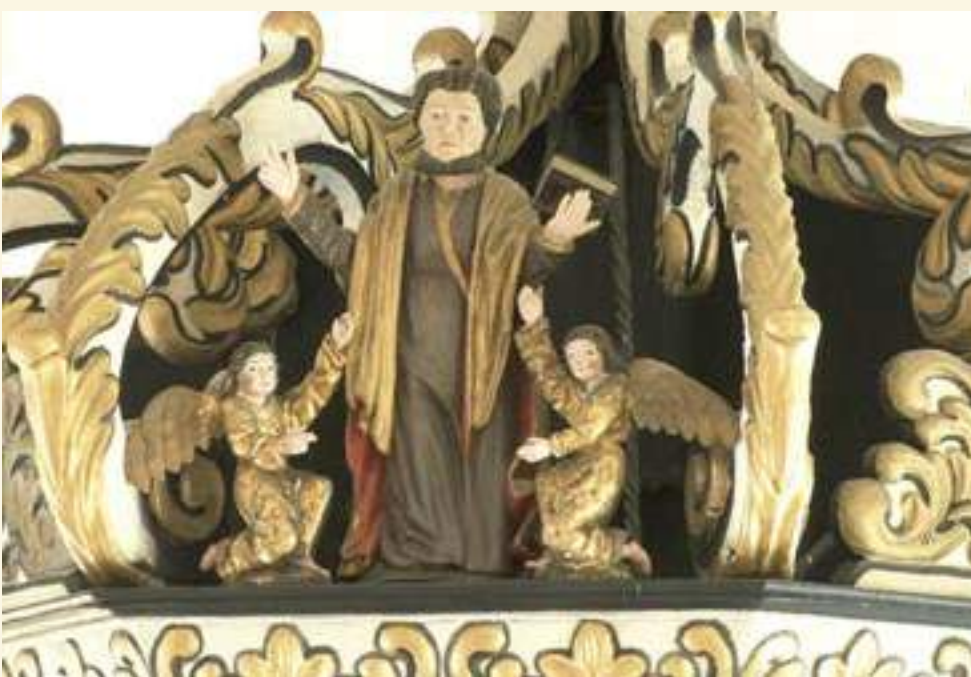
Lutherfigur auf dem Schalldeckel der Kanzel in der Dorfkirche Selbelang (Havelland)

Das erste öffentliche Denkmal für den Reformator überhaupt schuf 1821 Johann Gottfried Schadow mit einem Baldachin von Schinkel für Wittenberg, dem bald viele – zum Beispiel in Halle, Leipzig, Dresden, Magdeburg und Erfurt – folgten. Im 19. Jahrhundert wurden die Denkmale nicht vorrangig als Mahnung für das rechte Glaubensbekenntnis errichtet, sondern die monumentale Würdigung Martin Luthers reihte sich ein in die anderer herausragender Persönlichkeiten. In diese Kategorie gehört ebenfalls das Standbild Luthers vor der Marienkir-