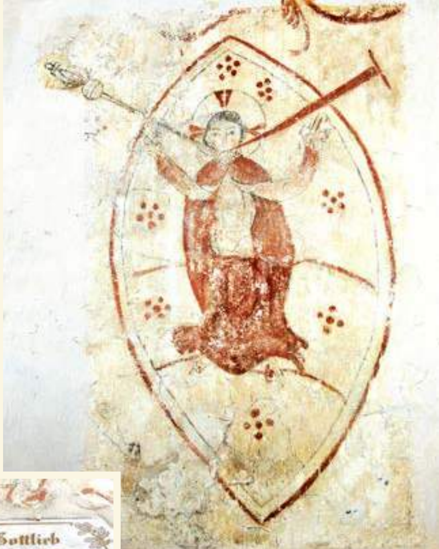
Christus in der Mandorla

Auffällig ist ein Sandstein-Retabel aus der Spätrenaissance, dessen protestantisches Bildprogramm den Betrachter in das Heilsgeschehen von Passion und Auferstehung hineinnimmt: Im Zentrum Christus am Kreuz, daneben Maria und Johannes, in der Predella das Abendmahl. Einen Flügelaltar imitierend, sieht man neben der Kreuzigungsszene vier Stationen der Passion: Gebet im Garten Gethsemane, Geißelung, Dornenkrönung und Kreuztragung. Alle Figuren sind vollplastisch vor einem Goldgrund ausgearbeitet; zierliche Goldrahmen und vier Wappen weisen auf adlige Stifter bzw. Patrone. Die Bekrönung ging im Dreißigjährigen Krieg verloren, als Kirche und Dorf von marodierenden Truppen verwüstet worden waren. Später bildete ein hölzernes Gottesauge im Strahlenkranz den Abschluss; nach der Restaurierung des Altars (1957) verzichtete man darauf.