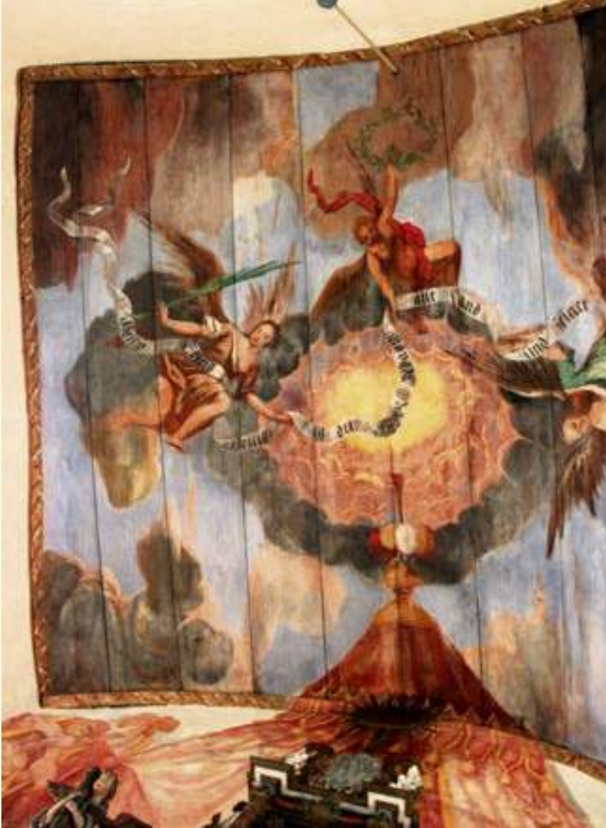
Niebendorf, Holzdecke im Chorraum mit Engeln