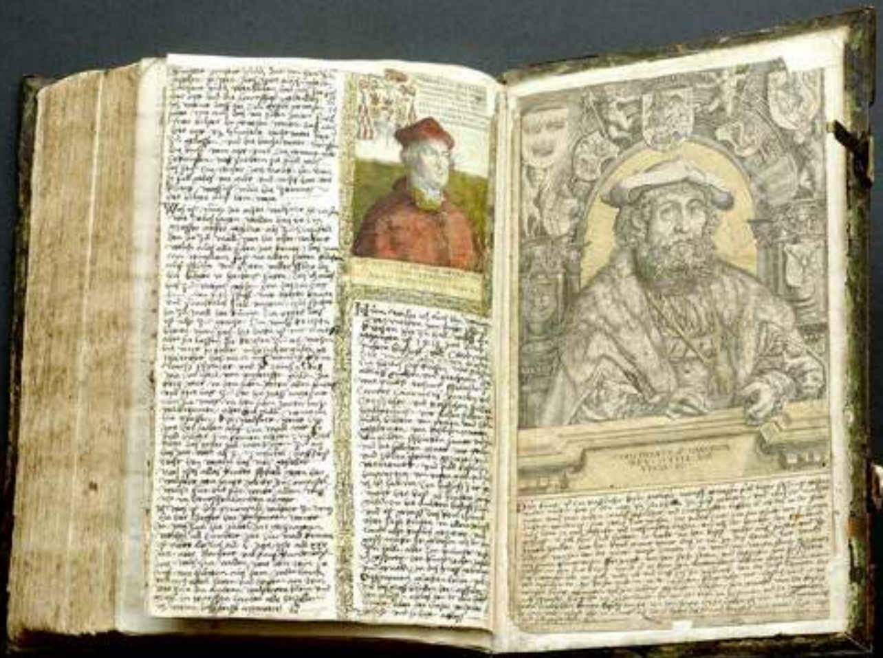
Bibel des Hans Plock (um 1490 bis 1570); Stadtmuseum Berlin; Foto: Carl Habetur