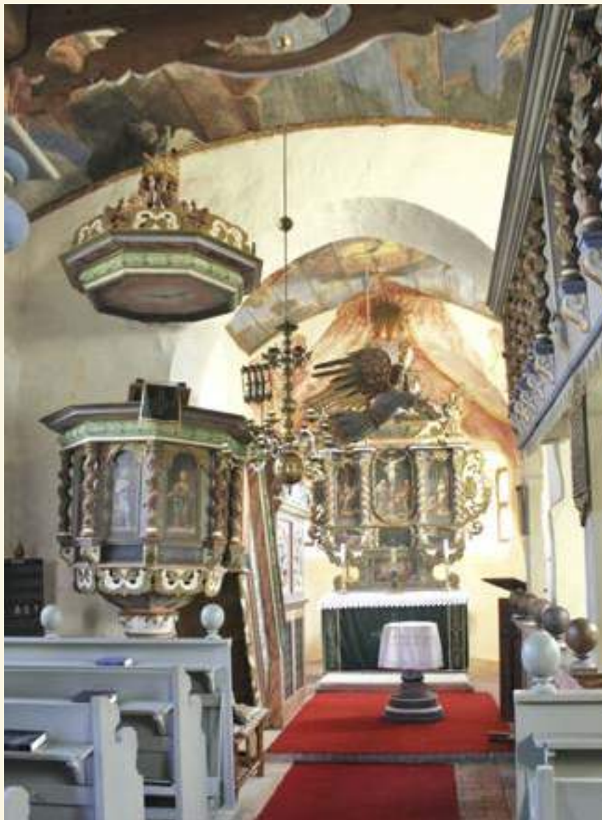
Dorfkirche Niebendorf (Teltow-Fläming), Innenraum nach Osten

FAK beim Landkreis, dass an der zwei Kilometer entfernten Hauptstraße ein touristischer Wegweiser zur Dorfkirche aufgestellt wurde. Nun kamen vermehrt Besucher, auch Reisegruppen, und der Spendenkorb wurde voller. Nachdem der RBB zur Weihnachtszeit eine Reportage über die Kirche gebracht hatte, besuchten zusammen mit dem FAK Vertreter der Deutschen Stiftung Denkmalschutz Waltersdorf und publizierten einen großen Bericht in ihrer Zeitschrift „Monumente“. Das war der Durchbruch. Es wurde von den Lesern so viel gespendet, dass der erste Bauabschnitt geplant werden konnte. Aber es schien vernünftiger, nicht nur das Dach, sondern auch die wunderbar ausgemalte Decke, die an den Dachbalken befestigt ist, in diesen Bauab-