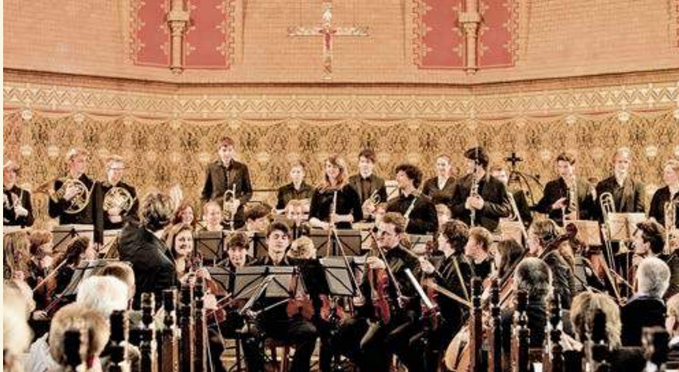
Die Junge Philharmonie Brandenburg eröffnet „Musikschulen öffnet Kirchen“ in der St. Jakobikirche Luckenwalde 2016; Foto: Uwe Hauth

denburger Dorfkirchensommer ist ein gutes Beispiel dafür, wie wir mit unseren Schätzen auch jenseits der traditionellen Nutzung wuchern können.“ Das sei natürlich leichter möglich in Gotteshäusern, die etwa auf Pilgerpfaden liegen oder Kulturdenkmäler sind, aber es gebe auch anderswo interessante Versuche.