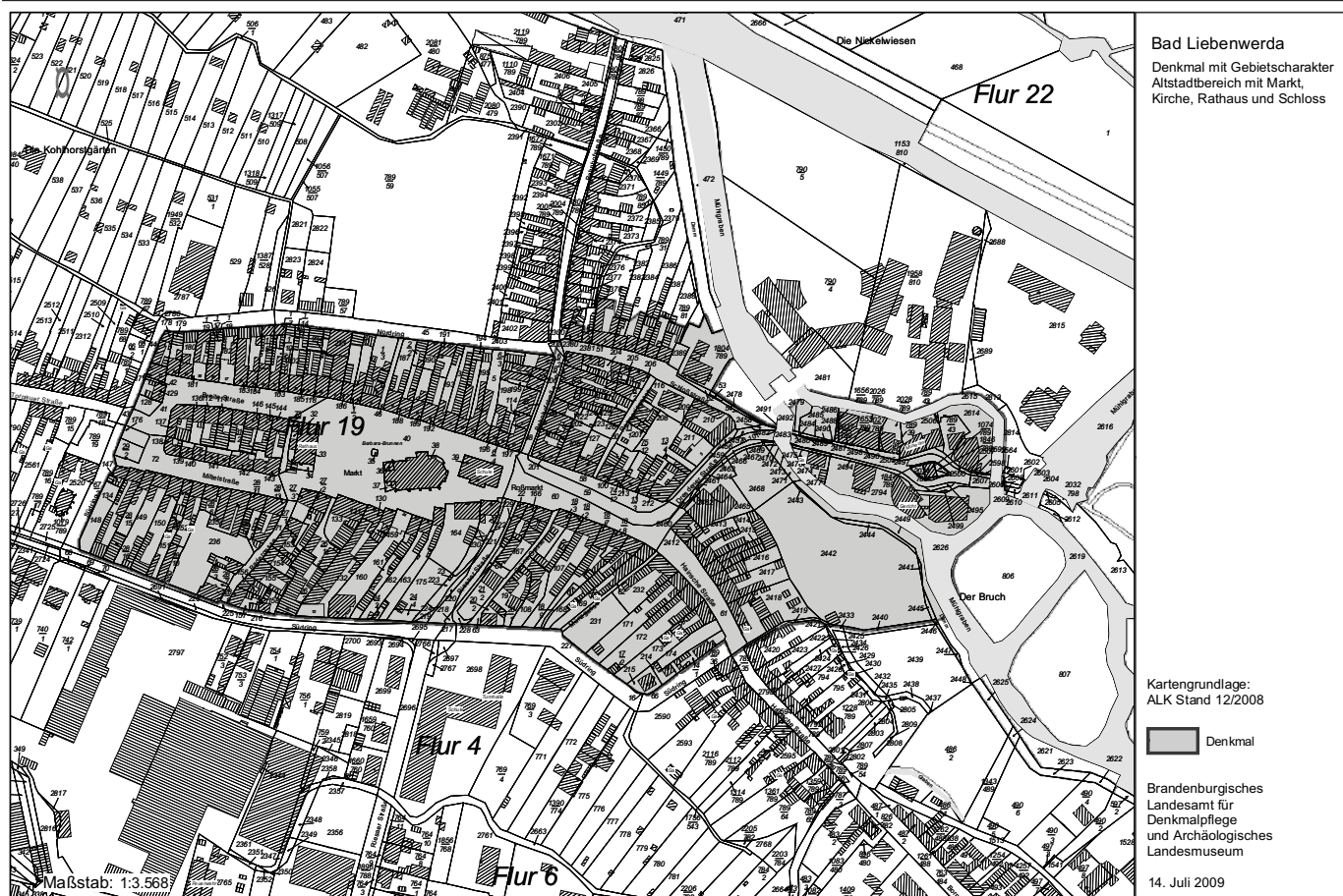
Anlage Übersichtsplan

Bad Liebenwerda Denkmal mit Gebietscharakter Altstadtbereich mit Markt, Kirche, Rathaus und Schloss