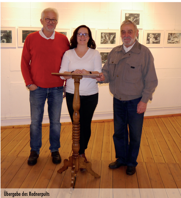
Übergabe des Rednerpults

Bei Interesse bitte direkt beim Bürgermeister melden oder in der Touristinformation.