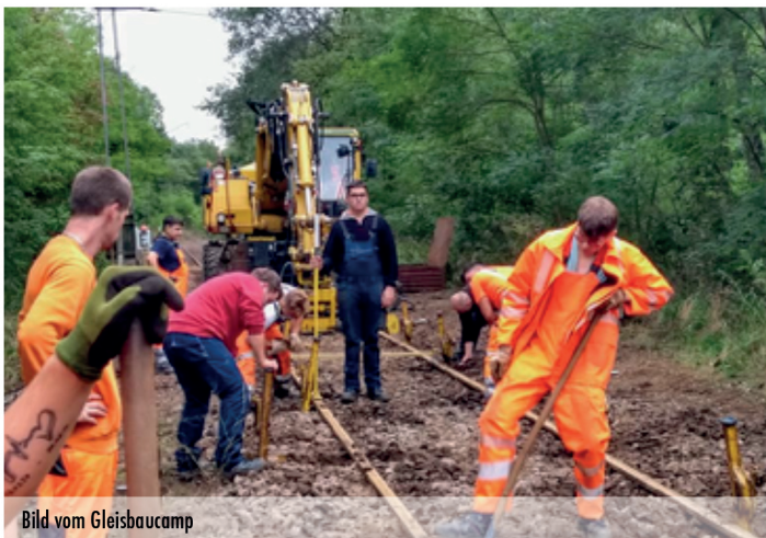
Bild vom Gleisbaucamp