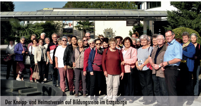
Der Kneipp- und Heimatverein auf Bildungsreise im Erzgebirge

Die Organisatoren des Kneipp- und Heimatvereins „Märkische Schweiz“ e.V.