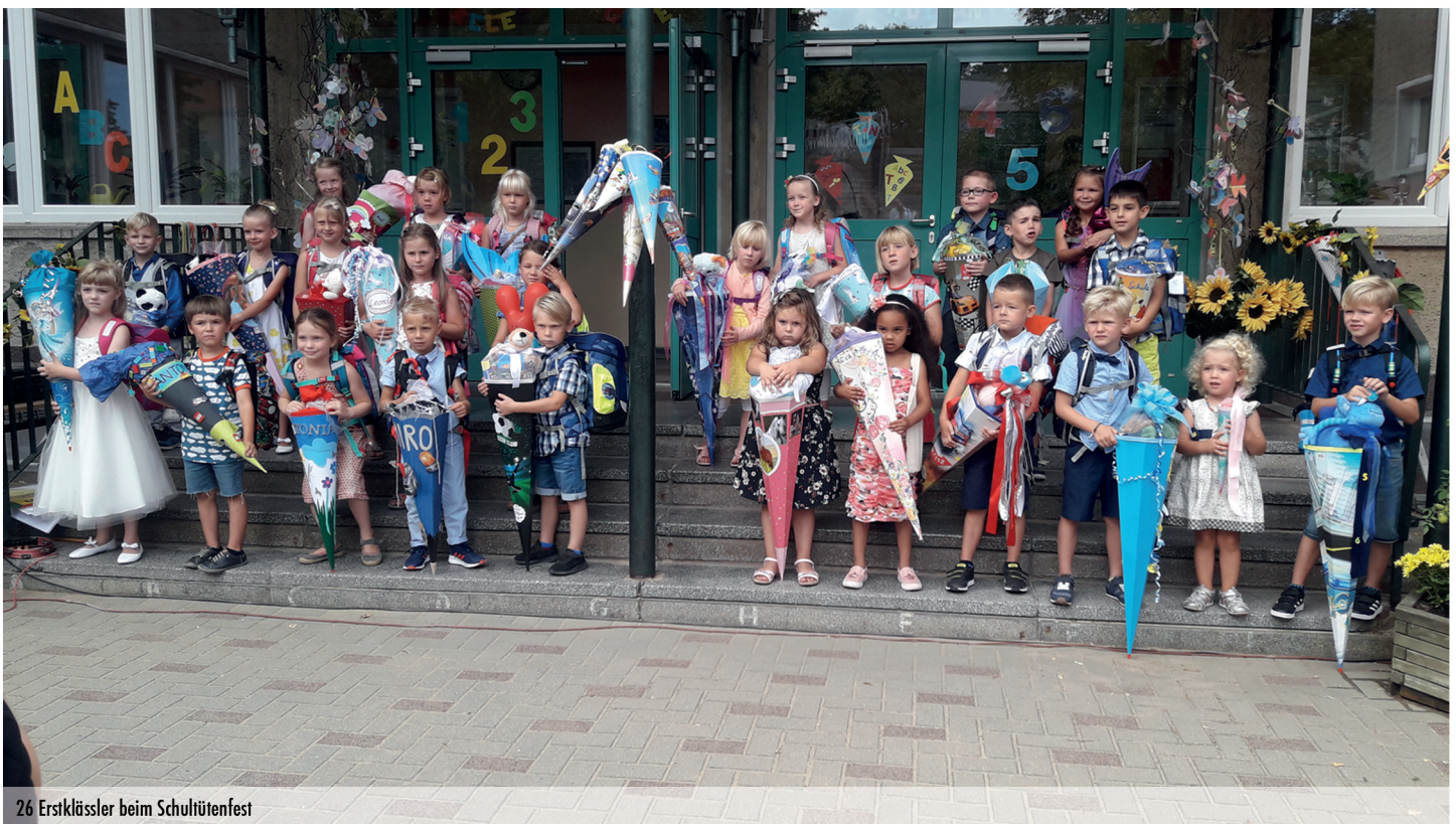
26 Erstklässler beim Schultütenfest