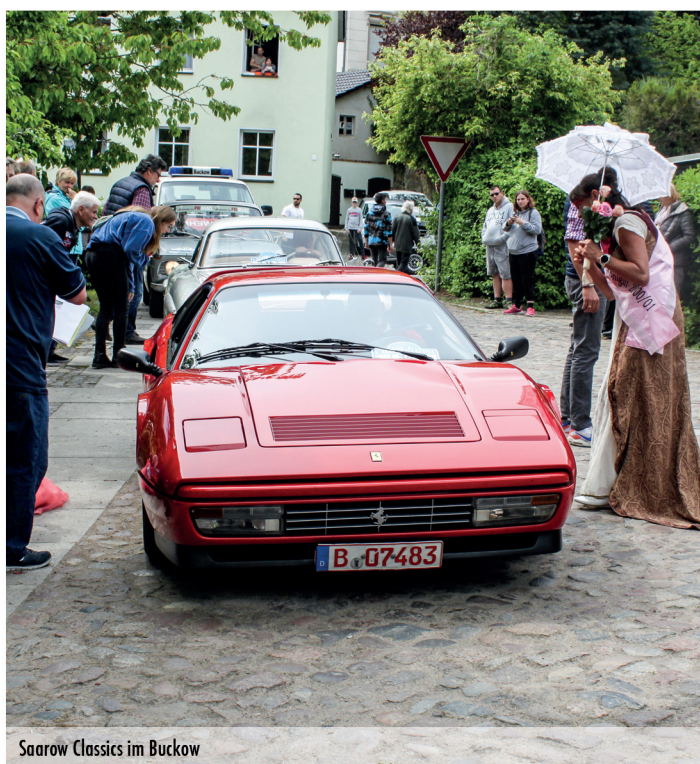
Saarow Classics im Buckow